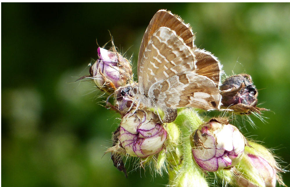
Abb. 1: Weibchen des Pelargonien-Bläulings bei der Eiablage an Geranien (2.9.2014, Theley, Johann-Adams-Mühle, Foto: Winfried Rupp).