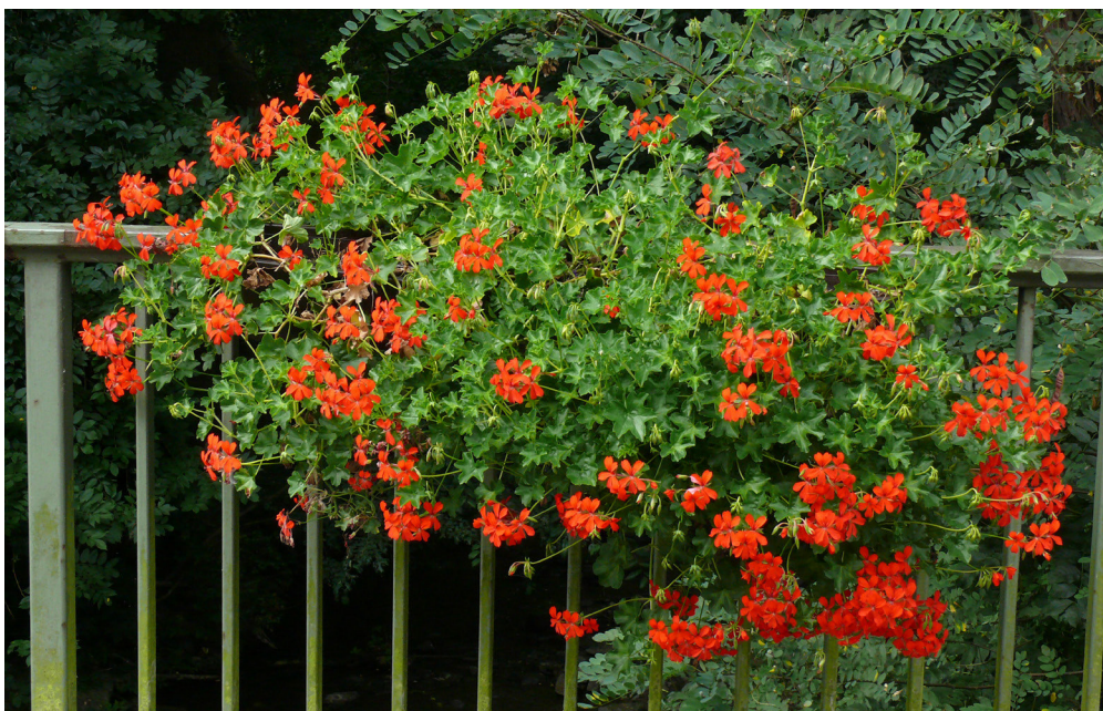
Abb. 7: Klassisch: Geranien an einem Geländer – potenzielles Habitat für den Pelargonien-Bläuling (2.9.2007).