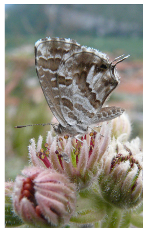
Abb. 2 a, b, c: Der Pelargonien-Bläuling ist recht klein und unscheinbar, insbesondere die braune Oberseite. Aus der Nähe betrachtet ist er jedoch mit seinem unruhigen Unterseitenmuster und seinen beiden Schwänzchen sehr hübsch (a, b: 2.9.2014, Theley, Johann-Adams-Mühle, c: 11.8.2007 Nago, Nähe Gardasee,).