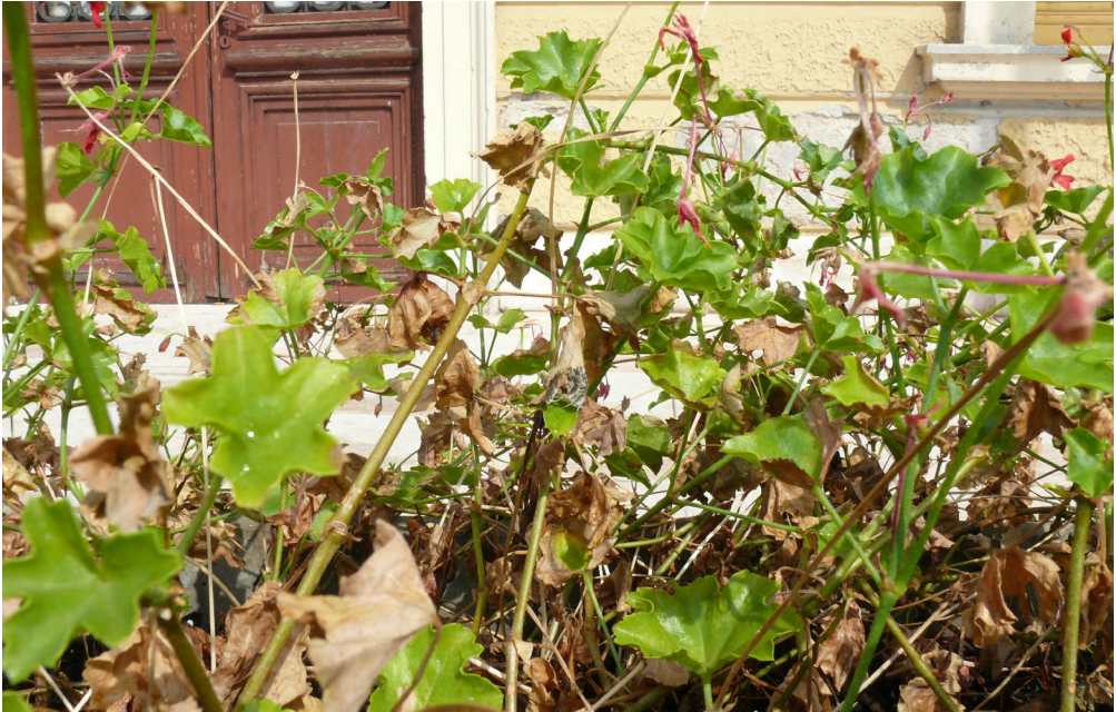
Abb. 3: Etwas ungepflegt aussehende Geranien – die könnten von Raupen des Pelargonien-Bläulings „befallen“ sein. Wer genauer hinschaut, der erkennt zwei balzende Falter und Eier. (13.8.2007, Malcesine/Gardasee, Rathausplatz;).