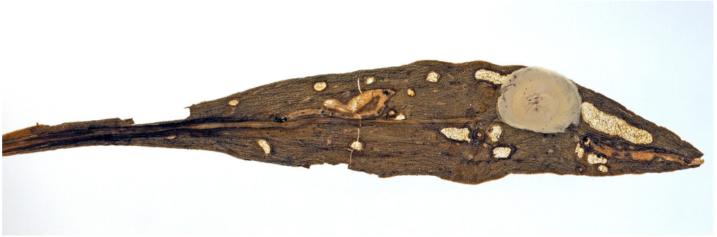
Abb.2: Blatt von Tripolium pannonicum ( Aster tripolium ) mit Minengängen von Bucculatrix maritima STANTON, 1851 (Foto: Edgar Müller, ZfB).