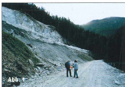
Abb. 1: Steinbruch östlich der Liesingkaralm mit Himmeleck, nahe Wald am Schoberpass.