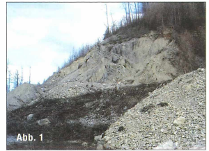
Abb. 1: Der Steinbruch am Nordhang des Greitnerkogel, südlich von Waldstein bei Übelbach.