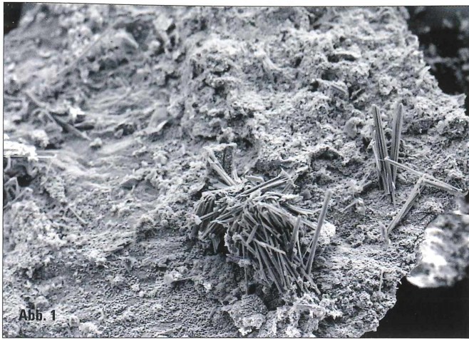
Abb. 1: Jarosit-Rozenit-Kruste mit winzigen isometrischen, aber auch tafeligen Kristallen. Langprismatische, spießige, manchmal parallel verwachsene Kristalle sind Pickeringit. Tagbau am Sattlerkogel, Veitsch. REM-Aufnahme: SE-Modus, Zentrum für Elektronenmikroskopie Graz.