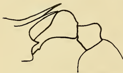
Fig. 3. Tetramorium wagneri n. sp. ♀.

♀. Kopf rechteckig, länger als breit, mit schwach konvexen Seiten und sehr flach ausgebuchtetem Hinterrand. Augen etwas konvex, vor der Mitte, von dem Vorderrand etwa so weit als ihr größter Durchmesser entfernt. Fühlerschaft den Hinterrand des Kopfes nicht ganz erreichend, zweites bis achttes Geißelglied schwach quer; Vorderrand des Clypeus in der Mitte schwach ausgerandet. Mandibeln mit 3 größeren Endzähnen und 4 kleineren, die inneren undeutlich.