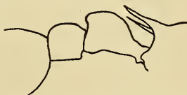
Fig. 4. Tetramorium bicolor Viehm. subsp. n. tricarinatum ♂.

♂. Wie der Typus gefärbt, aber die gelben Teile mehr bräunlich rotgelb, Mandibeln, Scapus der Antennen, Schenkel und Schienen mehr oder weniger dunkel. Kopf kürzer und breiter, mit geraderen Seiten und deutlicheren Hinterecken, in der Form mehr wie guineënsis F.; zwischen den Stirnleisten mit 3 Längsrippen, die sich nach vorn über den Clypeus fortsetzen, dazwischen mit einigen stark verkürzten schwächeren; Untergrund glänzend glatt. Stielchen in der Form sehr ähnlich, die Rückseite des Petiolusknotens viel deutlicher konkav. — L. 3,2–4 mm. — Rawlinsongebirge.