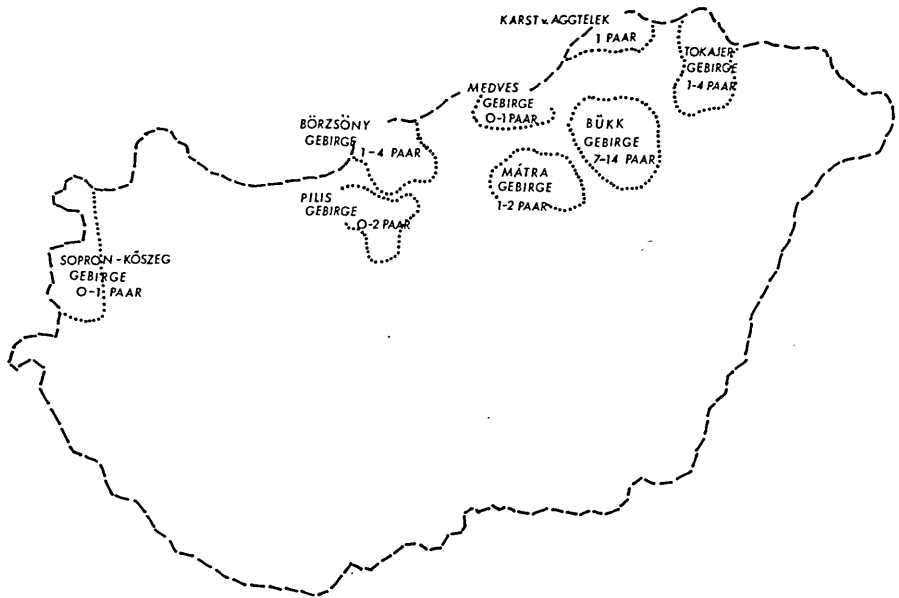
Abb. 1: Die Brutplätze der Wasseramseln in Ungarn. Fig. 1: Breeding distribution of Dippers in Hungary.

Die geographische Lage der Bäche des Bükk-Gebirges wird in Abbildung 2 wiedergegeben. Die Wanderungen der Wasseramseln zwischen den Bächen bzw. den Gebirgen schlüsselt sich wie folgt auf: