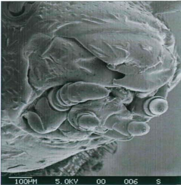
Abb. 3: Mundwerkzeuge von P. phellandrii mit stark sklerotisierten Mandibeln

Im Zuge der Vegetationsaufnahmen wurden auf den sechs Flächen insgesamt 95 Pflanzenarten gefunden, von denen 20 so genannte "Rote-Listen-Arten" sind. Bei der Art Juncus subnodulosus handelt es sich sogar um eine