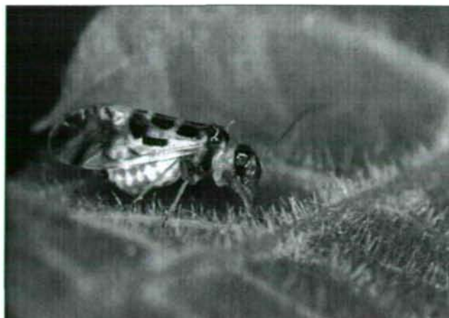
Abb. 2: Habitusbild von Graphopsocus cruciatus (Stenopsocidae). (Zur Verfügung gestellt von Frau Dr. Barbara Knoflach-Thaler, Universität Innsbruck).

andere Merotops feststellen. Nur wenige Arten besiedeln die Bodenoberfläche und die Krautschicht.