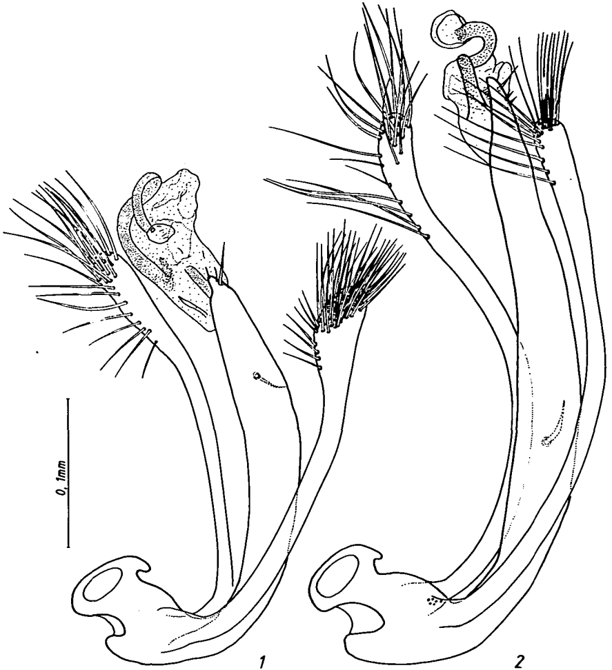
Abb.1-2: Lateralansicht des Aedoeagus von (1) Hydraena helena und (2) Hydraena nigrita .

H. vedrasi findet sich auch zahlreich auf der Insel Andros (leg. JANSSENS).