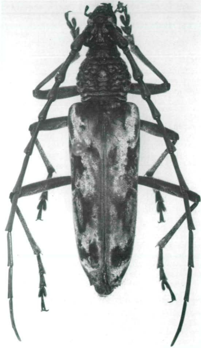
Abb.1: Aeolesthes curticornis sp.n., Holotypus ♂.