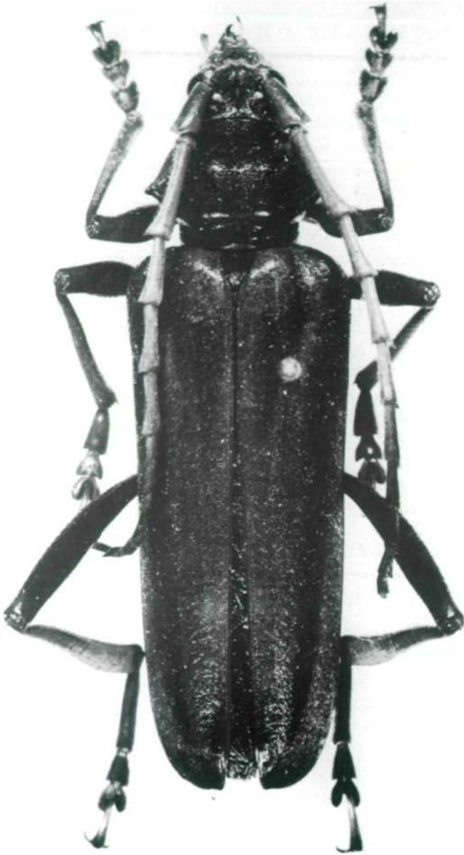
Abb.3: Schmidtiana palawanica sp.n., Holotypus ♂.