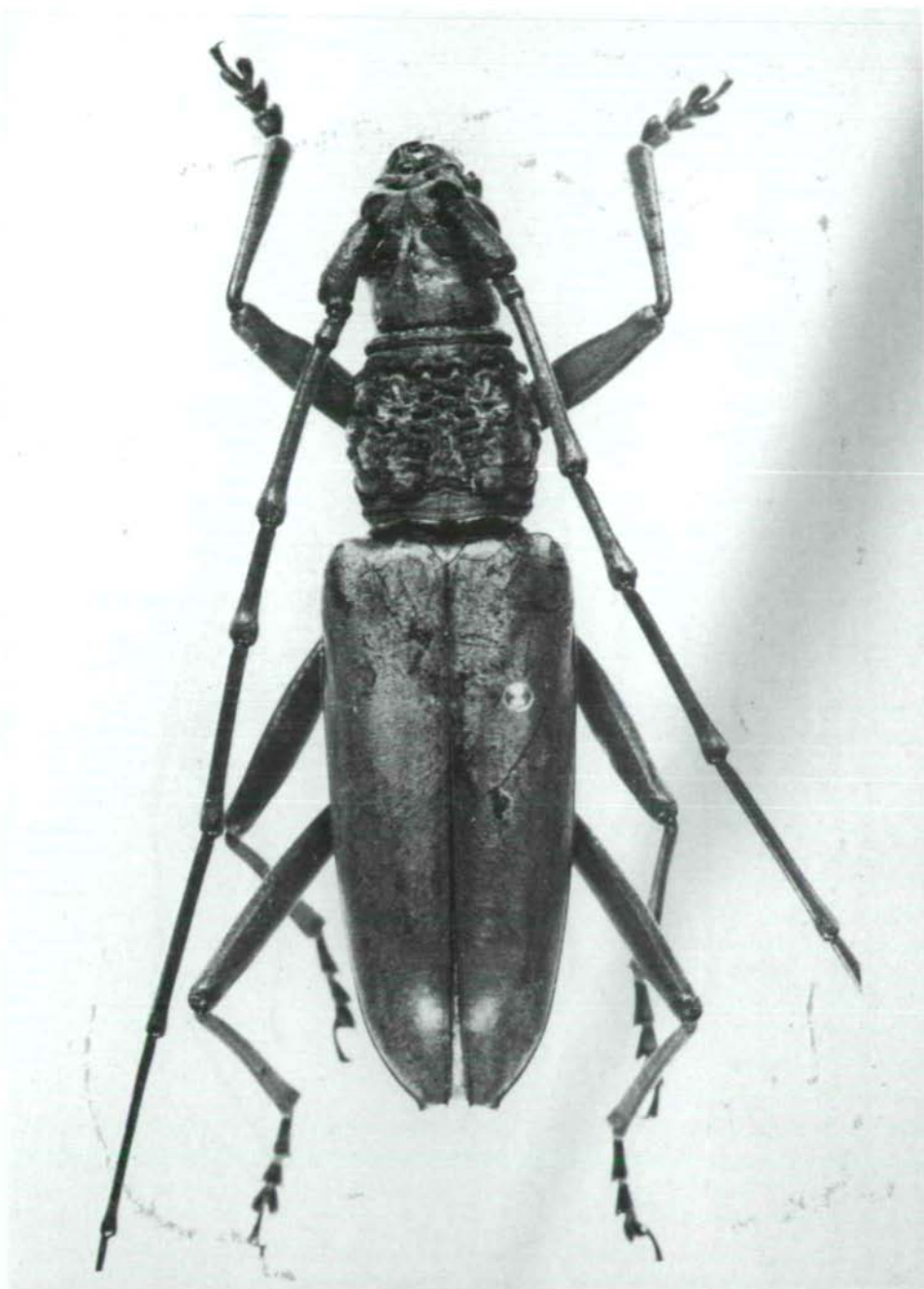
Abb.6: Massicus intricatus (PASCOE,1866), Typus ♂ (Brit. Mus. Nat.Hist., London).