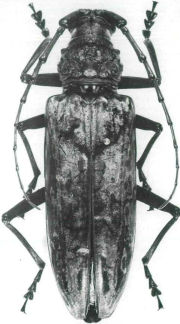
Abb.3: Neocerambyx luzonicus pseudoparis ssp.nov., Paratypus ♀.