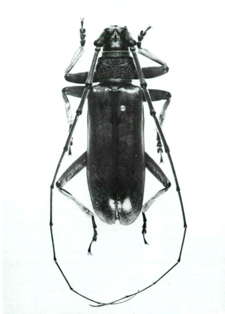
Abb.4: Neocerambyx pellitus (BREUNING & HITZINGER, 1943), ♂.