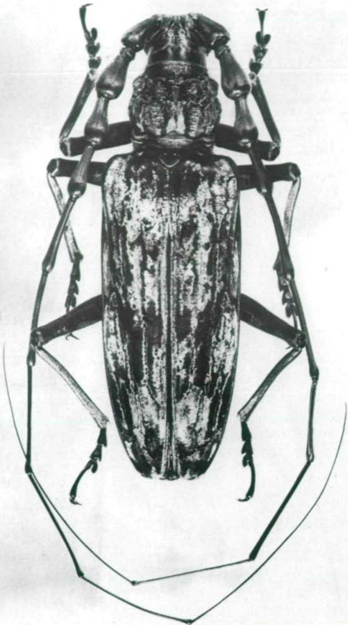
Abb.5: Neocerambyx gigas THOMSON, 1878, ♂.