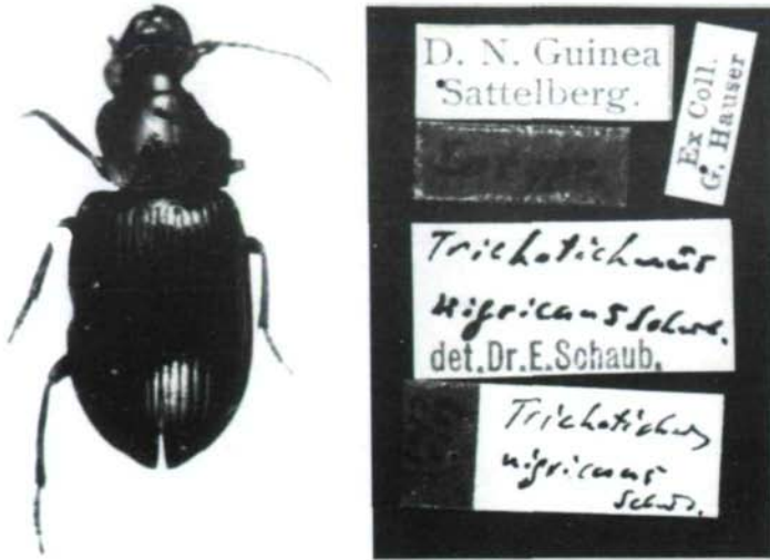
Fig. 1: Habitus of Trichotichnus (Pseudotrichotichnus) nigricans SCHAUBERGER, 1935, ♀ (Cotype) and labels.