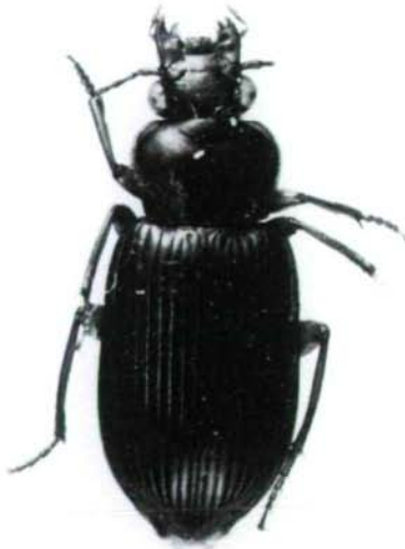
Fig. 2: Habitus of Trichotichnus (Pseudotrichotichnus) brunneiventralis N. ITO, sp. nov., ♂ (Holotype).