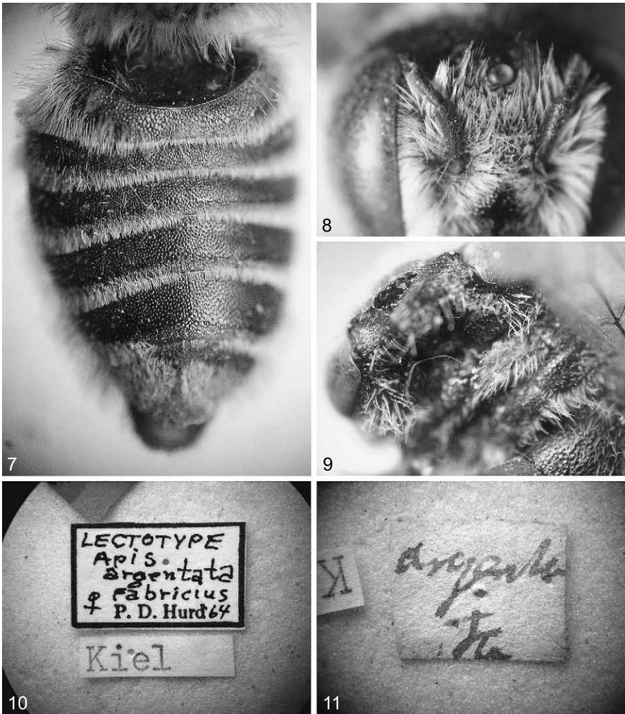
Abb. 7-11: Megachile argentata (FABRICIUS), (♀, Lectotypus): (7): Abdomen, dorsal; (8) Gesicht; (9) linkes Vorderbein; (10) Lectotypus-Etikett; (11) Bestimmungsetikett.