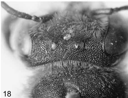
Abb. 12-18: Megachile dorsalis PÉREZ, (♀, Lectotypus): (12) Behaarung von Kopf und Thorax, lateral; (13) Clypeus; (14) Etikettierung; (15) Clypeus und Mandibeln; (16) Mesonotum; (17) Abdomen; (18) Scheitel.