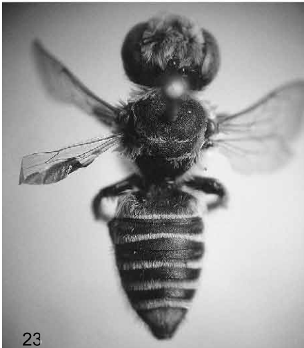
Abb. 19-23: Megachile fertoni PÉREZ, (♀, Lectotypus); (19) Scheitel; (20) untere Gesichtshälfte; (21) Clypeus; (22) Etikettierung; (23) Habitus.