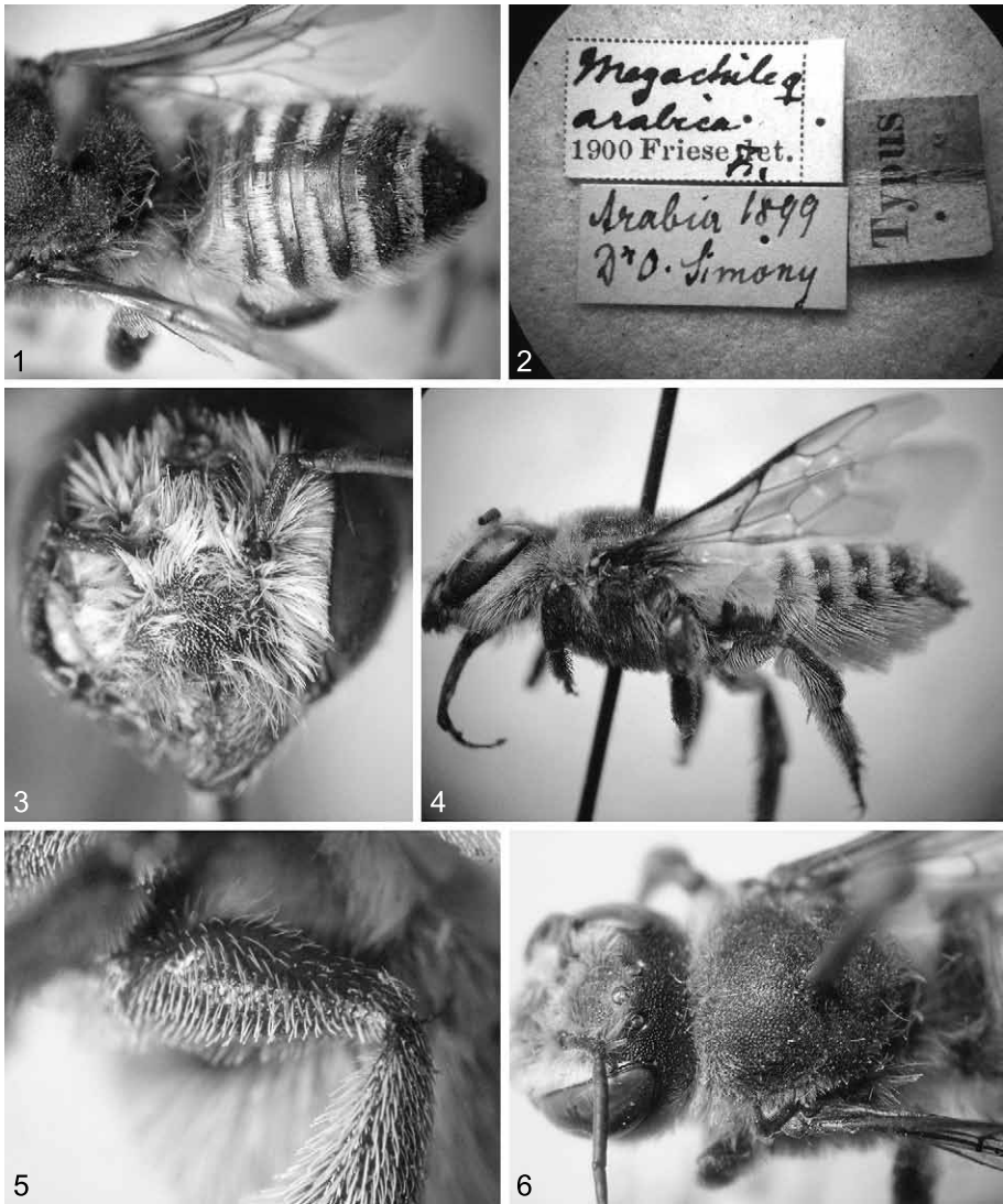
Abb. 1-6: Megachile arabica FRIESE, (♀, Lectotypus): (1): Abdomen; (2) Etikettierung; (3) Gesicht; (4) Habitus, lateral; (5) Behaarung der Hinterschenkel; (6) Mesonotum.