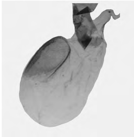
Abb. 7. Conistra ligula ♀, GU Nr. 195412, Ductus bursae und Bursa copulatrix.

Am 16. 4. 2013 erschien ein ♂ am gleichen Ort am Licht. (Abb. 3 oben).