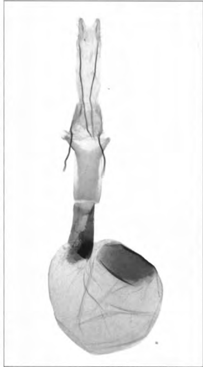
Fig. 265. Conistra ligula

Abb. 8. ♀ Genital von Conistra vaccinii und Conistra ligula . Aus: RONKAY et al., 2001.