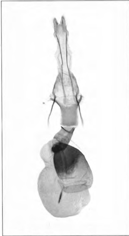
Fig. 264. Conistra vaccinii

Die beiden abgebildeten Exemplare dürften zur f. polita HÜBNER gehören.