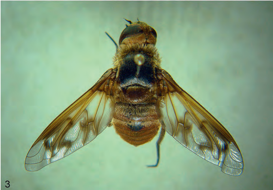
Abb. 2-3: (2) ♂ Heteralonia megerlei , 14 mm Körperlänge, 17 mm Flügellänge (3) ♀ Ligyra ferrea , 16 mm Körperlänge, 16 mm Flügellänge.