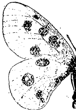
Fig. 3. ♂ phrynus (Oetztal).

Mit diesem Namen bezeichne ich die durch die Beschreibungen von Prof. Kitt und Postrat Belling sattsam bekannte, von ersterem auch abgebildete Form der Oetztaler Alpen. Die Form wurde mit P. apollo geminus in Verbindung gebracht, ein zoogeographisches Uning, weil sich zwischen geminus , der nur in den Berner Alpen vorkommt, die Graubündner Rasse rhaeticus Fruhst. einschleibt. Im Osten aber wird phrynus abgelöst von glocnerius Verity, der sowohl die Zillertaler Alpen wie die gesamte Hohe Tauernkette bewohnt. Interessant sind die Anklänge des phrynus an die Kärntner Rassen, die sich durch weit verstreute Schwarzbestäubung aller Flügel und die dicht zusammengedrängten, markanten Schwarzflecken verraten. Sehr häufig sind spitzovale vordere und nierenförmige hintere Ozellen. Glassaum bei beiden Geschlechtern in der Regel schmal.