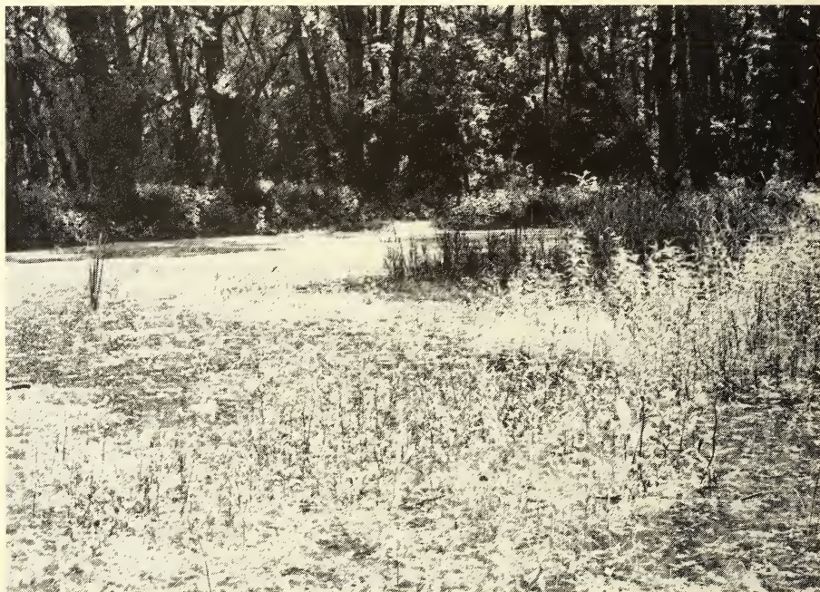
Abb. 2: Typisches Brutbiotop von Rhantus consputus ; durch Druckwasser geflutete Senke am Rheindamm bei Brühl, 31.05.1982.

funden, an Stellen, die u. a. mit Rorippa amphibia bewachsen waren. Für das Untersuchungsgebiet liegen nun zahlreiche Daten vor, und es stellte sich heraus, daß R. consputus überwiegend in temporären Gewässern vorkommt (vgl. Abb. 1). Da nachgewiesen wurde, daß die Art auch hier ihren Fortpflanzungszyklus durchläuft (vgl. das folgende Kapitel), kann kein Zweifel bestehen, daß sie zu den Bewohnern dieses Gewässertyps zu rechnen ist. Es handelt sich vorzugsweise um jene Bereiche der Rheinauen, die bei Hochwasser überflutet werden (oft lediglich durch das ansteigende Grundwasser, d. h. ohne Kontakt zu anderen Gewässern), dann für eine gewisse Zeit Wasser führen, um schließlich wieder trockenzufallen, falls keine neue Hochwasserwelle kommt. Meist sind die Schluten oder Senken flach, stark verkrautet oder liegen inmitten ausgedehnter Schilffelder (Abb. 2).