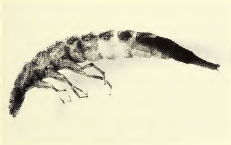
Abb. 5: Rhantus consputus , (Originalgröße 17 mm ohne Cerci).