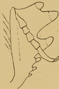
Fig. 2. Rechte Vorderschiene von Aspidolister laticeps