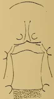
Fig. 5. Sternum von Catacraerus pullus Gerst.

Die neue Gattung steht in der Mitte zwischen Pachycraerus und Chalcurgus . Sie ist von ersterer durch den nicht auf das Epistom übergreifenden Randstreif der nicht konkaven Stirn, durch die an der Spitze (nicht an der Basis) abgekürzten inneren Dorsalstreifen der an der Spitze grob punktierten Flügeldecken, durch das schmalere Prosternum, dessen Streifen in der Mitte stark einander genähert sind, durch den meist gebogenen, stark gekerbten Querstreif am Hinterrand des Mesosternums und durch die gedrungene walzenförmige Gestalt, von Chalcurgus durch die nicht ausgehöhlte Stirn, die stärker gestreiften Flügeldecken, die gebogene, gekerbte Querlinie am Hinterrand des Mesosternums und die weniger zahlreich gezähnten Vorderschienen verschieden. Von beiden Genera ist die neue Gattung ferner getrennt durch die beiden weit voneinander getrennten Seitenstreifen des Metasternums, von denen die inneren parallel sind. Die Dorsalstreifen der Flügeldecken sind an der Basis mehr oder weniger nach innen umgebogen.