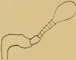
Fig. 4. Fühler von Catacraerus pullus Gerst.

der Spitze mehr oder weniger abgekürzt (also basal) oder fehlen ganz, der Nahtstreif liegt ziemlich weit ab von der Naht, ein Spitzenstreif fehlt. Das Propygidium ist quer sechseckig, das Pygidium halbeiförmig, konvex. Das Prosternum ist schmal, die Streifen sind deutlich, sie divergieren nach hinten und meist auch nach vorn, die Basis ist eckig ausgerandet. Das Mesosternum ist vorn zweibuchtig, die