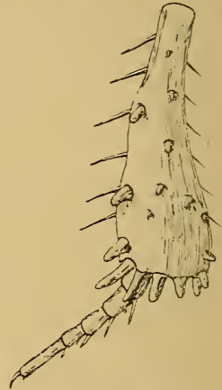
Fig. 3. Rechte Hinterschiene (von außen) von Aspidolister laticeps Bickh.

geschlagen, gerundet spitzbogig im Umriss und stark gewölbt. Das Prosternum ist zwischen den Hüften schmal, gratförmig erhoben mit zwei Streifen, die Kehlplatte ist mäßig groß. Das Mesosternum ist fast dreieckig, die Spitze des Dreiecks ist schwach abgerundet und springt gegen das Prosternum vor, ohne daß letzteres eine merkbare Ausrandung an seiner Basis zur Aufnahme der Mesosternum-Spitze hätte; seitlich ist das Mesosternum gerundet. Die Beine sind kräftig, mäßig kurz, die Vorderschienen haben eine gerade Tarsalfurche und mehrere große distale, sowie einzelne kleine proximale Zähne (Fig. 2). die Hinterschienen sind ziemlich dick, auf der konvexen Außenseite und am Außenrand mit dicken kräftigen Dornen verschiedener Länge, am Außenrand ferner mit einzelnen langen dünnen Borsten besetzt, der Innenrand der Schienen ist schwach bewimpert. Die Hintertarsen haben fünf Glieder, das Endglied trägt nur eine Klaue (die andere Klaue ist kaum wahrnehmbar angedeutet (Fig. 3).