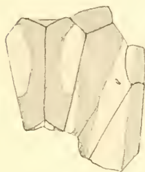
Fig. 9. Disparocypha Biedermanni n. sp. ♂ Thorax.

sternum und Metepimeron weißlich. Beine lang und mäßig dünn. Dornen sehr lang; schwarz, Trochanteren weißlich, Femora basalventral diffus braun. Abdomen schlank, zylindrisch; rotorange mit schwarzer Ringelzeichnung; Segment 1 seitlich weißlichgelb in Fort-