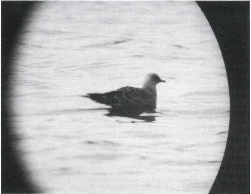
Abb. 2 ‚Digiskopierte‘ Falkenraubmöwe ( Stercorarius longicaudus) am Ulmener Jungferweiher, 8. September 1991.