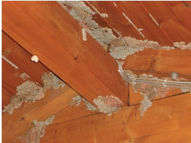
Abb. 11 a,b Orientalische Mörtelgrabwespe Massenansammlung von Lehmtöpfchen Forsthütte „Zoggler“ 2006