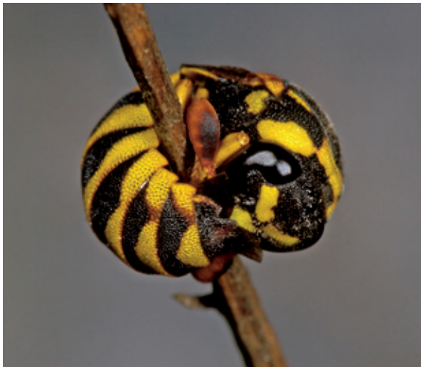
Abb. 9 Honigwespe Celonites abbreviatus ♂ schlafend an einem Halm Prad, 12.06.05

Das Nest besteht aus feinen röhrenförmigen Brutzellen aus Lehm, die an Steine oder Pflanzenstängel angeheftet werden (Abb. ). Die Larven in den Röhrenzellen werden mit einer Art Honig versorgt (im Gegensatz zur tierischen Nahrung der übrigen mitteleuropäischen Wespen), den die Honigwespen hauptsächlich von Gamander ( Teucrium montanum ) gewinnen.