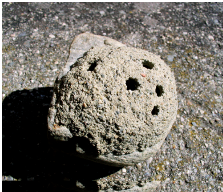
Abb. 1: Ch. parietina , flaches Kuppelnest (7 x 7 x 2 cm) Brixen-Albeins: Schottergrube, VII.1995 (leg. Hellrigl)