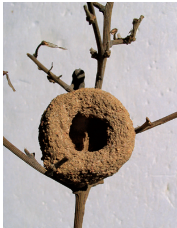
Abb. 3 a+b: Sizilianische Mörtelbiene – Sardinien 1997, Kugelnester: 32x25x33 mm (leg. G.v.Mörl)