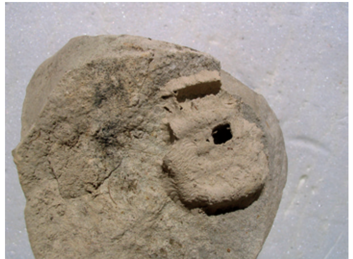
Abb. 10 Honigwespe Celonites abbreviatus Röhren-Mörtelneest an Stein Schwäbische Alp 1995 (leg. Bellmann)