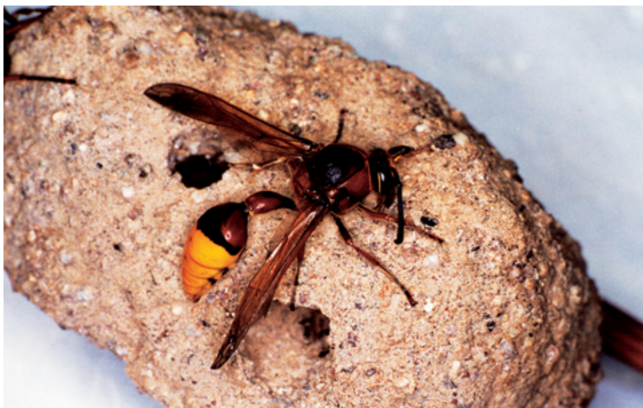
Abb. 6: Große Lehmwespe – Delta unguiculatus , Meran-Trauttmansdorf: Aufzucht Brixen, 25.06.2005