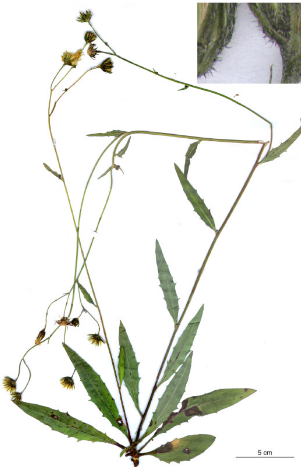
Abb. 1 Herbarexemplar von Hieracium subrigidum von Rügen.