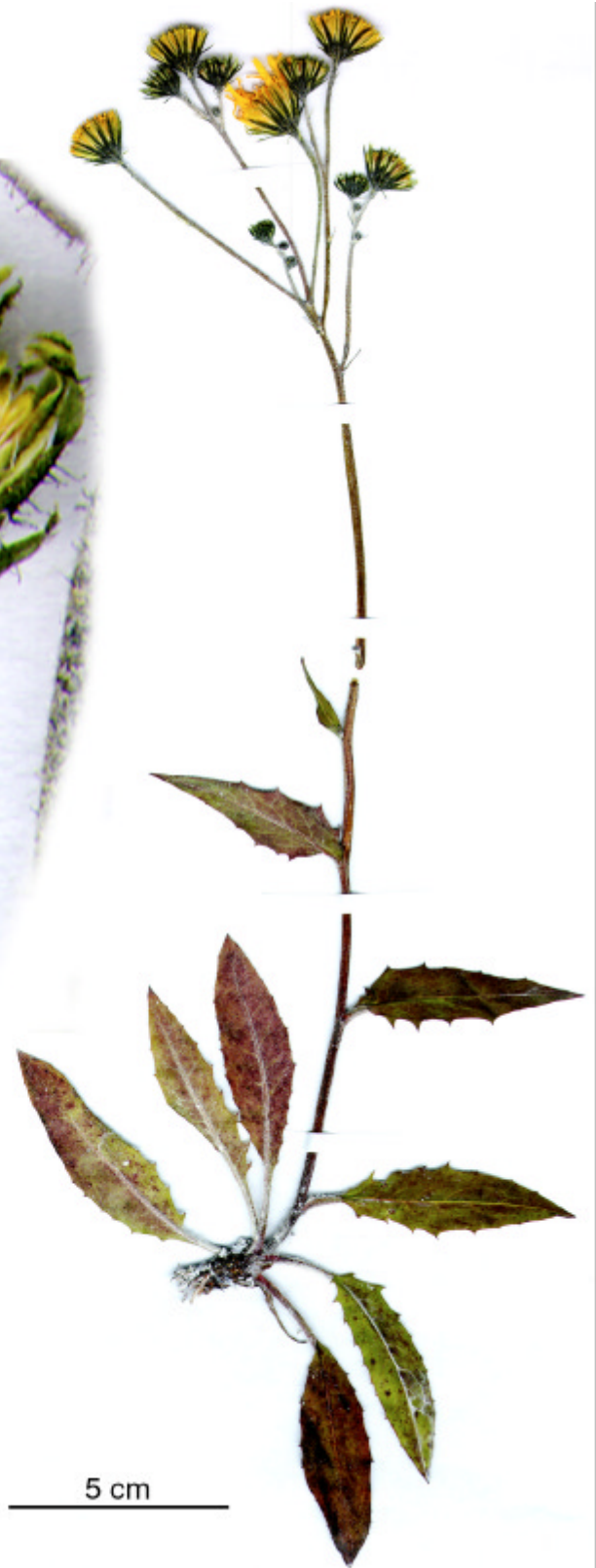
Fig. 5 Holotype of H. lachenalii subsp. litoretaceum growing on the chalk cliffs of Jasmund.