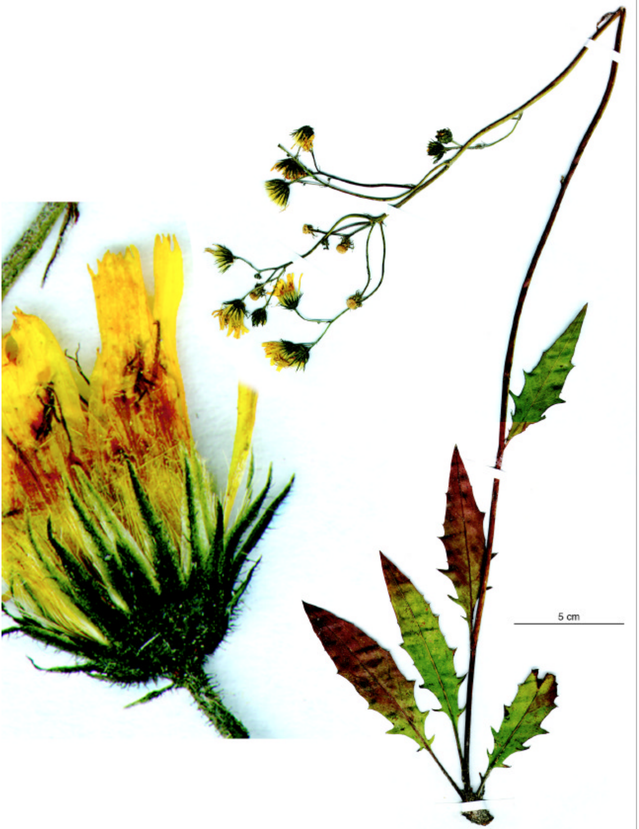
Abb. 2 Holotypus von Hieracium swantevitii , Kap Arkona.