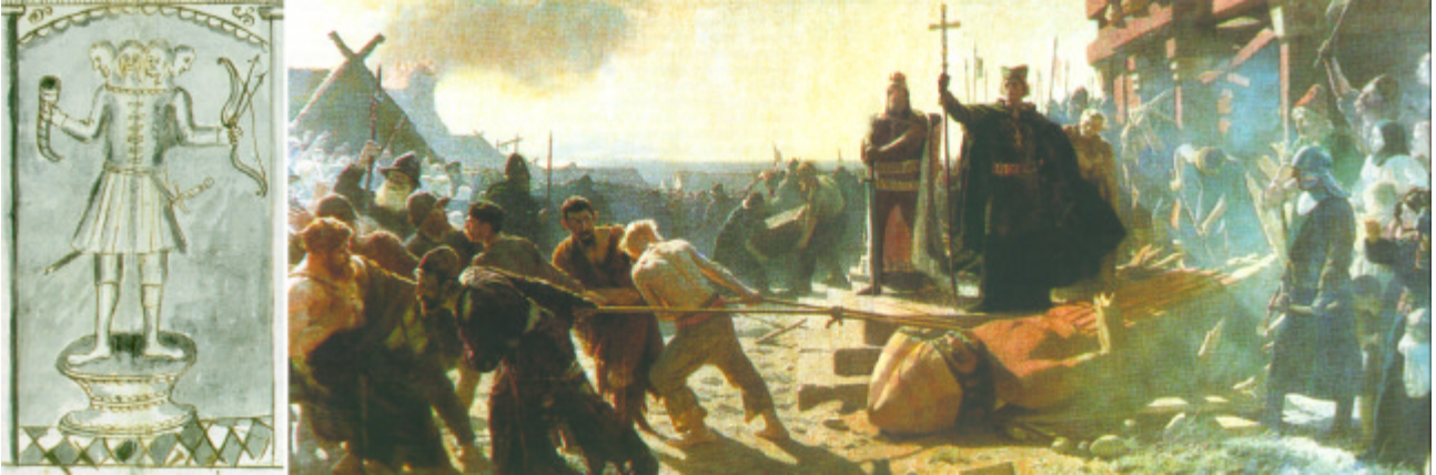
Abb. 3 Swantewit, die viergesichtige Gottheit der slawischen Ranen, der Urbevölkerung von Rügen. Im Jahr 1168 eroberten die Dänen unter Waldemar dem Großen und Bischof Absalon von Roskilde die Tempelburg der slawischen Ranen auf Kap Arkona und vernichteten die Statue von Swantewit. Links, aus einer Handschrift von 1670, rechts Gemälde von Laurits Tuxen (1853-1927).

Fig. 3 Swantewit the four-faced godnes of the Ranens, the indigenous slavic tribe of Rügen, was adored and celebrated in a temple located on Cape Arkona. The temple was destroyed in 1168 by the king of Denmark, Waldemar the Great, and his bishop Absalon of Roskilde. Left, a drawing from a manuscript of 1670, right, painting of Laurits Tuxen (1853-1927).