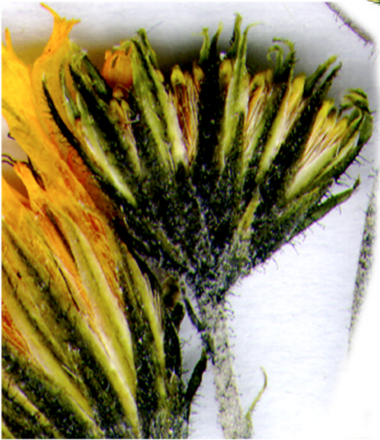
Abb. 5 Holotypus von H. lachenalii subsp. litoretaceum der Kreideküste von Jasmund.