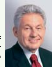
Dr. Josef Pühringer Landeshauptmann