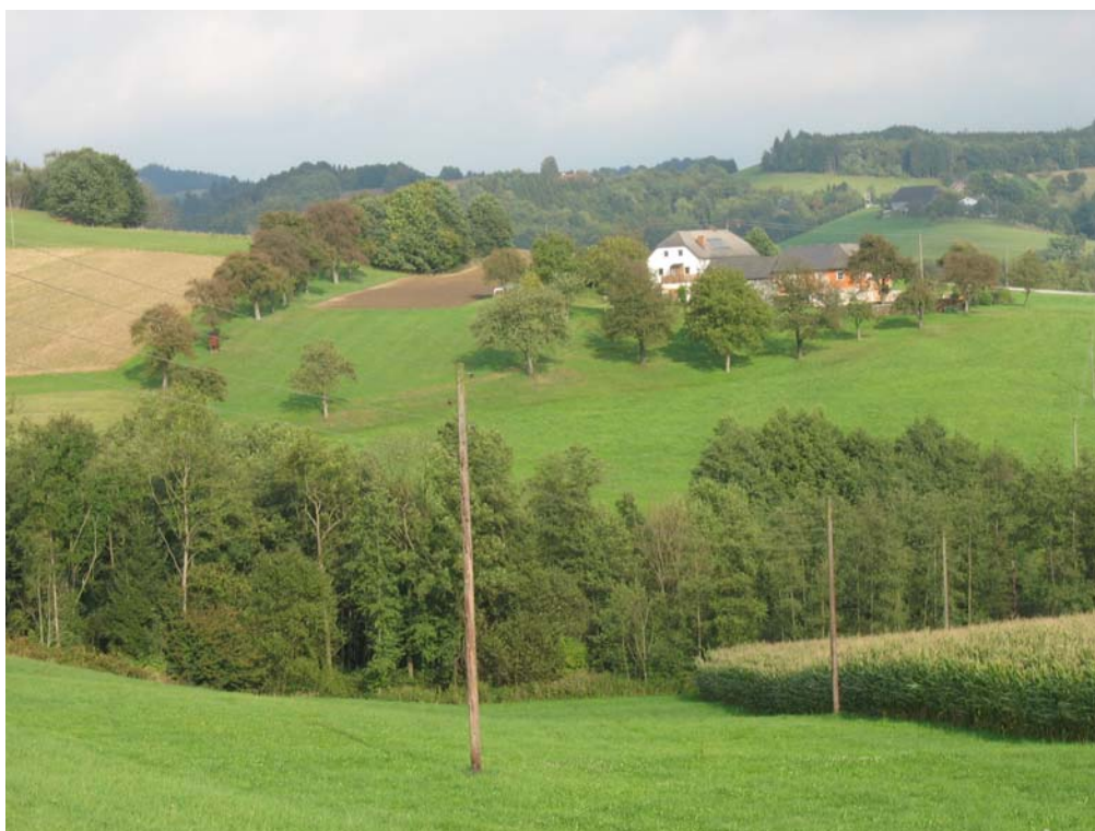
Abb. 13: Landschaft bei Roisenberg