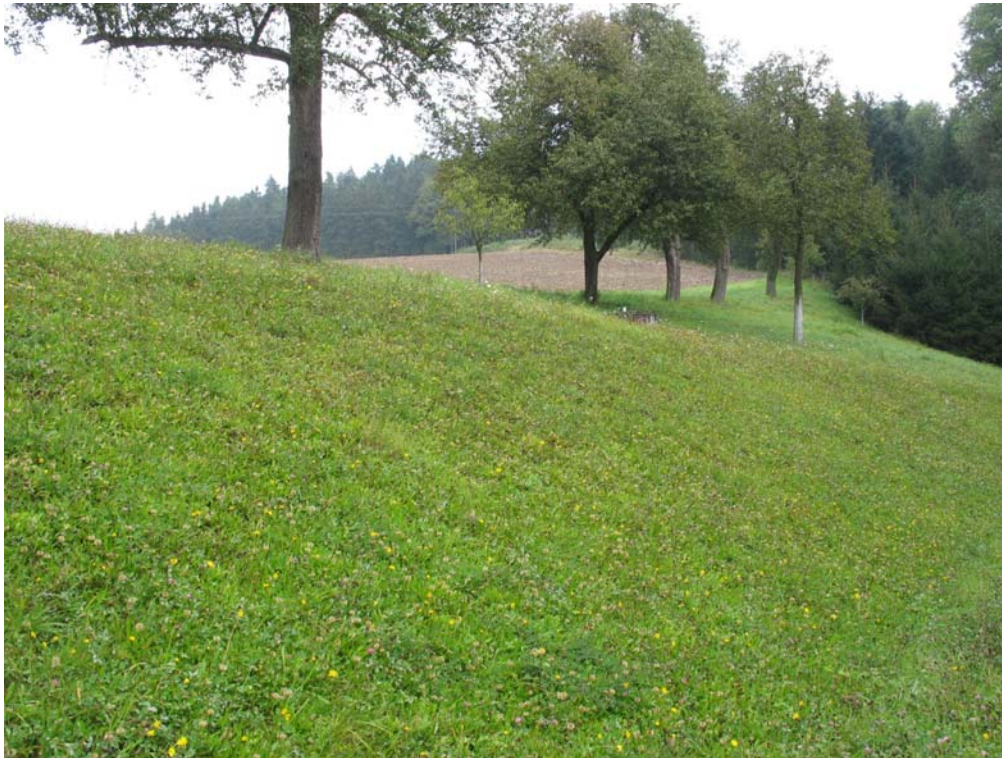
Abb. 7: Obstbaumreihe in Hummelberg