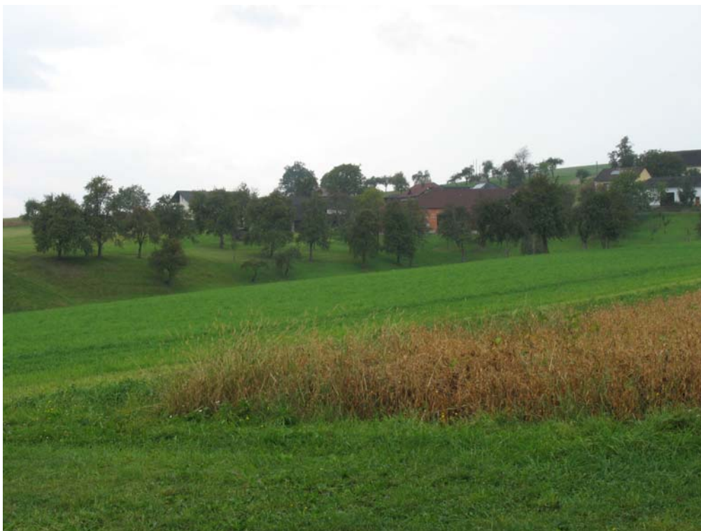
Abb. 6: Streuobstwiesen bei Großing