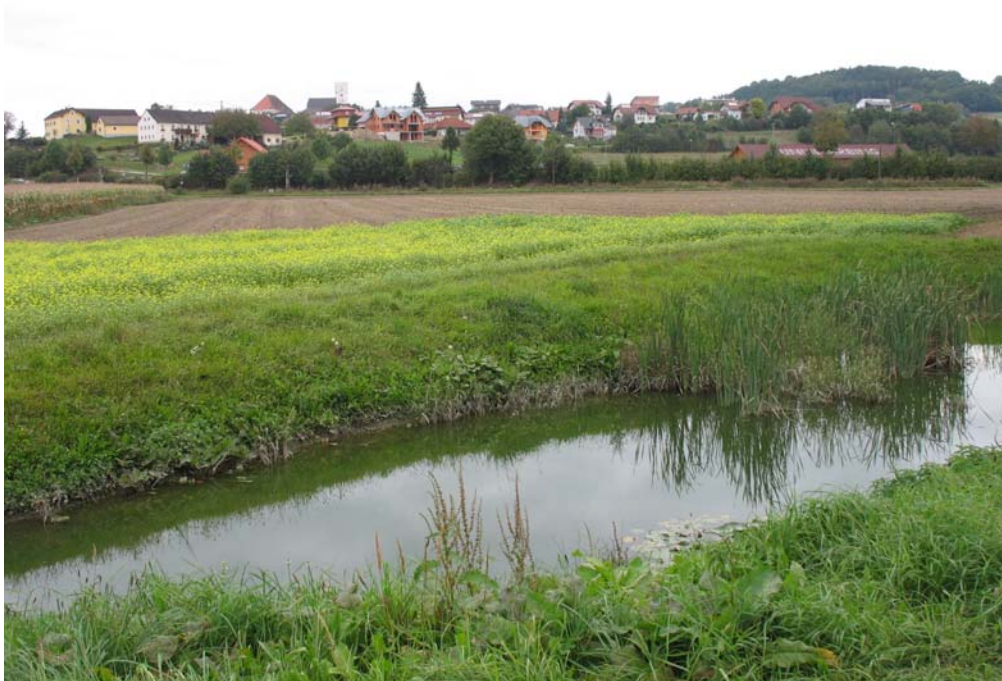
Abb. 3: Blick von Süden auf Arbing