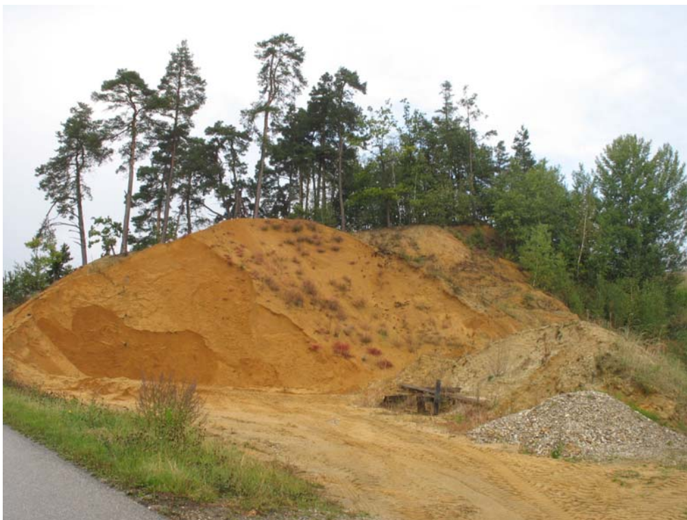
Abb. 8 Sandgewinnung in Hummelberg