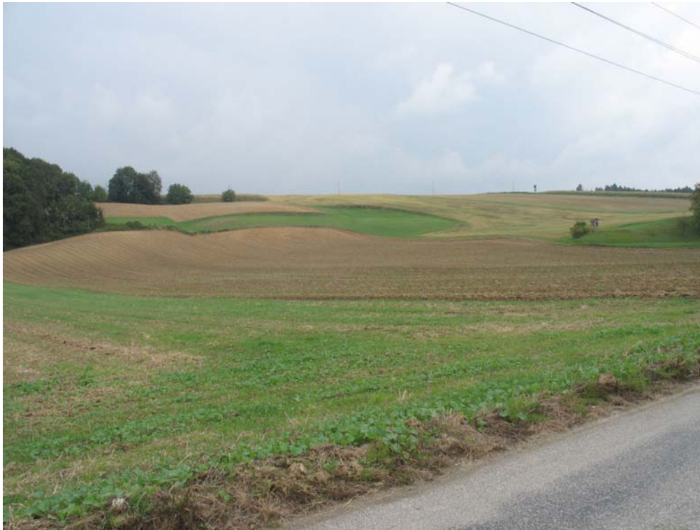
Abb. 5: Übergangsbereich zwischen Machland und Mühlviertel westlich von Arbing