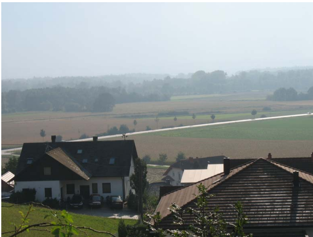
Abb. 12: Blick von Frühstorf auf das Machland