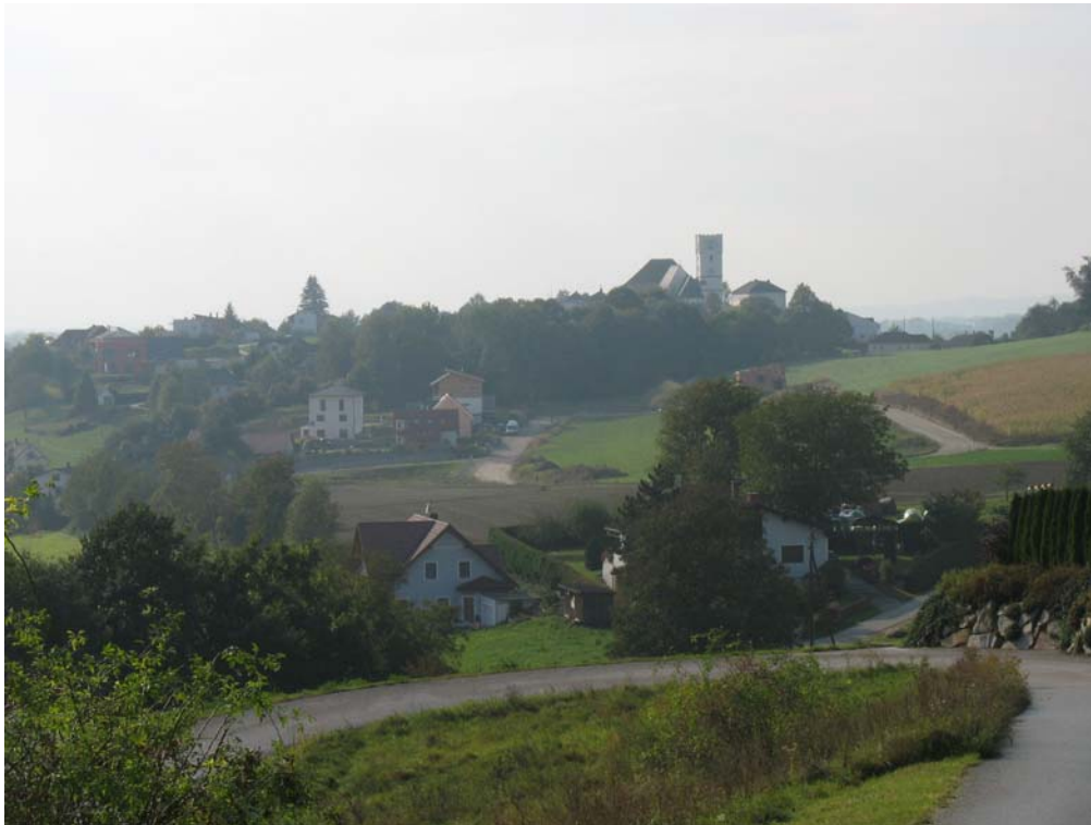
Abb. 11: Blick von Frühstorf auf Arbing