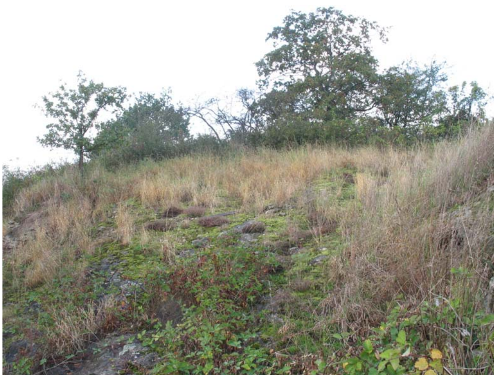
Abb. 10: Felsiger Trockenstandort bei Arbing