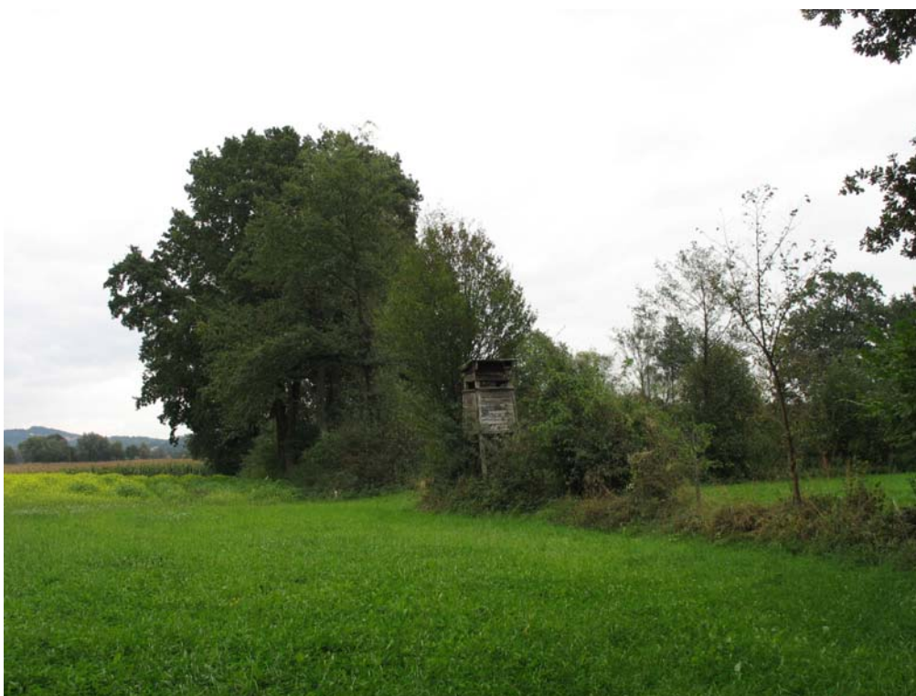
Abb. 2: Baumreihen im Teilgebiet 2