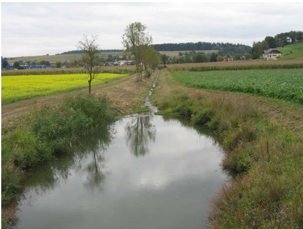
Abb. 4: Begradigter Bach in Teilgebiet 2