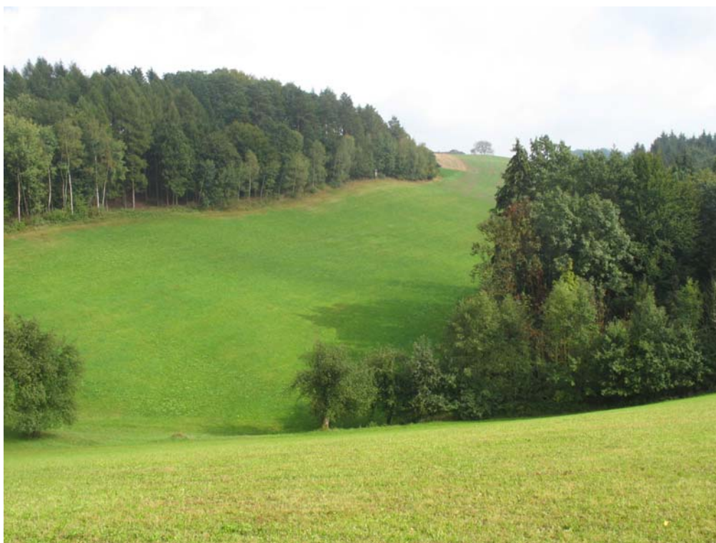
Abb. 9: Kuppenlandschaft im Norden von Teilgebiet 1