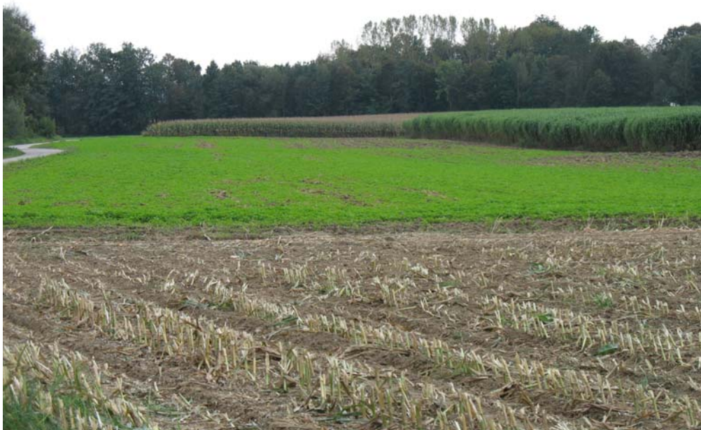
Abb. 1: Intensiver Ackerbau im Machland-Anteil von Arbing