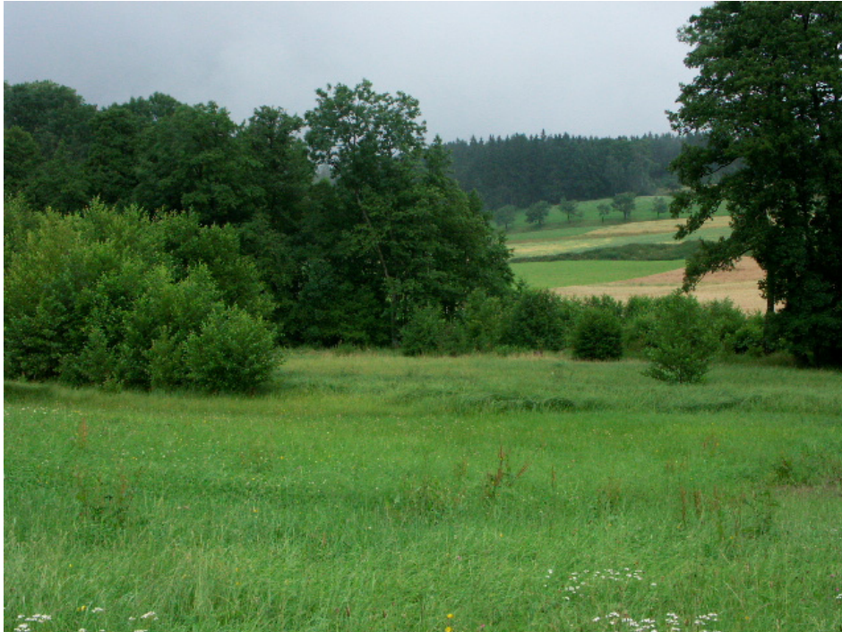
Abb. 9: Verbuschende Feuchtwiese bei Klindt, hervorn melioriert