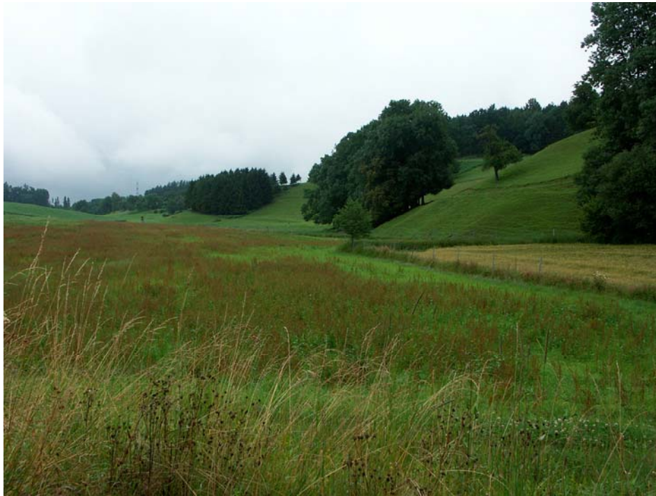
Abb. 1: Mit schönen Altholzbeständen durchsetzte, markante Böschung bei Unterseling (Wildgehege) und „überdüngte“ Ampferbrache ohne besonderen Naturschutzwert