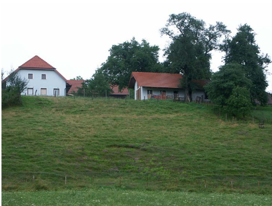
Abb. 3: Detail aus Abb. 2: beweideter Magerrasen mit Feldthymianbewuchs