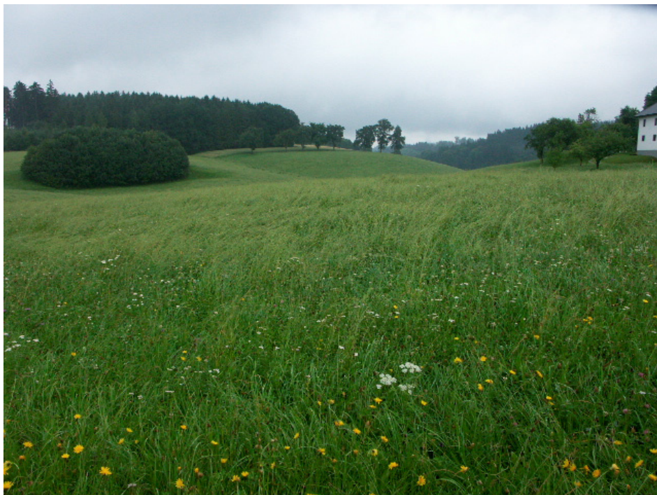
Abb. 8 Größerflächiges Intensivgrünland in Weingarten, Blumen nur an Straßenböschung