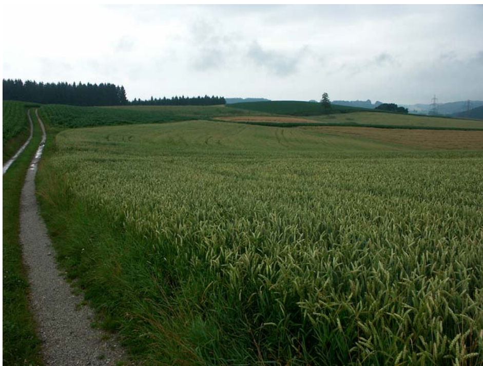
Abb. 4: Kleine Offenlandschaft bei Bachmannsberg