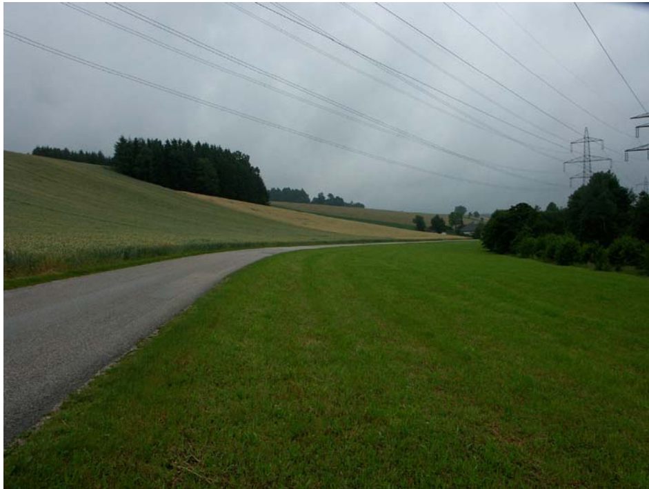
Abb. 7: Zivilisatorisch überprägte Landschaft bei Krollendorf