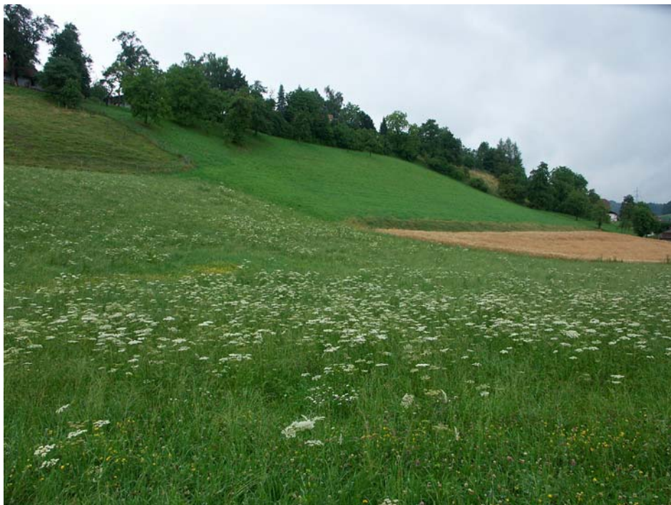
Abb. 2: Bachmannsberg ist von dichten Obstbaumbeständen und extensiv bewirtschafteten Hangwiesen geprägt