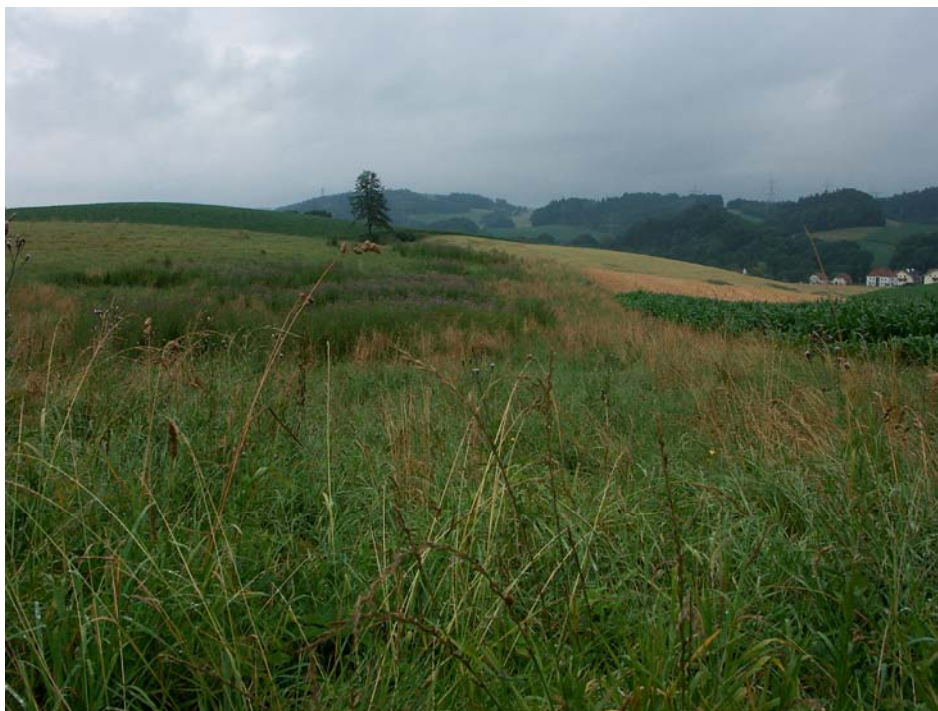
Abb. 5: Zoologisch attraktive Brache in freier Ackerflur bei Bachmannsberg