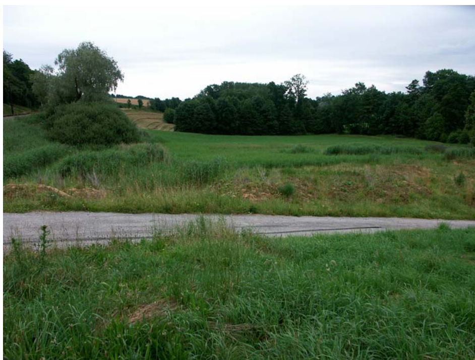
Abb. 12: Relativ „naturnahes“ Bachtal bei Oberseling; bewachsene Aufschüttungsflächen wirken bereichernd, sofern nicht wertvolle Biotope zugeschüttet werden