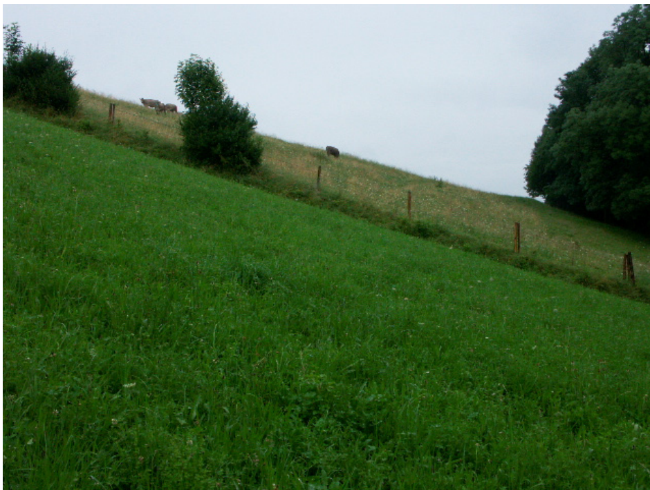
Abb. 10: Sonnhangwiesen mit extensiven Mäh- und Weidenutzungen bei Hundhagen