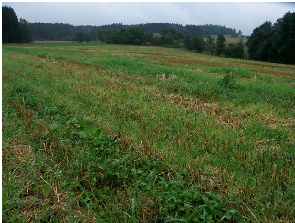
Abb. 11: Reich belebter Stoppelacker bei Krollendorf