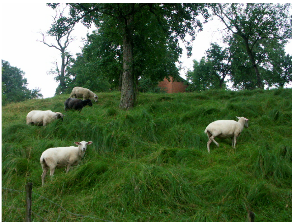
Abb. 6: Extensive Beweidung in Bachmannsberg