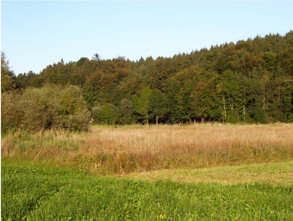
Foto 6: Brachfläche im Dürren Ager Tal, dahinter der raumprägende Terrassenwald