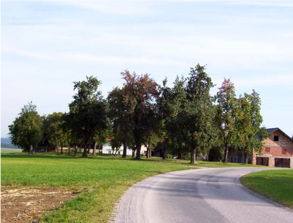
Foto 7: Obstbaumwiesen wie diese bei Baum sind typische raumprägende Elemente