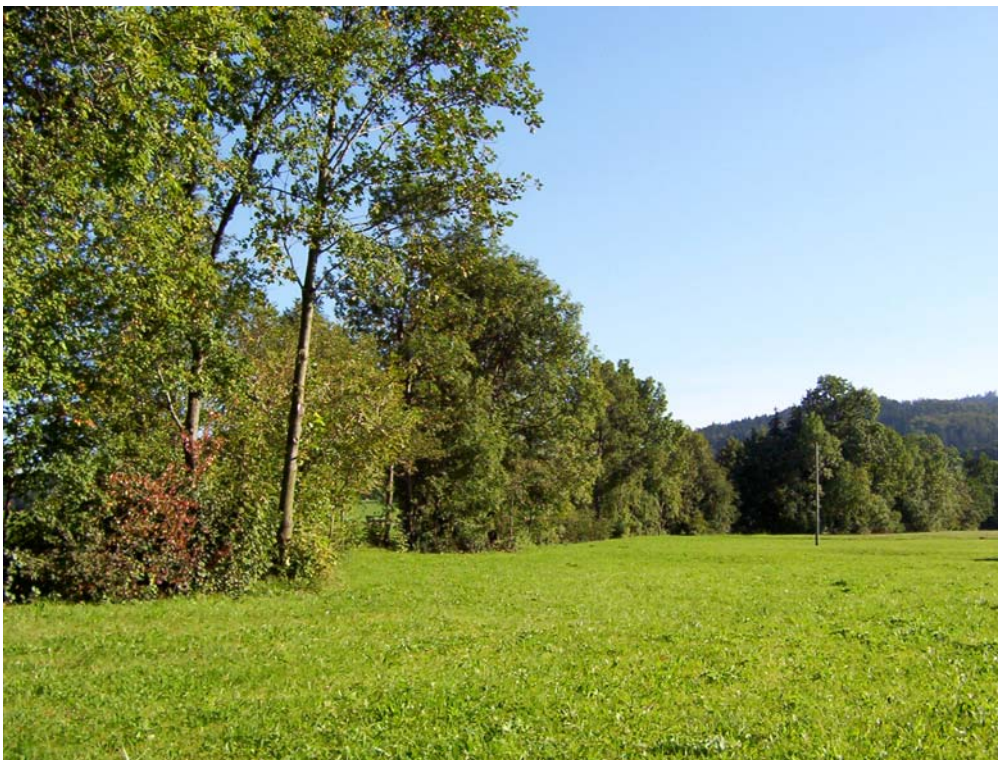
Foto 2: Uferbegleitgehölz am Köppach westlich Pössing im Teilraum „Strukturarmes Hügelland“