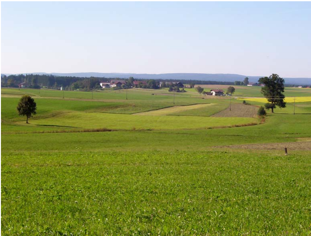
Foto 1: Naturferner Wiesenbach bei Schönhag im Teilraum „Strukturarmes Hügelland“