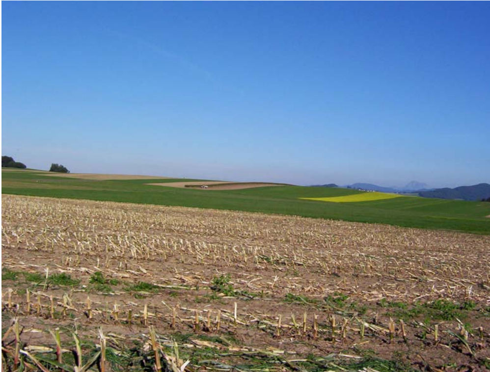
Foto 3: Intensive landwirtschaftliche Nutzung südlich Raith Teilraum „Strukturarmes Hügelland“