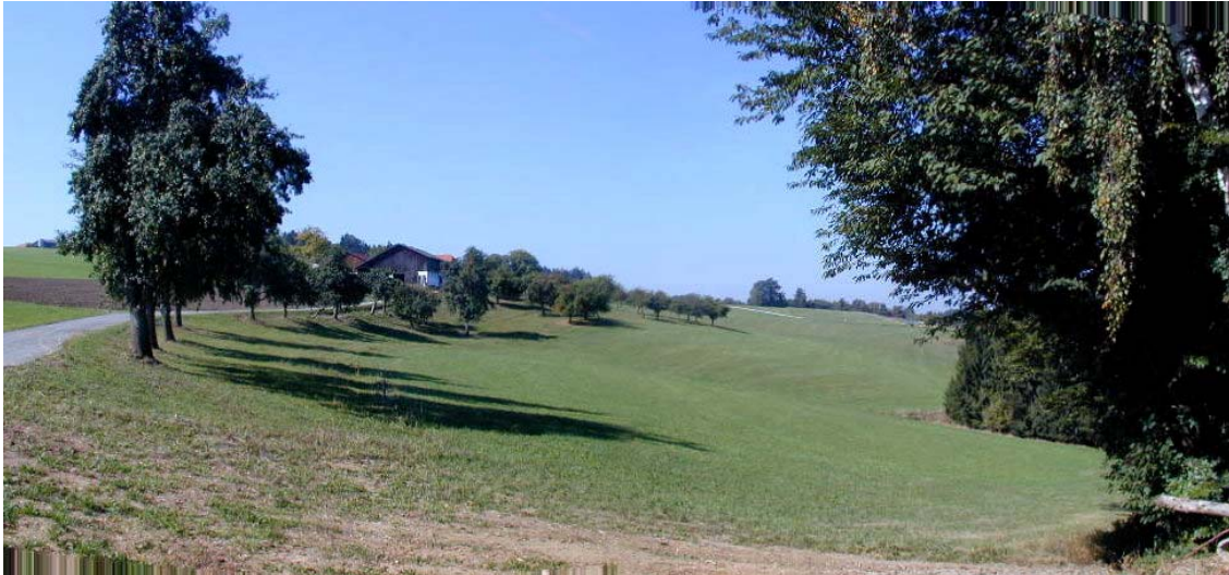
Foto 4: Blick auf Streuobstwiese im Bereich der Ortschaft Rauhegg