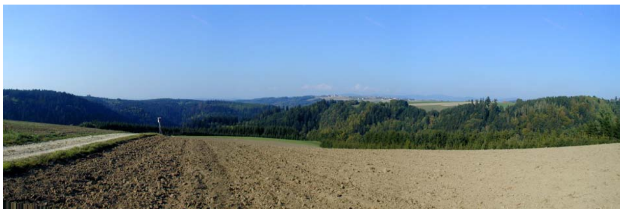
Foto 15: Aufnahme in der Nähe von Gersdorf, Blick Richtung Nordosten