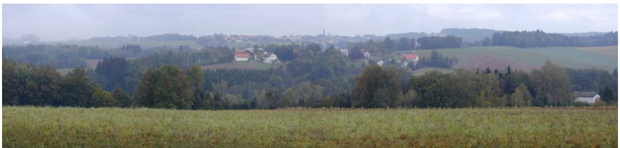
Foto 18: Blick Richtung Freinberg im Bereich der Ortschaft Saming