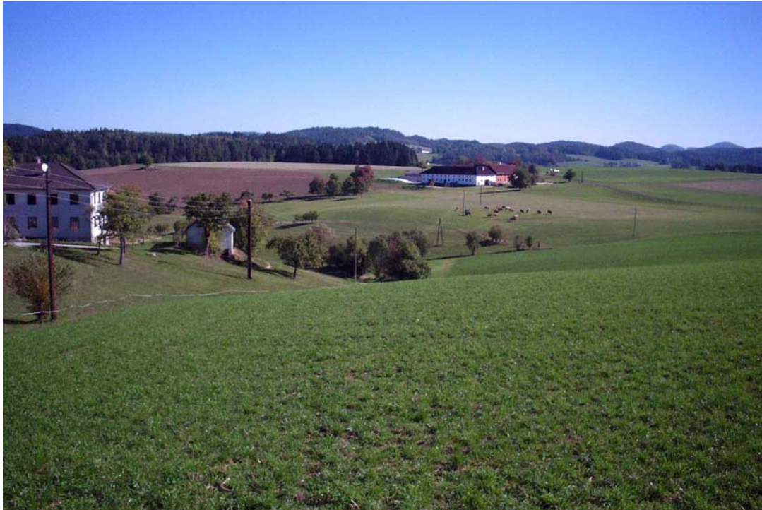
Foto 3: Überblick im Bereich östlich der Hartleiten; leicht reliefiertes Kuppenland im Agrar- und Siedlungsbereich (F-34)