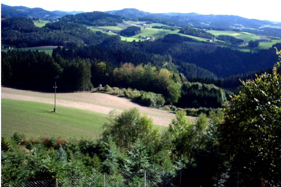
Foto 4: Überblick nördlich von Hundsdorf Richtung Nordosten; stark reliefierte Kuppenlandschaft (F-11)