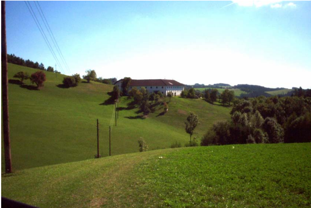
Foto 9: Einzeln stehender Bauernhof mit Obstwiese bei Geisruckdorf (F-18)