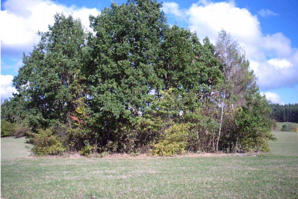
Foto 5: Bestockte Einzelfelsformation im intensiven Grünland nördlich von Gutau