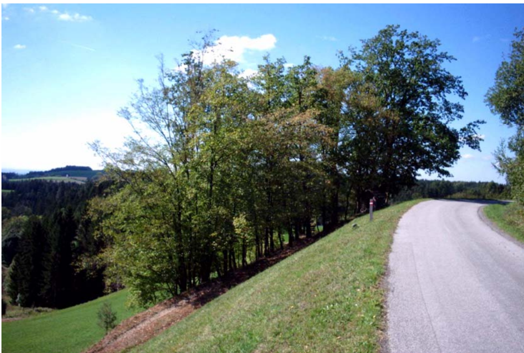
Foto 2: Kleinstwaldfläche an einer steilen Straßenböschung; (F-17)