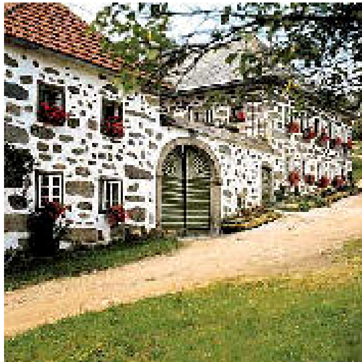
Foto 10: Typischer alter Mühlviertler Bauernhof mit „gefleckten Mauern“ (F-67)