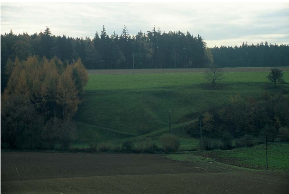
Foto 10: Nordwestexponierter Hang zum Dambach, ähnlich Bild 25. Man erkennt, dass die Fläche im linken Teil schon vor Jahren durch Aufforstung verkleinert wurde. Nr. 5082