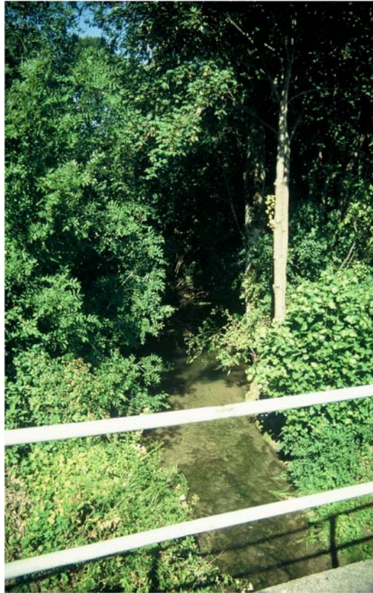
Foto 17: Fotos 17 und 18 sind von der selben Brücke aus nach verschiedenen Richtungen gemacht: Naturnaher (Linien – Nr. 2135) und regulierter Abschnitt des Reiflbachs