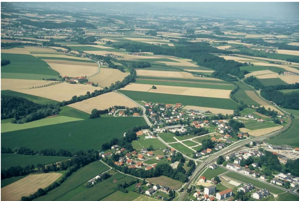
Foto 2: Blickrichtung nach NNW. Die Kremstalniederung mit der stark begradigten Kreams (Flächen – Nr. 5169), die in weitem Bogen nach links verläuft. Im Vordergrund ein Teil der Nachbargemeinde Rohr. Rechts im Bild erkennbar das Ufergehölz des Sulzbachs. Ganz im Hintergrund: der Ortskern