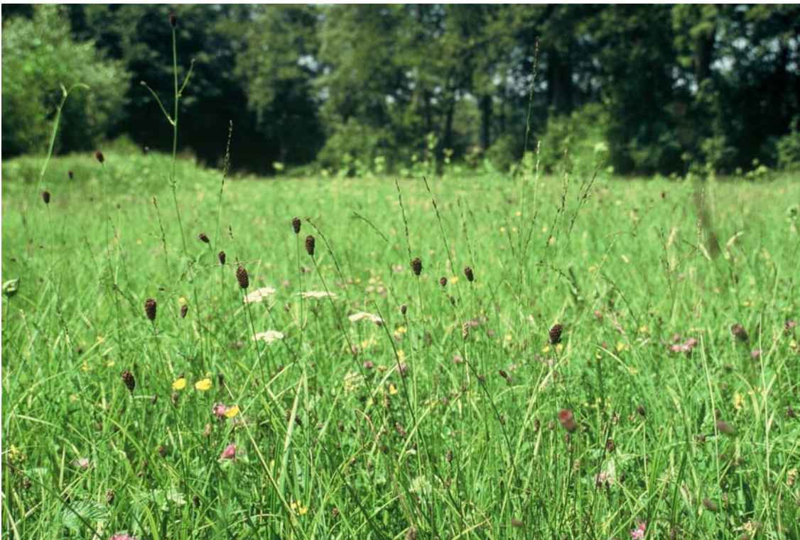
Foto 8: Diese Feuchtwiese liegt in einem Mäander des Dambachs. Nr. 5114