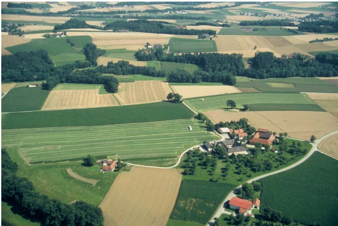
Foto 6: Weiler Engenfeld mit großen Streuobstbeständen (Nr. 1012). Dahinter Gehölze des Dambachs