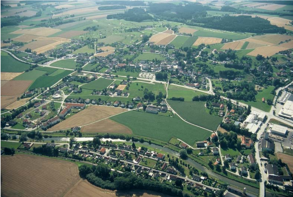
Foto 3: Ortskern gegen WSW. Beträchtliche Baulandreserven in Siedlungslücken. Rechts Mitte Schloss Weyer (Flächen - Nr. 5144). Links im Hintergrund der Golfplatz