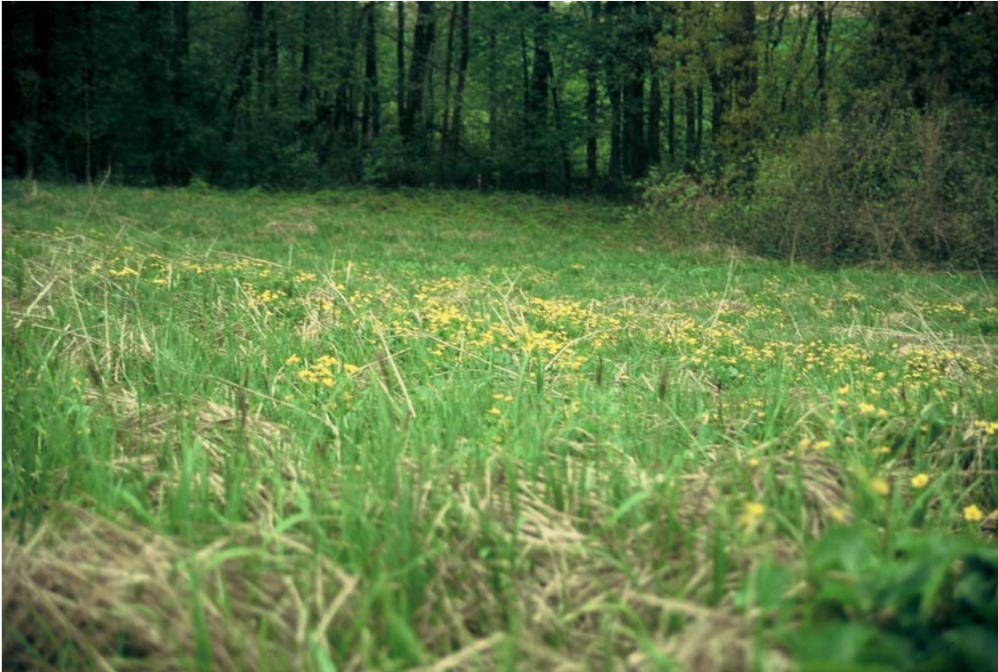
Foto 7: Feuchtbrache Fl. Nr. 1142, Sumpfdotterblume, Carex acutiformis , Überblick; Lage am Ufergehölz des Reiflbachs. Einer der letzten Reste eines früher sicher weit verbreiteten Standortstyps