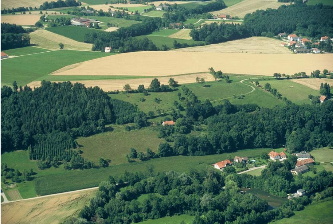
Foto 11: Weiden und Brachen am Hang westlich von Schloss Achleiten. Nummern 5175, 5185 und 5186. Hier könnte für die Erhaltung (relativ!) mageren Grünlands Wertvolles getan werden (Brache 5186!)