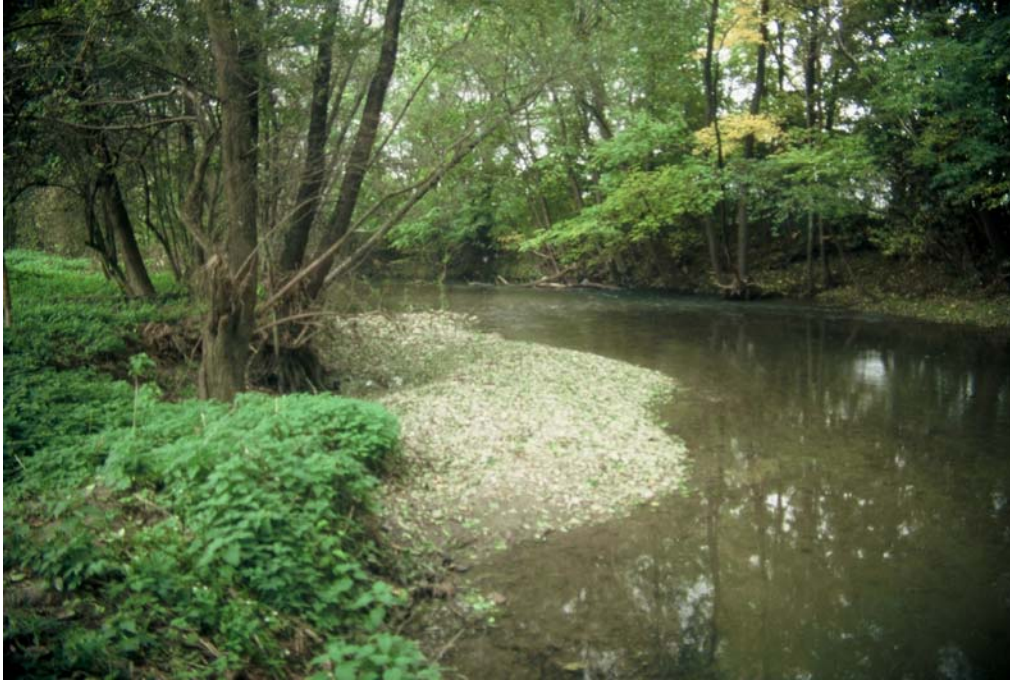
Foto 19: Der einzige naturnahe Abschnitt der Krems im Gemeindegebiet bei Achleiten