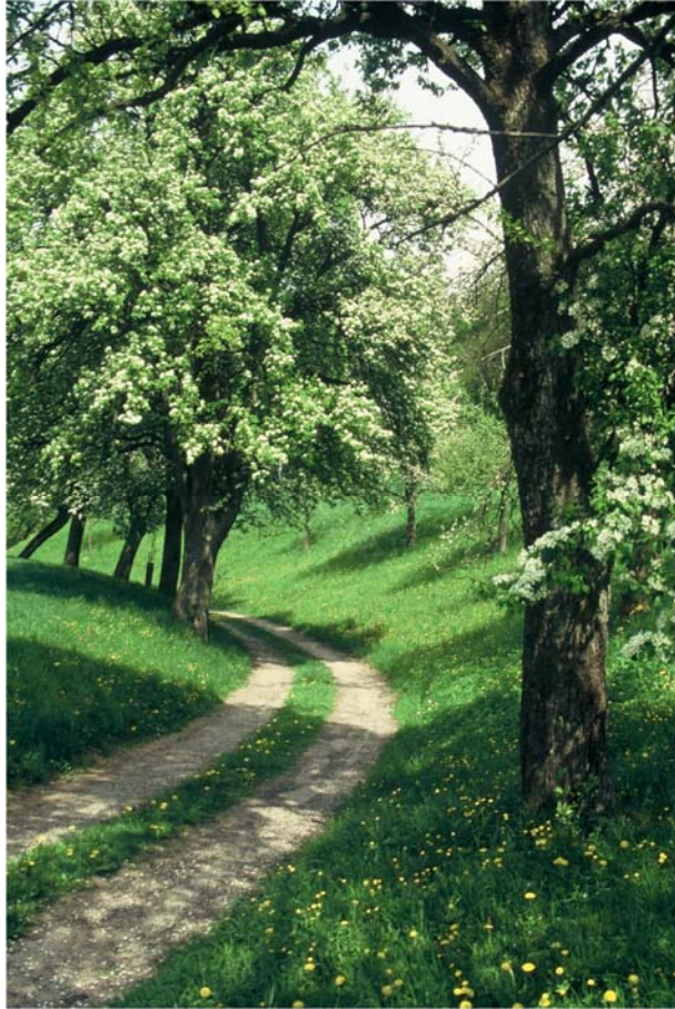
Foto 5: Hohlweg mit blühenden Bäumen in bunter Wiese, vgl. auch Foto Nr. 26, Fläche Nr. 5036