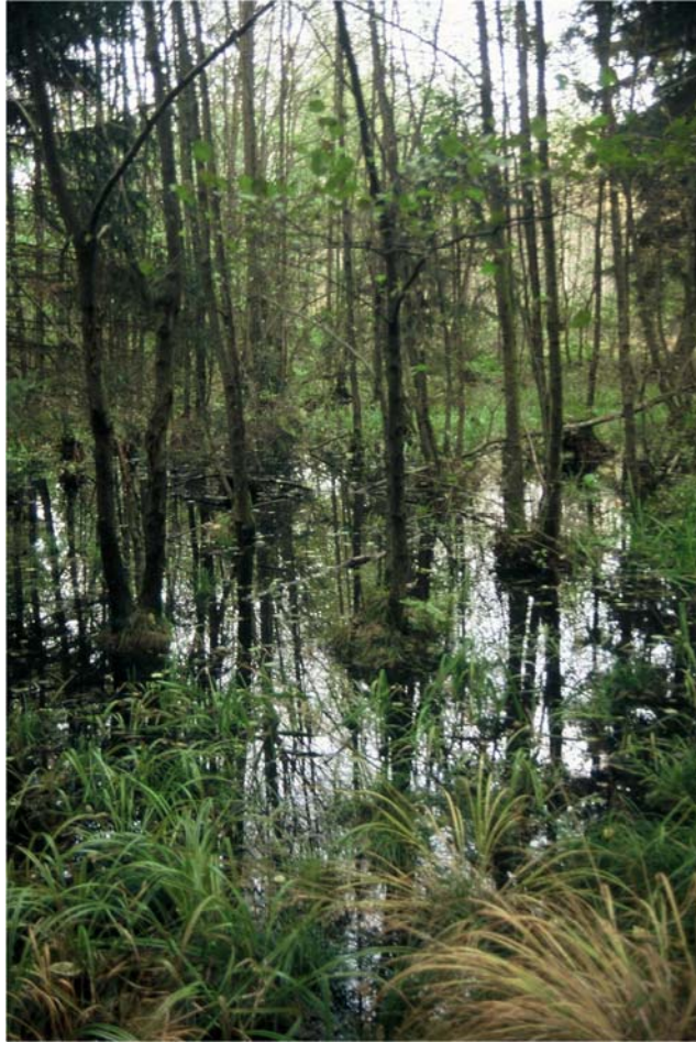
Foto 13: Erlen – Stockausschläge, auf staunassem Boden der Älteren Deckenschotter im Wasser stehend. Nr. 1005