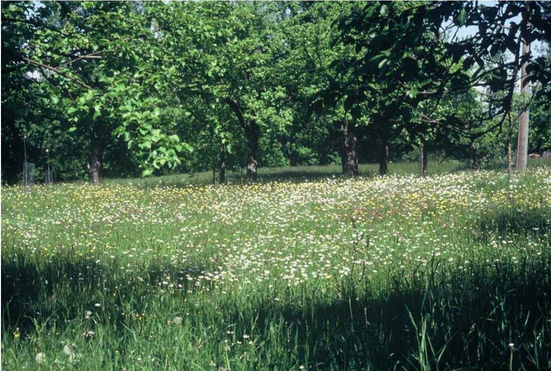
Foto 9: Die Blumenpracht dieser Streuobstwiese (Nr.1199) kann leider nicht als ganz typisch bezeichnet werden