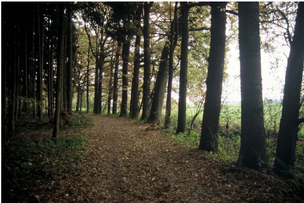
Foto 14: Eine Zeile aus alten Eichen säumt eine Fichten – Monokultur. Linien – Nr. 2014