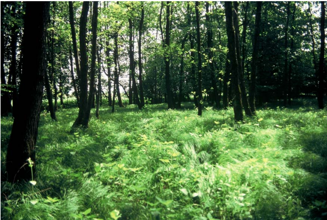
Foto 12: Schwarzerlen – Bachau; im Unterwuchs dominiert hier Carex brizoides . Am Dambach, Nr. 1030