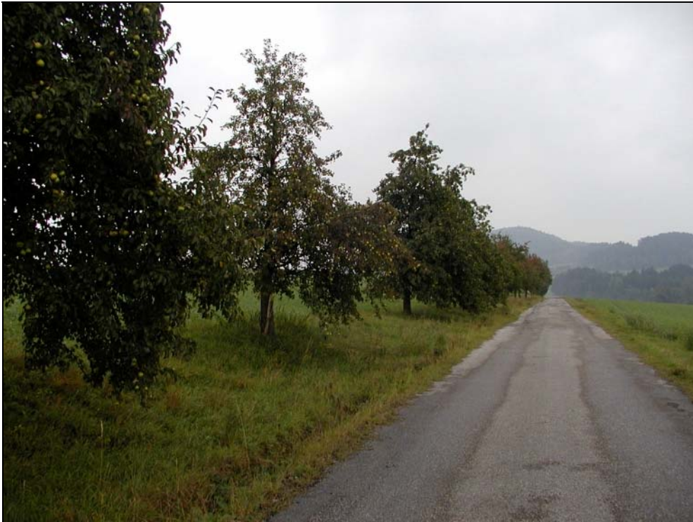
Foto 1: Straßenbegleitende Baumreihe Birne Hochstamm südlich Lasberg