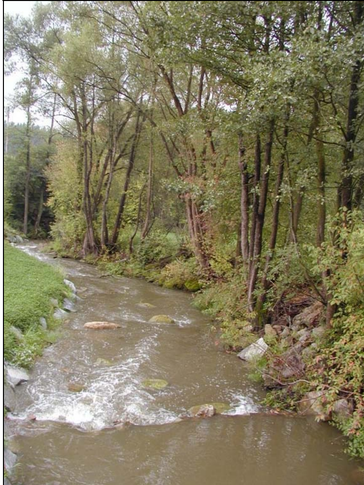
Foto 4: Feistritz südwestlich Lasberg; Flüsschen mit gestrecktem Lauf, teilweise gesicherten Böschungen, sowie halbseitig ausgeprägtem, naturnahen Begleitgehölz [Photo: A. KNOLL, 10. September 2003]