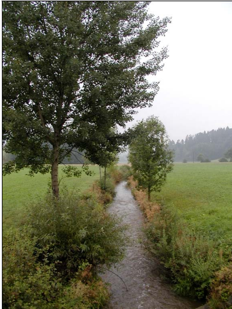
Foto 3: Feistritz südlich Kronau; Wiesenbach mit gestrecktem Lauf, schmal ausgebildetem, lückigem Saum und Begleitgehölz [Photo: A. KNOLL, 10. September 2003]