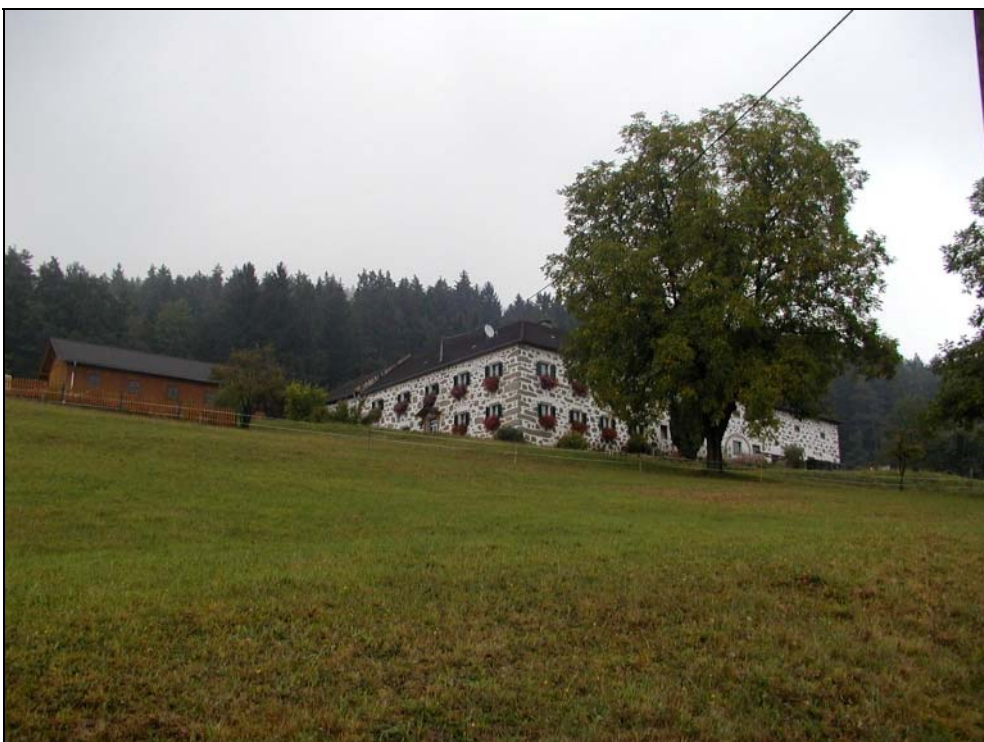
Foto 2: Vierkanthof nördlich Lasberg [Photo: A. KNOLL, 10. September 2003]