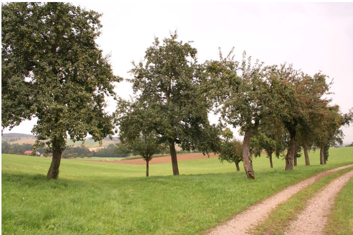
Abb. 2: Streuobstwiese östlich von Bergham