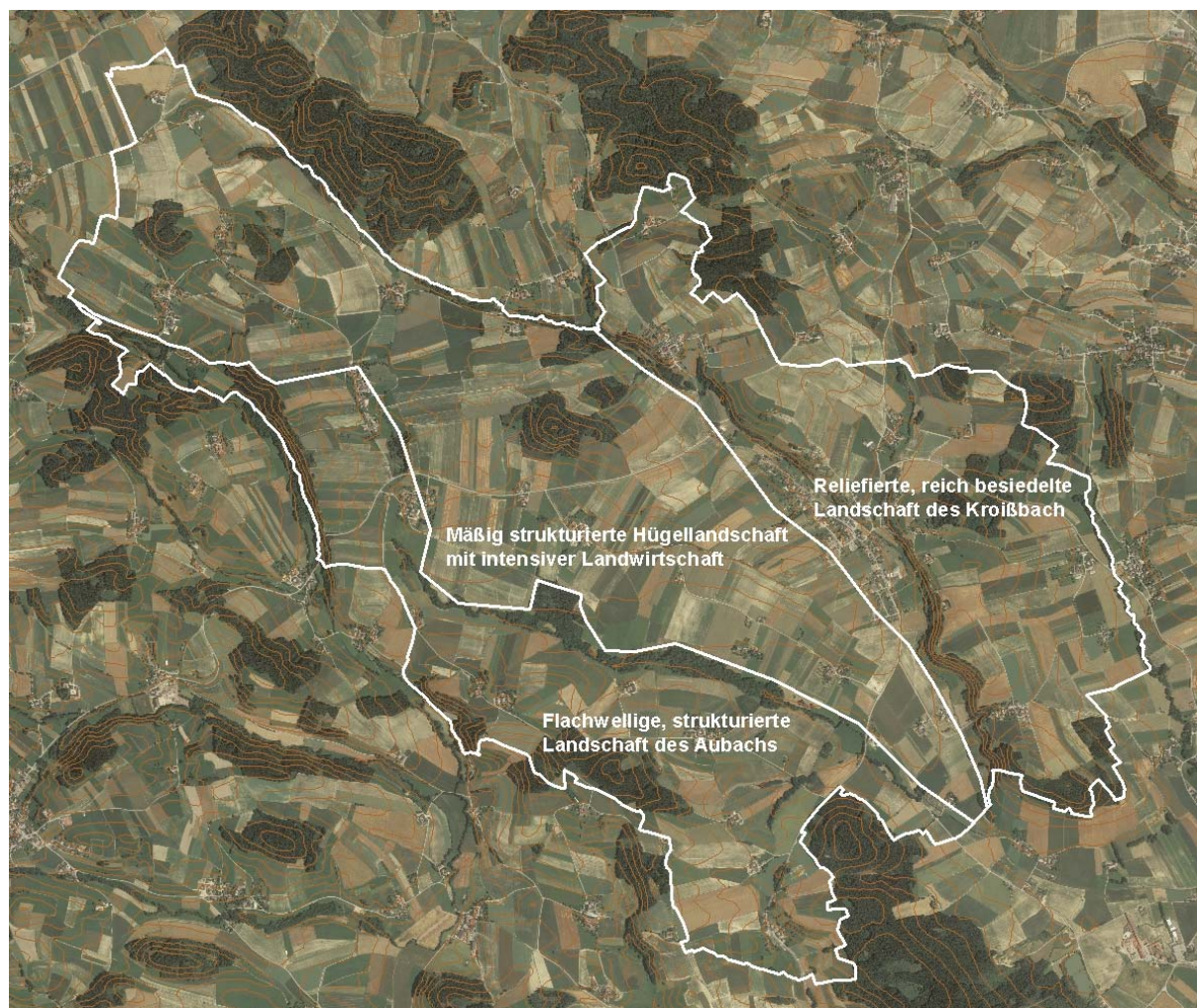
Abb. 2: Übersicht über das Erhebungsgebiet, Abgrenzung der Teilgebiete; Grundlage: Orthofoto

Teilgebiet 1: Reliefierte, reich besiedelte Landschaft des Kroißbach