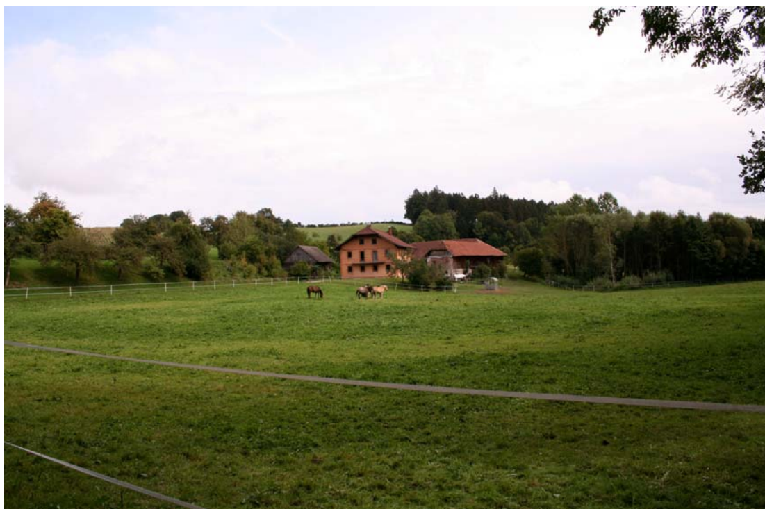
Abb. 4: Pferdehof südlich Albertsham