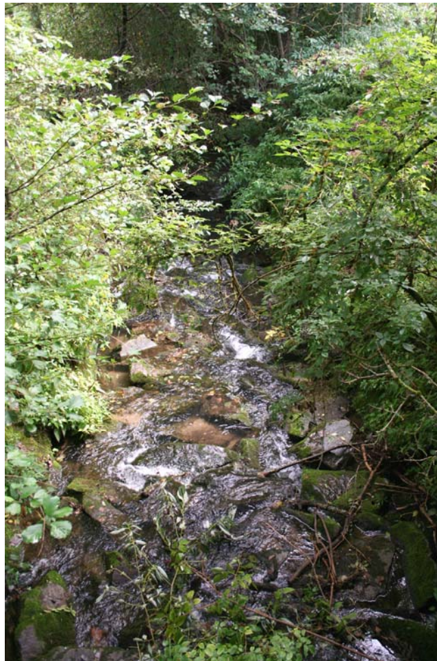
Abb. 3: Gewässer bei Albertsham, flussabwärts