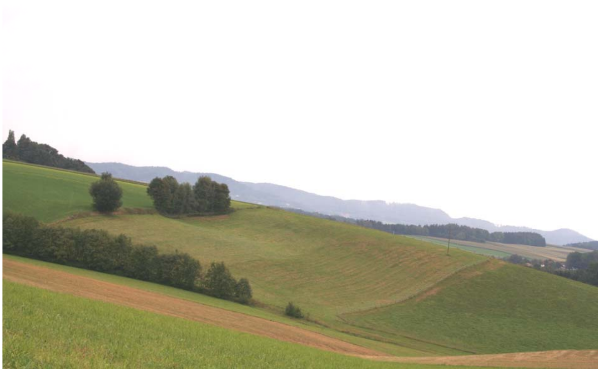
Abb. 1: Böschungsstrukturen mit Hecke und Baumreihe