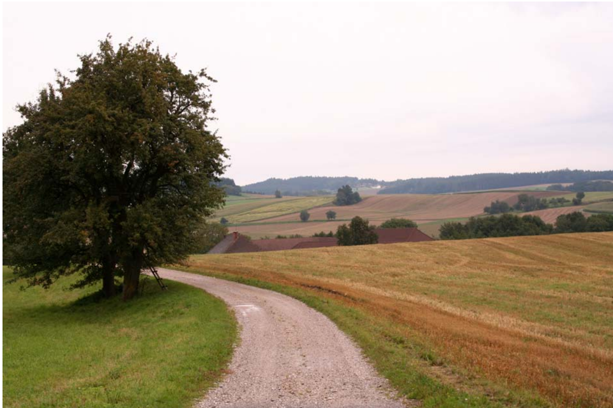
Abb. 5: Blick auf die agrarisch dominierte, flachwellige Hügellandschaft bei Moosham