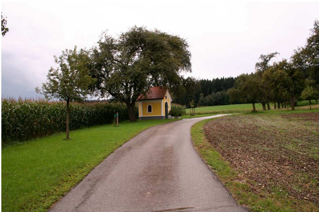
Abb. 8: Blick auf Obstbaumwiese und Marterl südlich Niederau