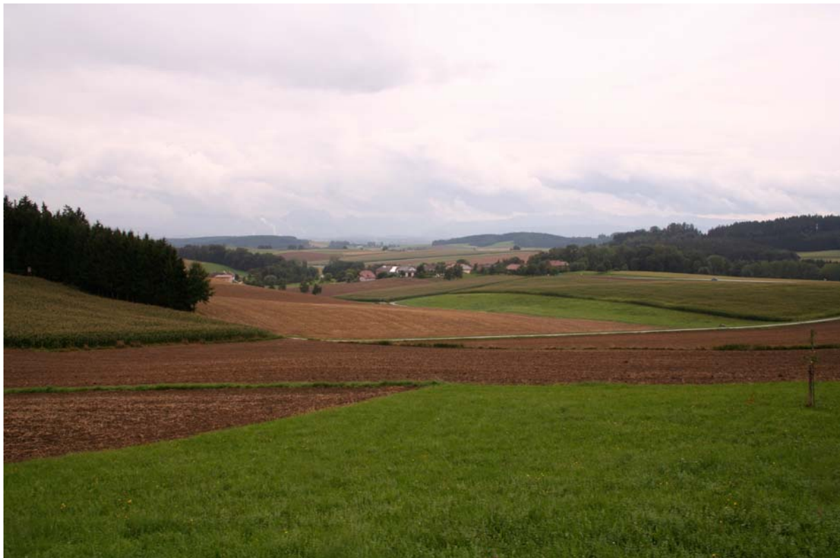
Abb. 6: Blick auf Iming