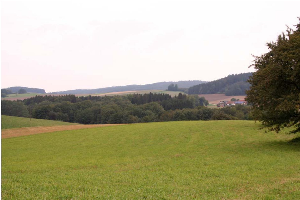
Abb. 7: Wald- und Ackerdominierte Landschaft bei Moosham