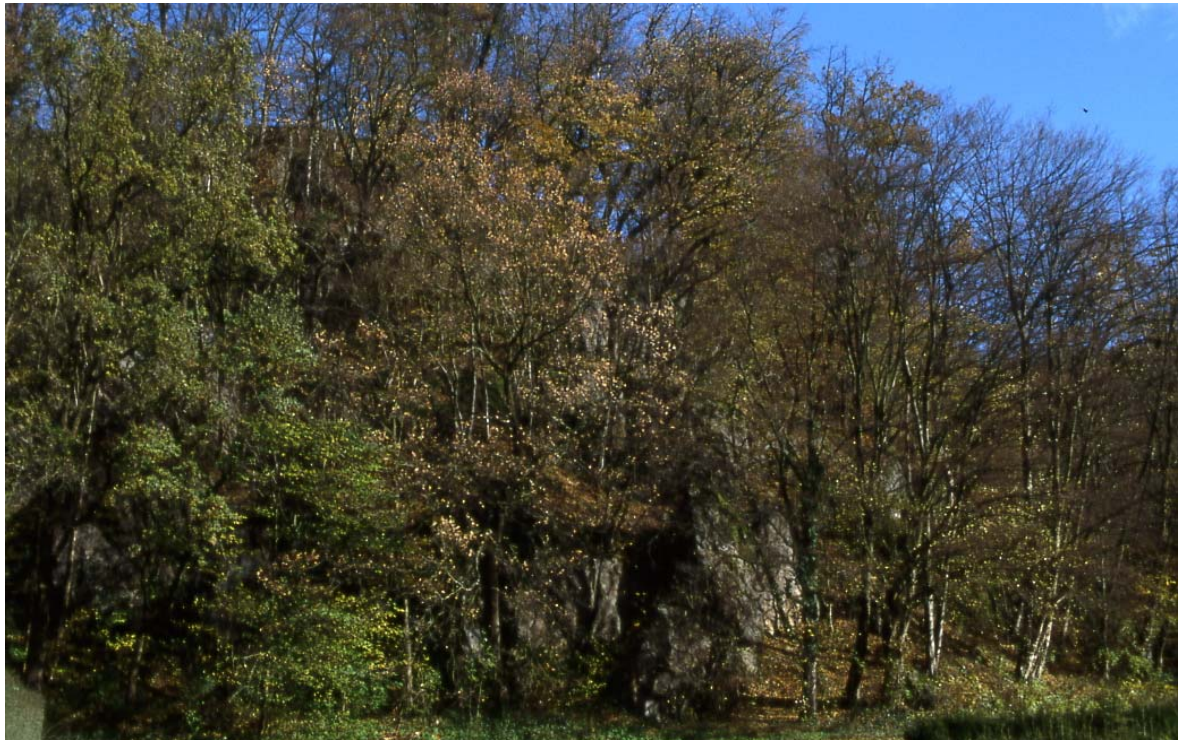
Abb. 3: anstehender Granit an der Terrassenböschung mit naturnahem Laubwald