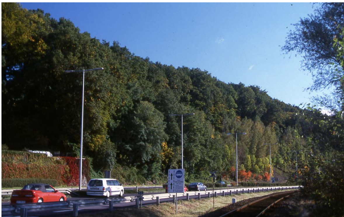
Abb. 2: bewaldete Terrassenkante im Ortsgebiet von Puchenau