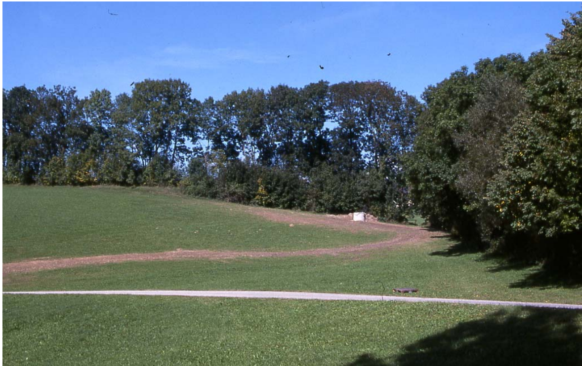
Abb. 1: gut strukturierte Hecke in der Kulturlandschaft des Berg- und Hügellandes