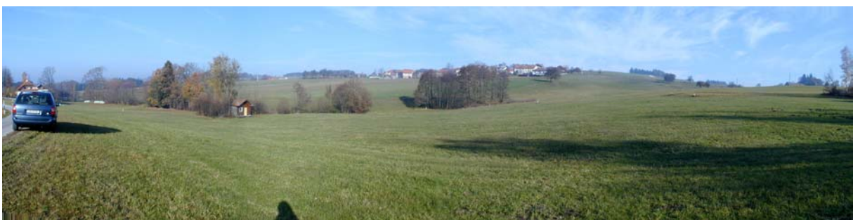
Foto 16: Blick im Bereich der Ortschaft Schwarzeredt Richtung Norden (Eitzing)