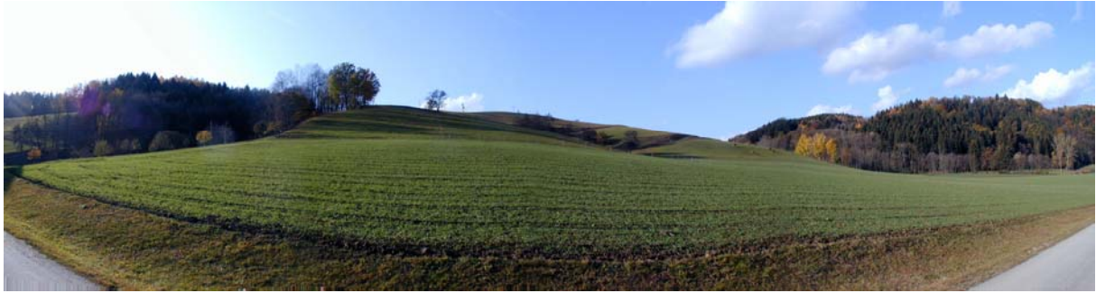
Foto 13: Blick Richtung Westen im Bereich der Ortschaft Löwengrub