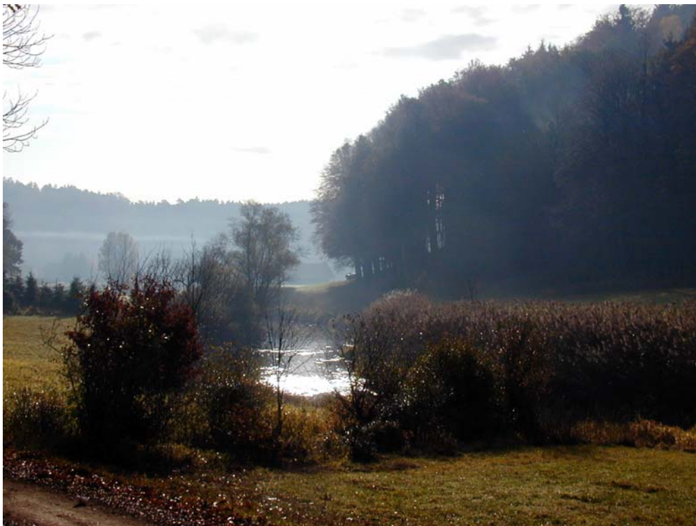
Foto 8: Sandbach (später Aschach) im Bereich der Ortschaft Gmein mit Schilfbestand