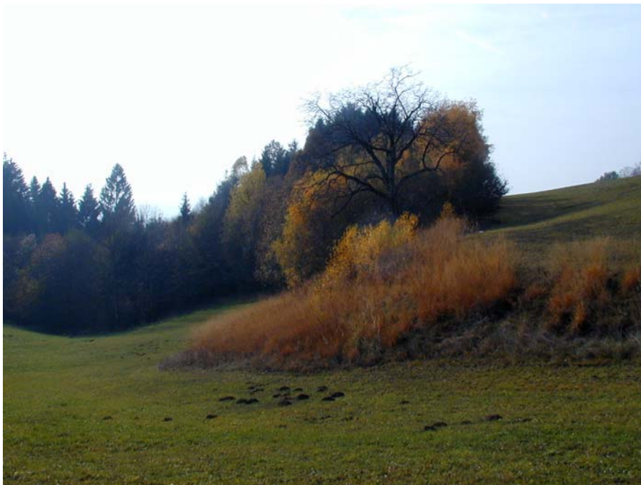
Foto 19: Trockene Sukzessionsfläche im Bereich der Ortschaft Miniberg