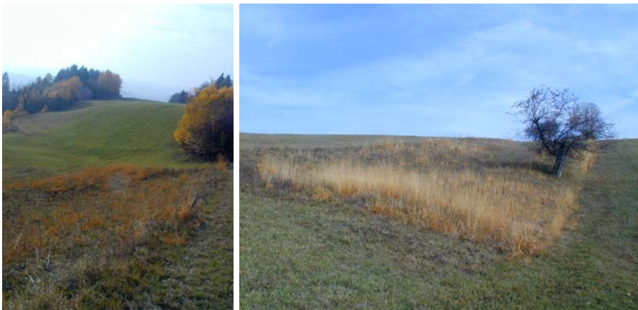
Foto 18a und 18b: Trockene Magerwiesen im Bereich der Ortschaft Miniberg