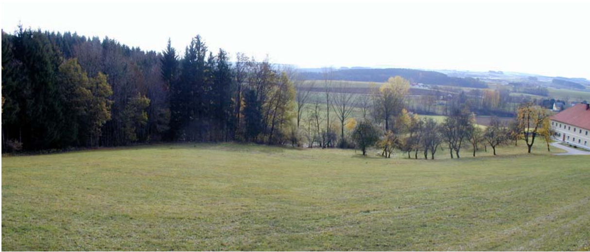
Foto 10: Blick Richtung Süden, Fotostandpunkt zwischen Scheiblberg und Schabetsberg