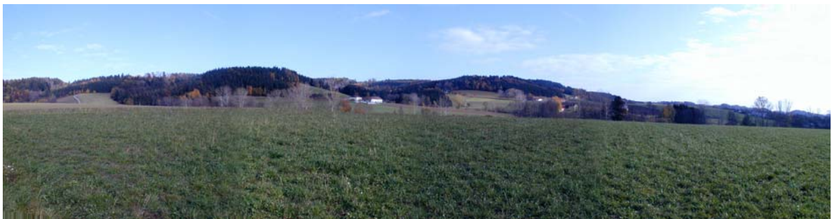
Foto 11: Blick Richtung Nordosten, Aufnahmepunkt in der Nähe der Ortschaft Hatzing