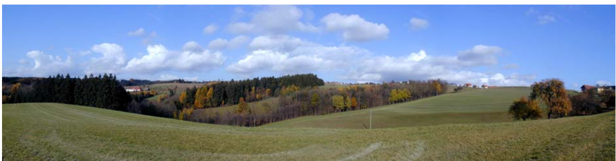
Foto 12: Blick von der Ortschaft Freiling Richtung Nordwesten (Ensfeld)