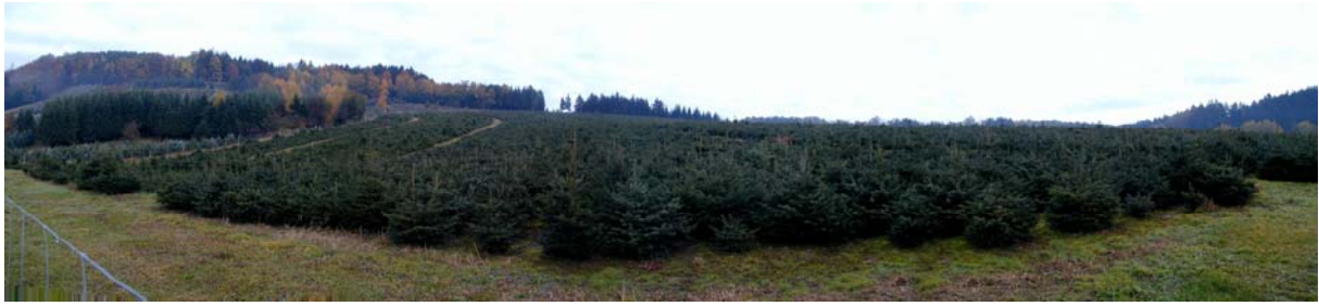
Foto 9: Neubewaldung (Christbaumkultur) im Bereich der Ortschaft Gmein