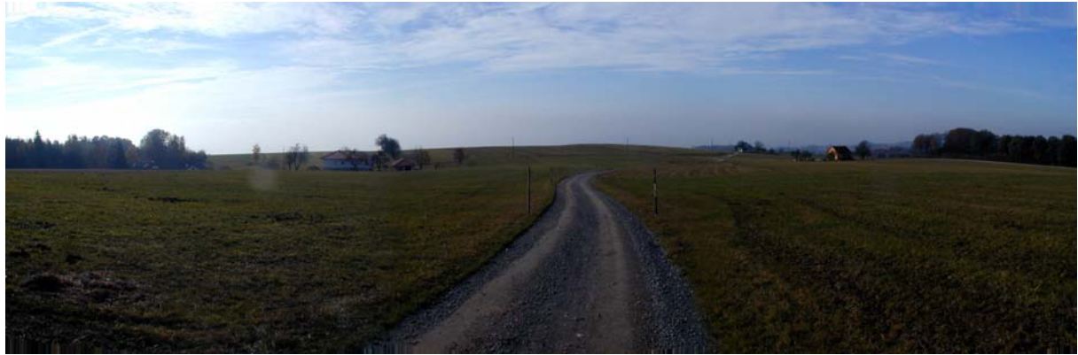
Foto 17: Blick Richtung Süden im Bereich der Ortschaft Schwarzeredt