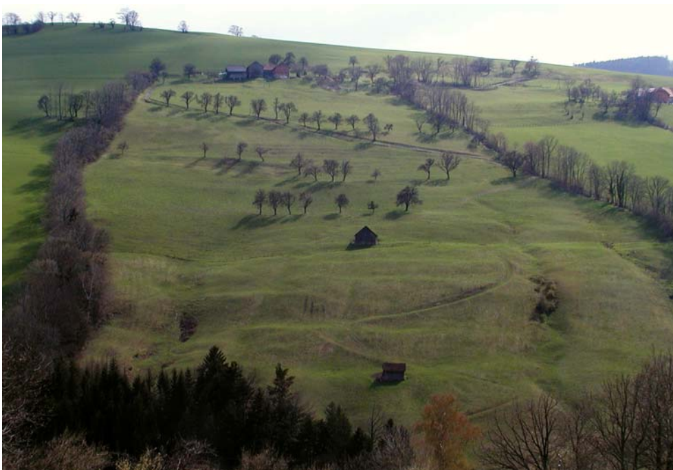
Abbildung 6: Von feuchten Rinnen durchzogener Unterhangbereich im Ramingtal. (Foto Nr.: 41514023)