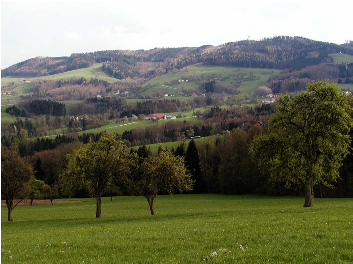
Abb. 4 Der Rücken vom Damberg zum Spadenberg mit den ausgedehnten Buchenwäldern und Fichtenforsten und der engen Verzahnung mit den nördlich vorgelagerten Weideflächen

Vornehmlich nordexponierte Hänge (der westlichste Teil nach Westen zur Enns hin exponiert) des Höhenzuges Windloch-Damberg bis hinunter zur Raming. Forstlich stark genutzte, von zahlreichen Schlägen durchsetztes Waldgebiet. Mit Forststraßen gut erschlossen. Im Osten rund um das Windloch buchenreiche Wälder, die nach Westen hin fichtenreicher werden. Im Bereich des Damberges und östlich davon dominieren eher Fichtenforste das Waldbild. Laubholzreichere Bestände nördlich des Gehöfts Gaisl. Die Hänge sind im Bereich zwischen Windloch und Damberg durch mehrere Gräben gegliedert.