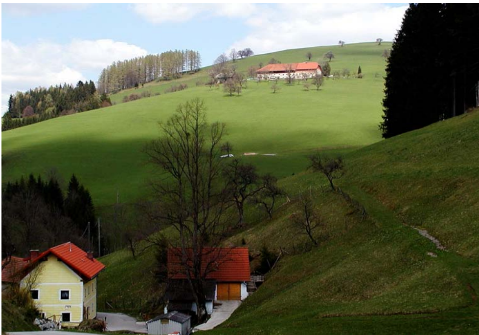
Abbildung 8: Blick aus dem Großkohlergraben auf den Rücken von Ebersegg (Foto Nr.: 41514029)