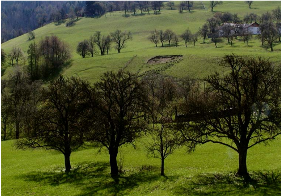
Abbildung 1: Hangbereich mit für das Flyschgebiet typischen Hangrutschungen. (Foto Nr.: 41514004)