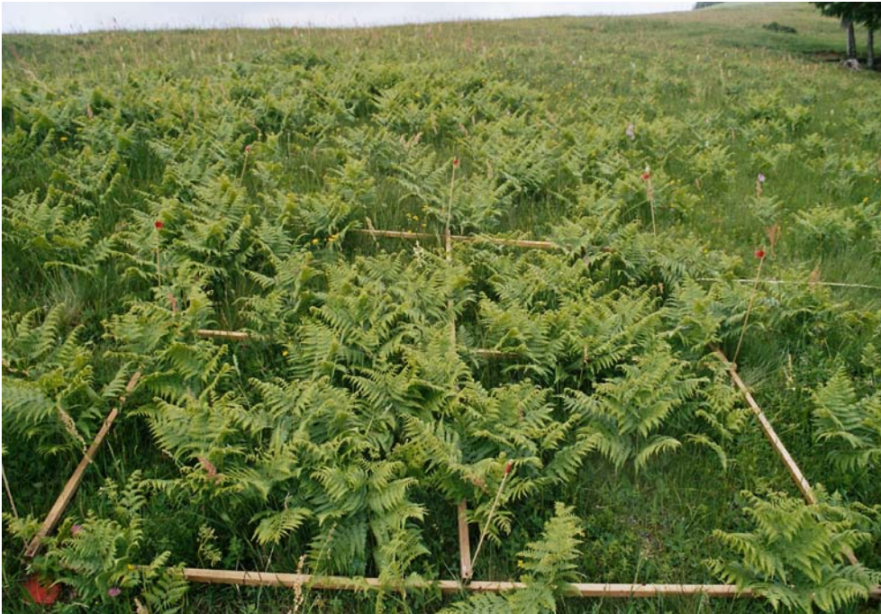
Abbildung 9: Adlerfarn auf Borstgras (Foto Nr.: 41514030)