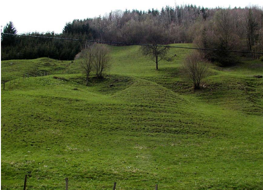
Abb. 5 Magerweide im Kleinkohlergraben mit dem für das Flyschgebiet typischen Rutschungshängen und den deutlich ausgeprägten Viehgangeln.

Das Gebiet umfasst den Großkohler- und den Kleinkohlergraben bzw. im Norden das Weide- und Wiesengebiet von Ebersegg. Die Fläche ist morphologisch in die reich strukturierte Grabenregion und den nach Norden ansteigenden Rücken des Ebersegg nördlich des Ramingbaches getrennt. Dominiert im Teil das intensiv genutzte Grünland, so dominiert im Grabenbereich bei weitem die Weidefläche.