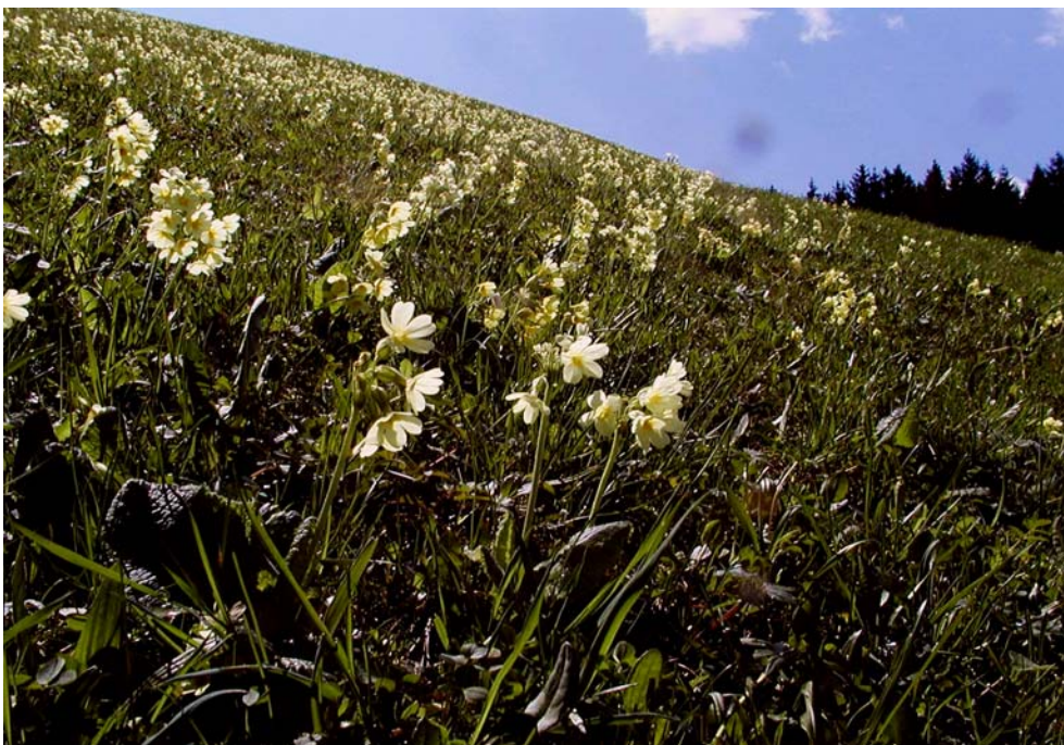
Abbildung 4: Wiese unterhalb der Laurenzikapelle. (Foto Nr.: 41514013)