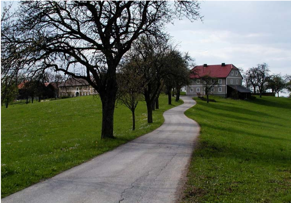
Abbildung 3: Obstbaumreihe an der Zufahrtsstraße zu einem der sehr landschaftsbildprägenden Hofgebäude. (Foto Nr.: 41514009)+