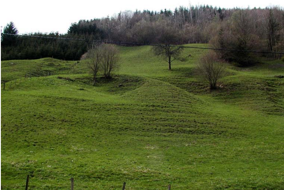
Abbildung 7: Rutschungshänge im Teilgebiet 3 im Klein Kohlergraben (Foto Nr.: 41514026)