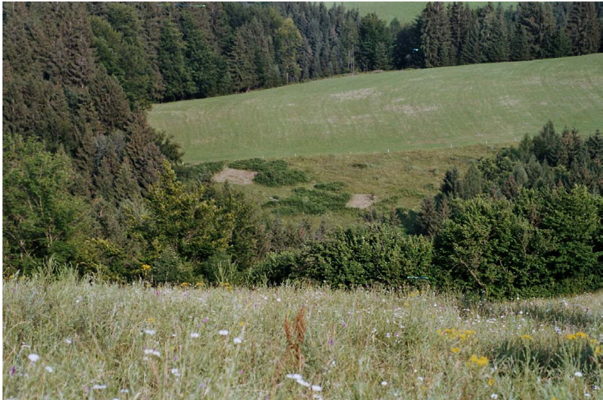
Abb. 6: Letzte Reste von Borstgrasrasen, wie z.B. in der Wolfsgruber Au mit hohen Deckungsanteilen des als Weideunkraut geltenden Adlerfarns.

Magere Wiesenreste , die mitunter Pflanzen der Halbtrockenrasen, wie Aufrechte Trespe enthalten sind auf kleinste Restflächen beschränkt. Der Großteil der Wiesen ist allerdings aufgrund des hohen Düngereintrages mittel bis stark nährstoffreich und artenarm.