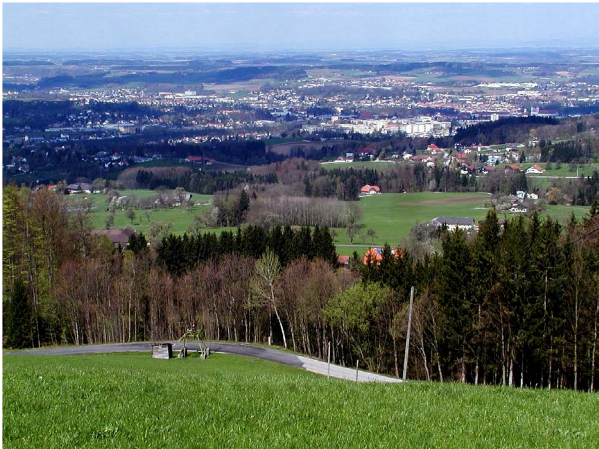
Abb. 3 Blick Richtung Steyr mit dem kleinräumigen Mix aus Wiesen- und Ackerflächen und einer Vielzahl von Gehölzen entlang der Tobel.

Agrarlandschaft im nördlichen Gemeindegebiet zwischen St. Ulrich, Kleinraming, Unterwald und Gmain. Das Erscheinungsbild der Landschaft wird von Nutzwiesen geprägt, zwischen denen, rund um die einzelstehenden Gehöfte, Streuobstwiesen eingebettet sind. Das Geländeformen sind leicht wellig und von mehreren Bächen durchzogen, die von kleinen linearen Gehölzen begleitet werden. Zusammenhängende Ackerflächen befinden sich zwischen Gmain und St.Ulrich östlich von Thaddlau. Im östlichen Teil der Fläche entlang der Raming zieht ebenfalls ein zusammenhängender Block landwirtschaftlich genutzter Fläche bis nach Kleinraming.