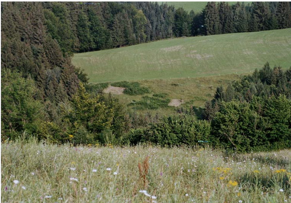
Abbildung 5: Borstgrasrasen in der Wolfgruber Au ( Foto Nr.: 41514017)