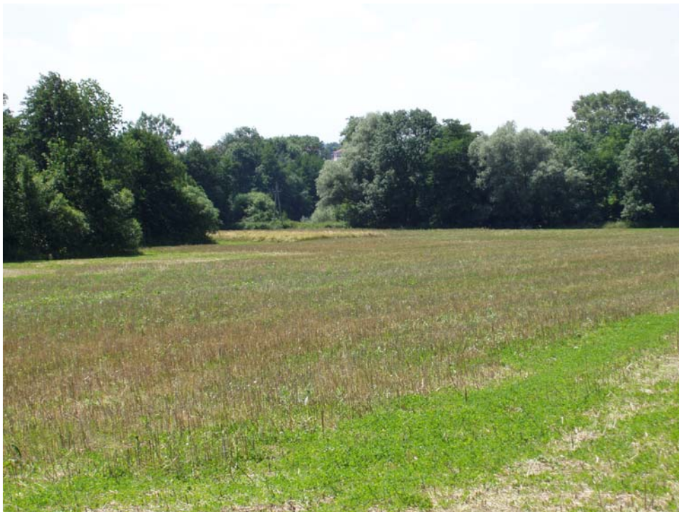
Abb. 10: Uferbegleitgehölze am Innbach