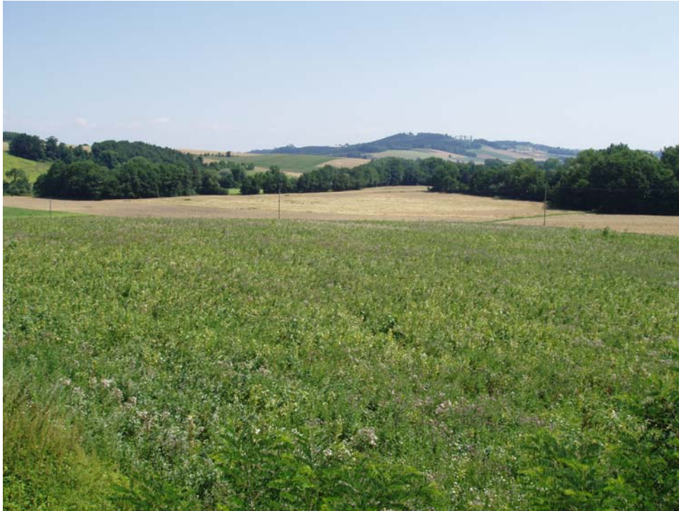
Abb. 3: Innbachtal mit Mäandern des Innbaches bei Edlgassen