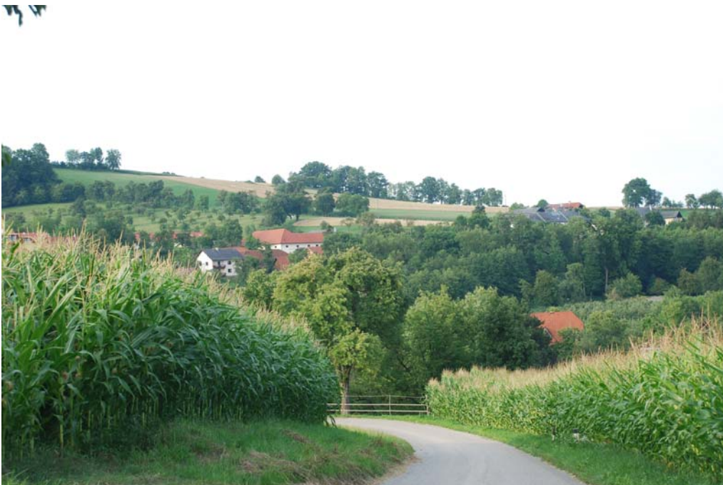
Abb. 2: Reich strukturierte Landschaft in Bergern