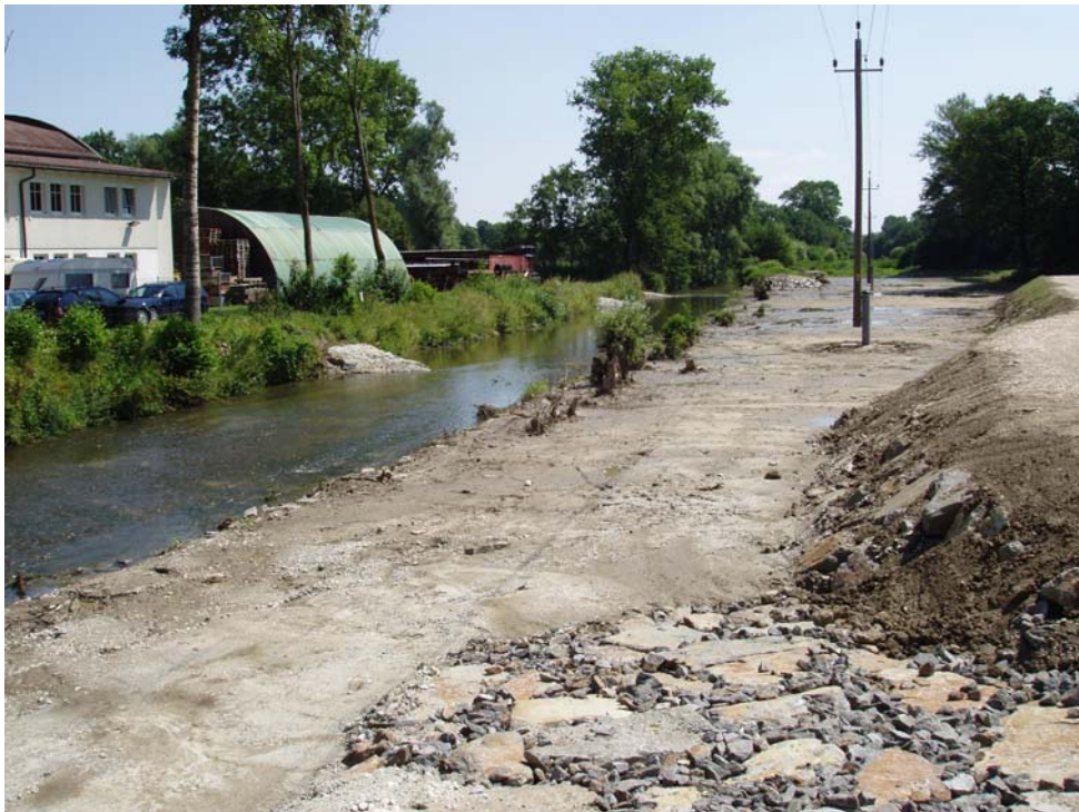
Abb. 6: Retentionsbecken am Innbach bei Mauer