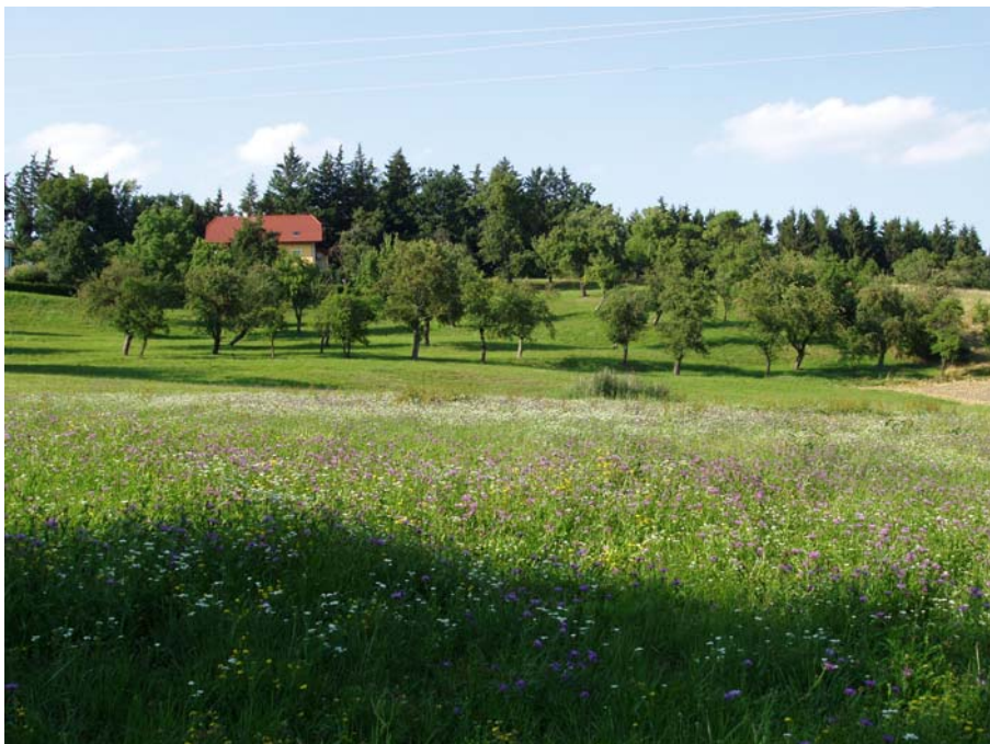
Abb. 8: Streuobstbäume in Lachgraben