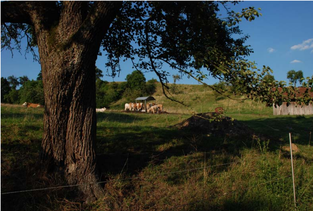
Abb. 11: Südexponierte Weide bei Hilling