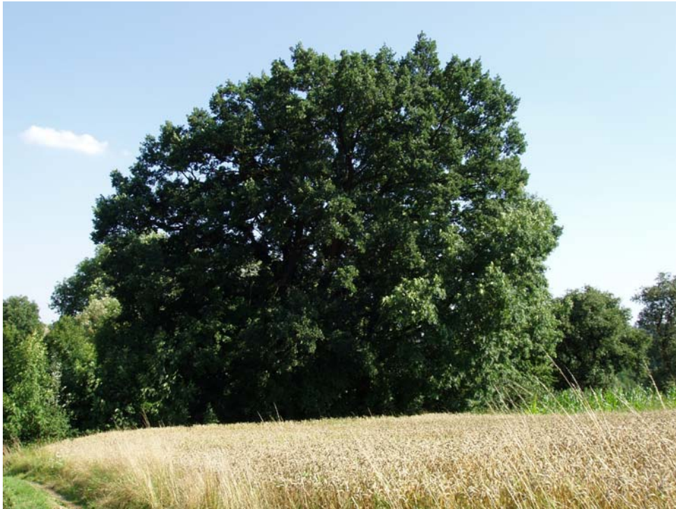
Abb. 9: Freistehende Eiche bei Parzham