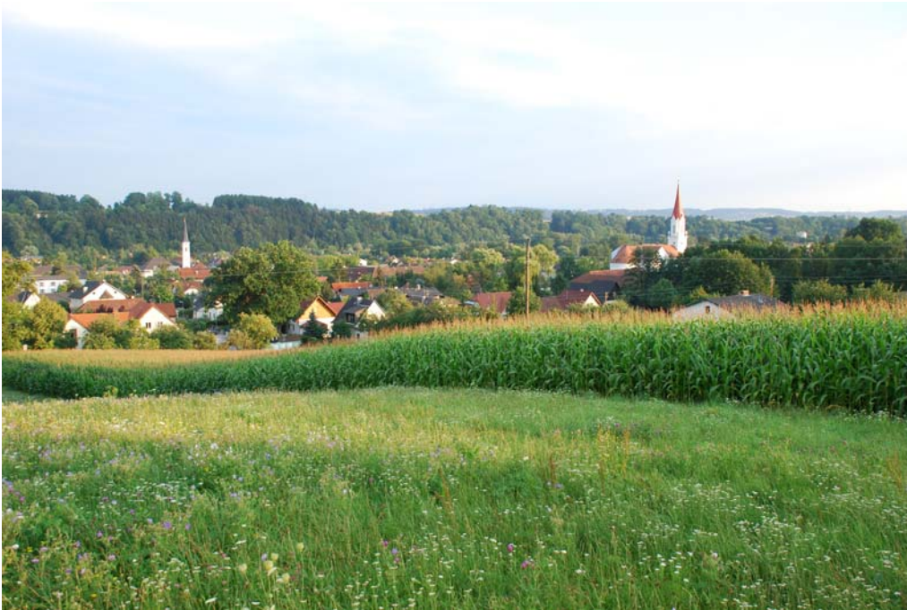
Abb. 1: Wallern an der Trattnach