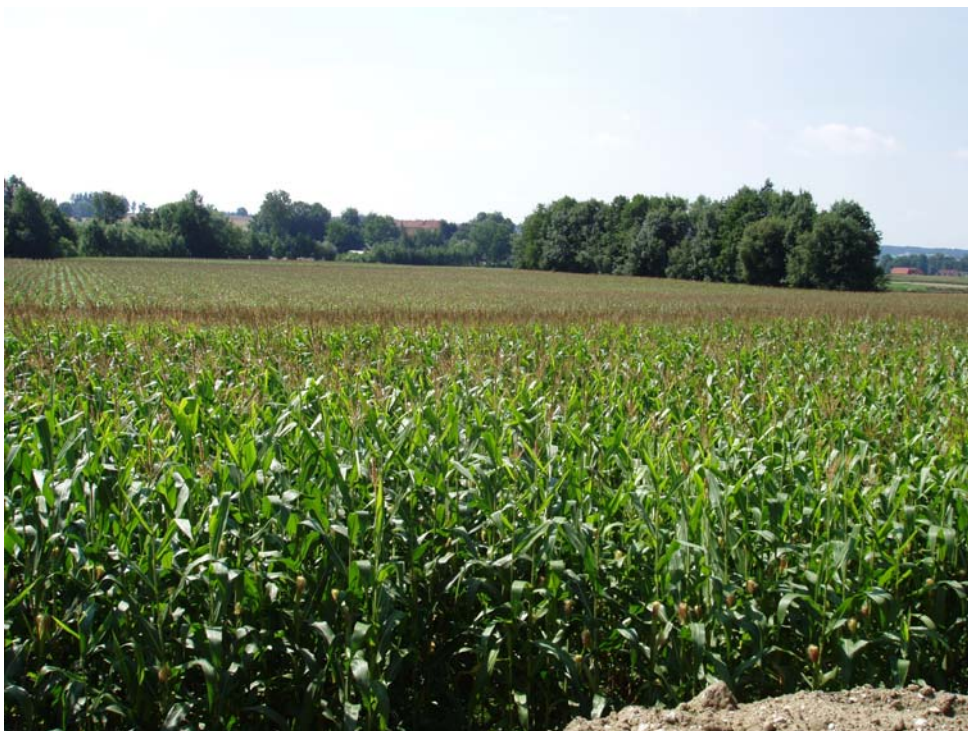
Abb. 14: Großflächiger Maisanbau im Innbachtal