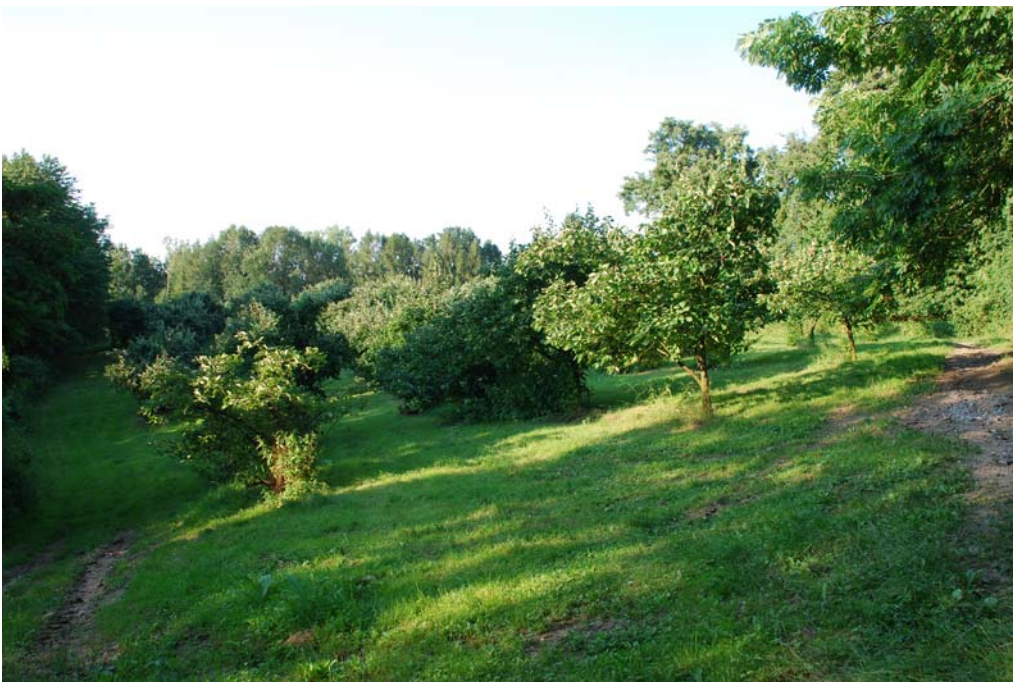
Abb. 12: Quittenplantage in Furth