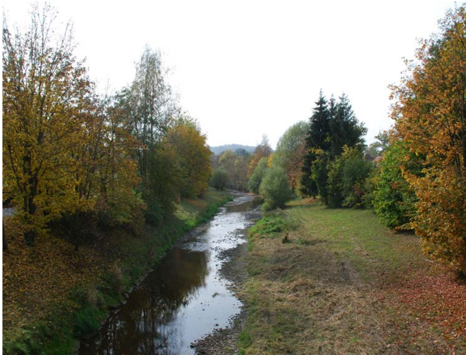
Abb. 5: Trattnach bei Wallern (Ausleitungsstrecke)