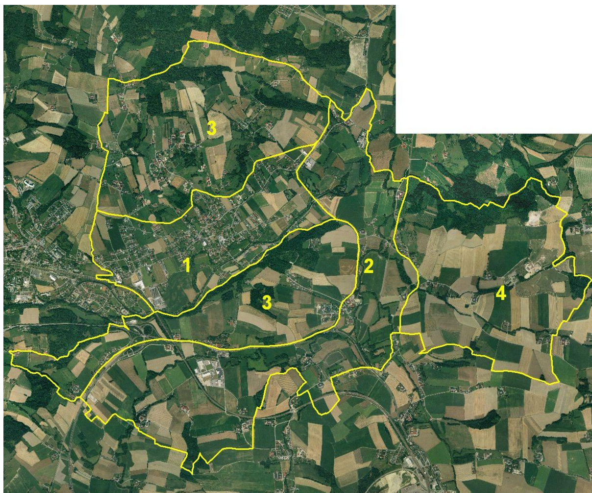
Abb. 2: Übersicht des Erhebungsgebietes mit Abgrenzung der Teilgebiete auf Grundlage von Orthofotos

Teilgebiet 1: Tallandschaft mit verdichteten Siedlungsbereichen