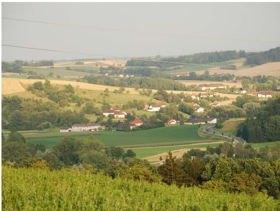
Abb. 4: Hügelige Landschaft bei Grub (Blick von Bergern)