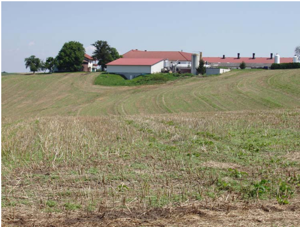
Abb. 13: Moderner Bauernhof in Hungerberg