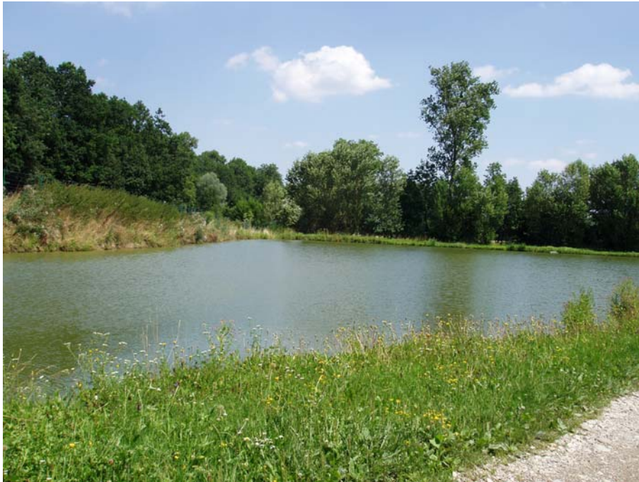
Abb. 7: Fischteich bei Edlgassen