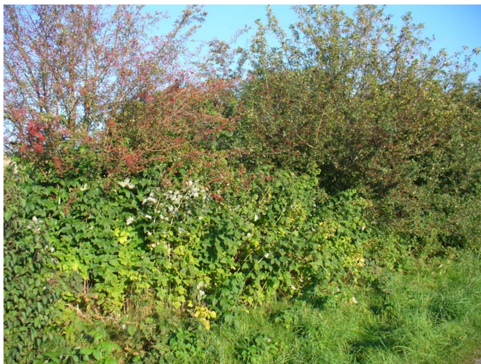
Abb. 12: artenreiche Hecke mit Pfaffenkappeler bei Zimetsberg