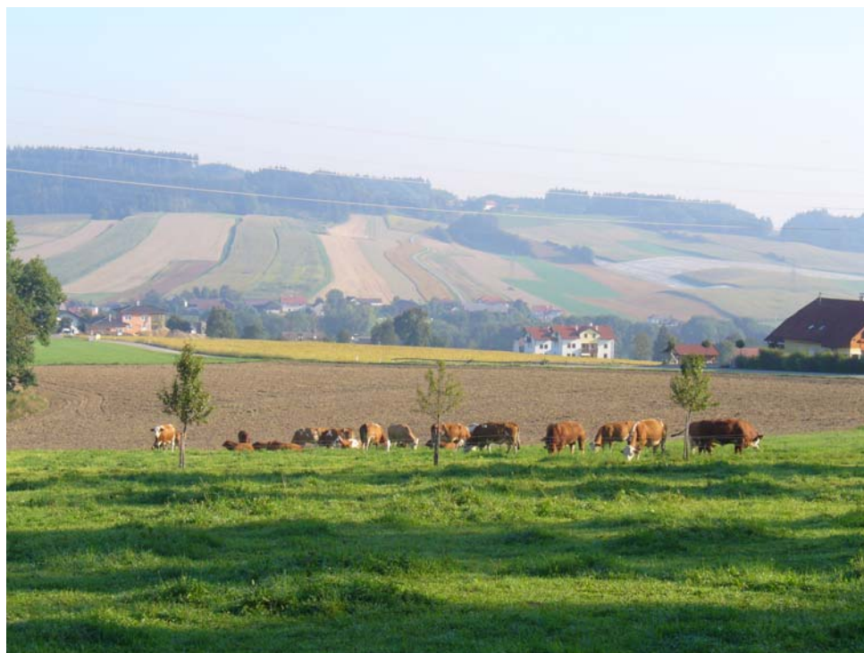
Abb. 1: Agrarlandschaft bei Weinberg