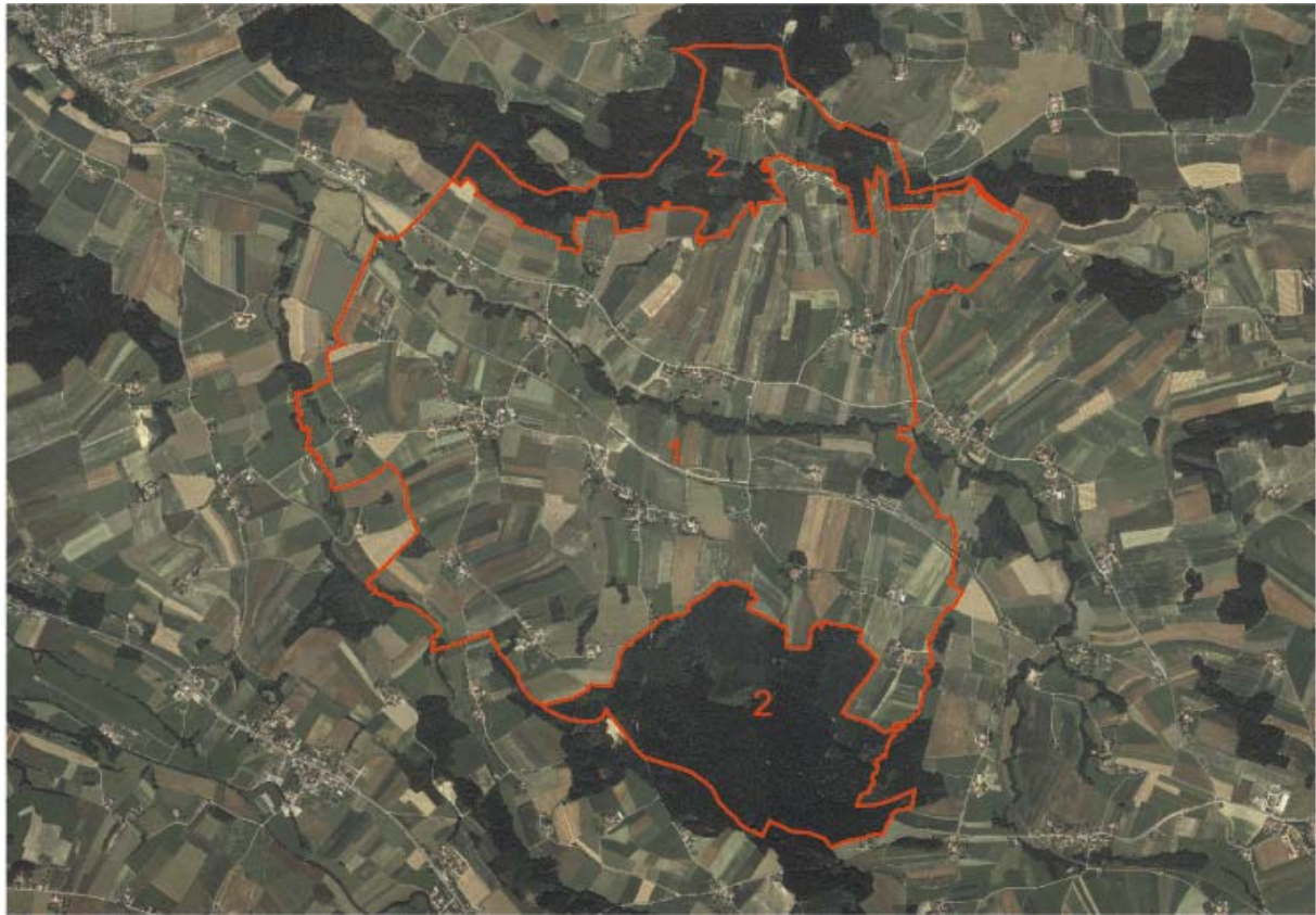
Abb. 2: Übersicht Erhebungsgebiet mit Abgrenzung der Teilgebiete und Orthofotos

Teilgebiet 1: Stark reliefierte, intensiv genutzte Agrarlandschaft Teilgebiet 2: Walddominierter Höhenrücken