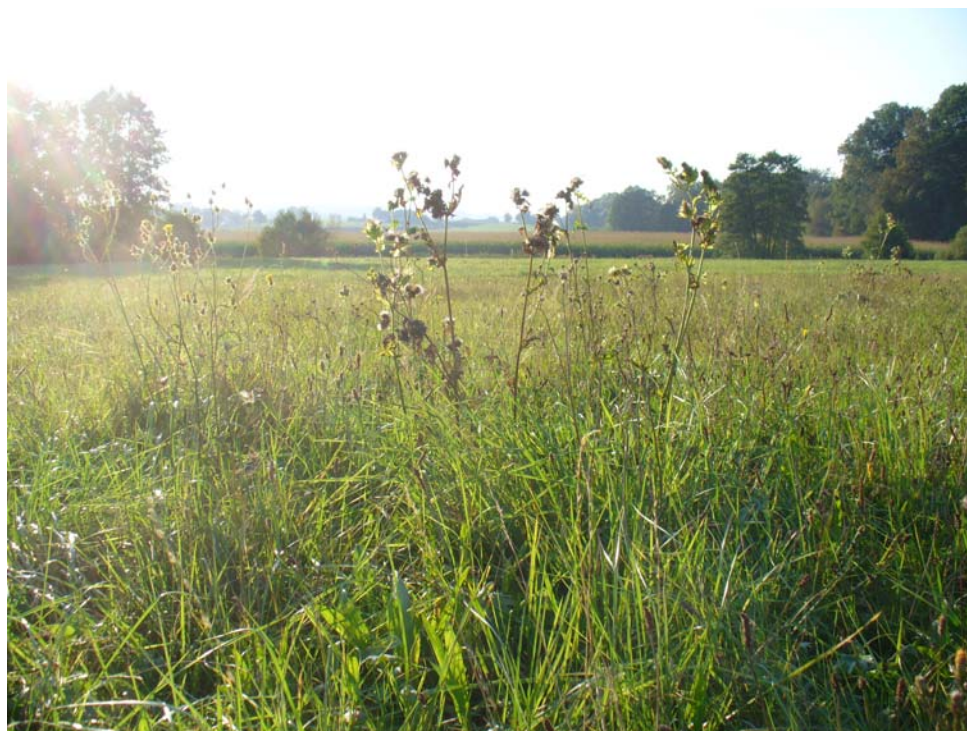
Abb. 13: Kohldistelwiese südlich Mairing