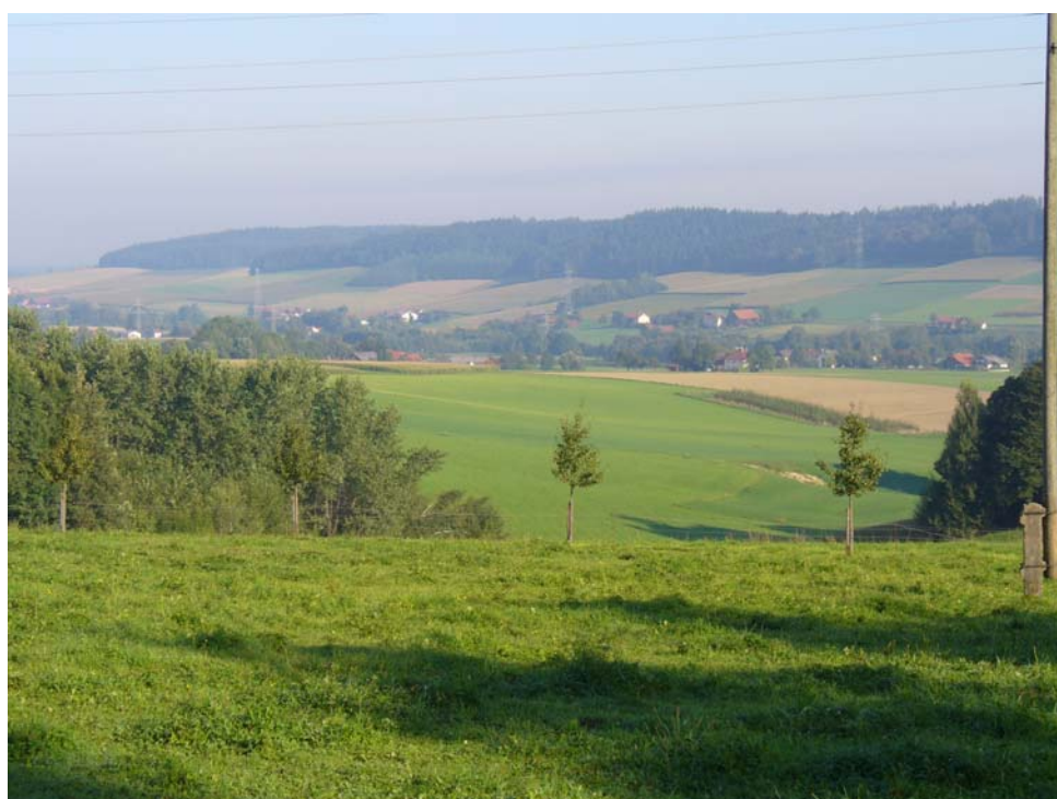
Abb. 2: Agrarlandschaft südlich Wippenham