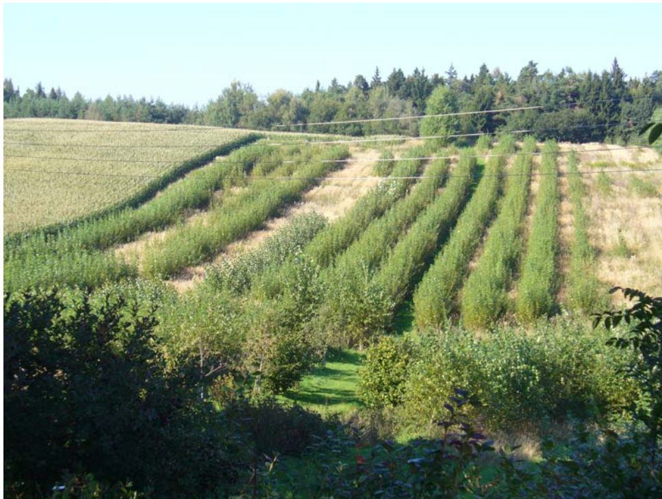
Abb. 9: Energiewald östlich Außerguggenberg