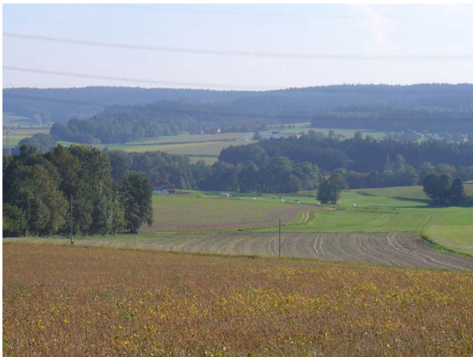
Abb. 10: reich strukturierte Landschaft an östlicher Gemeindegrenze