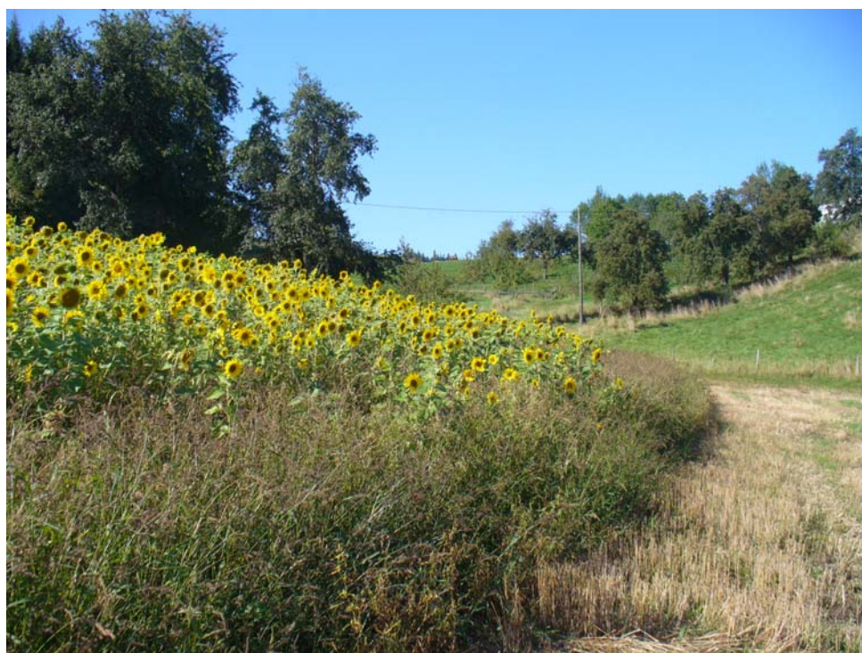
Abb. 8 Sonnenblumen und Obstgarten südlich Außerguggenberg