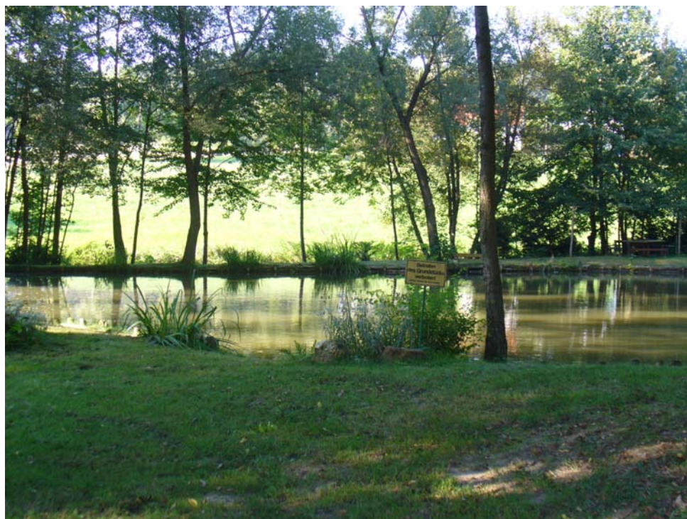
Abb. 11: Teich an östlicher Gemeindegrenze