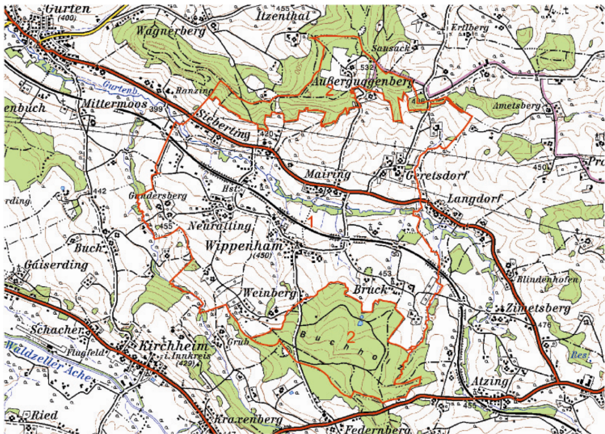
Abb. 1: Übersicht Erhebungsgebiet mit Abgrenzung der Teilgebiete und ÖK50

Das Teilgebiet 2 umfasst die von Fichtenforsten dominierten Randbereiche auf den beiden Höhenrücken im Norden und Süden des Gemeindegebiets.