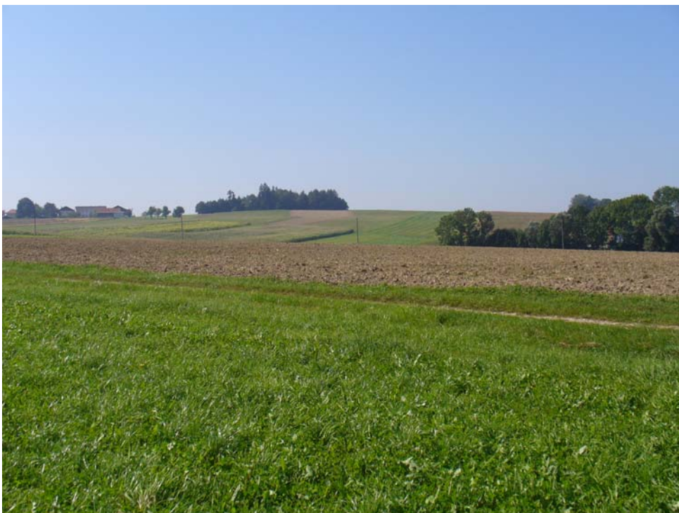
Abb. 4: ausgeräumte Agrarlandschaft südlich Wippenham