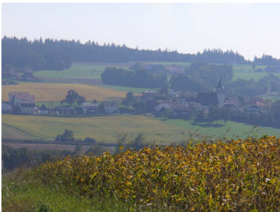
Abb. 6: Wippenham