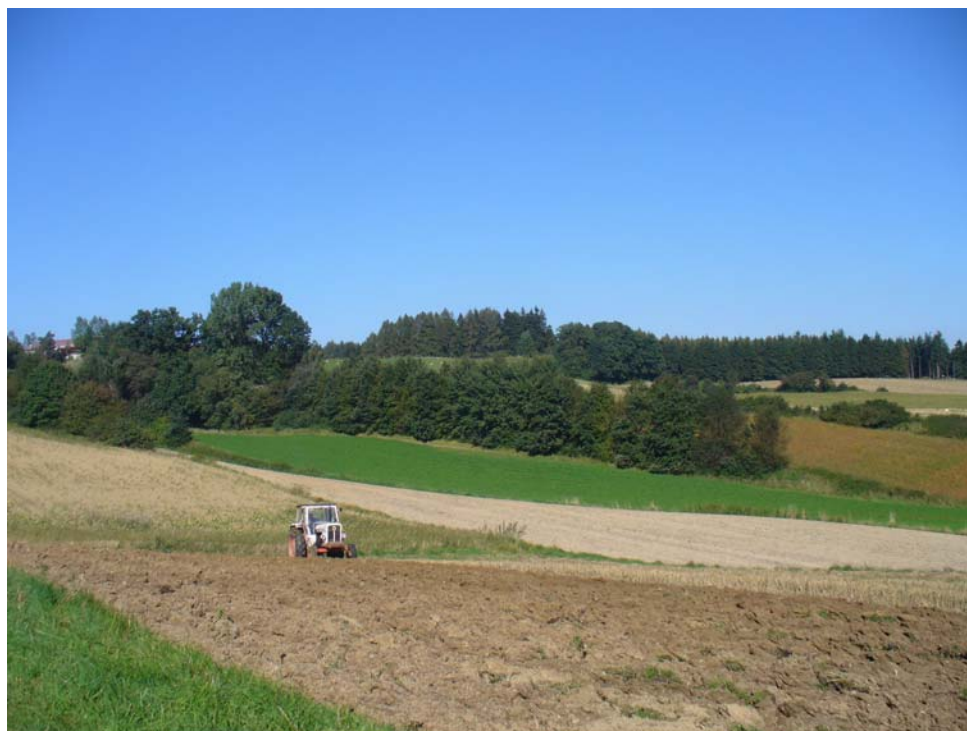
Abb. 7: gut strukturierte bäuerliche Landschaft südlich Außerguggenberg (Teilgebiet 2)