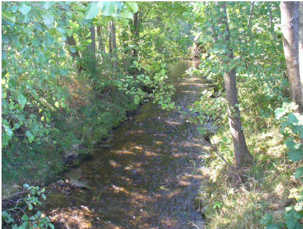
Abb. 5: naturnaher Gewässerabschnitt südlich Sieberting