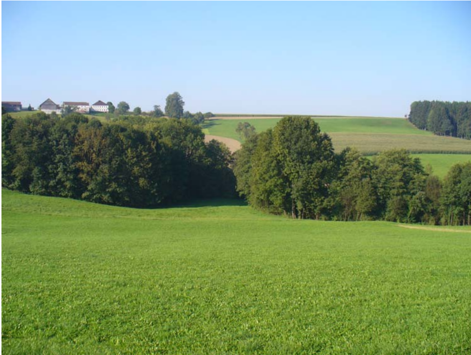
Abb. 3: Ufergehölz an Gemeindegrenze zu Kirchheim