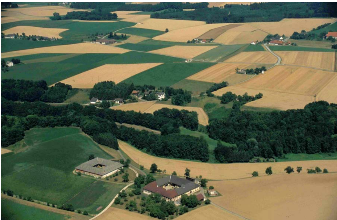
Bild 2: Auen des Simsenbergbaches und Kulturlandschaft. 14.7.2002