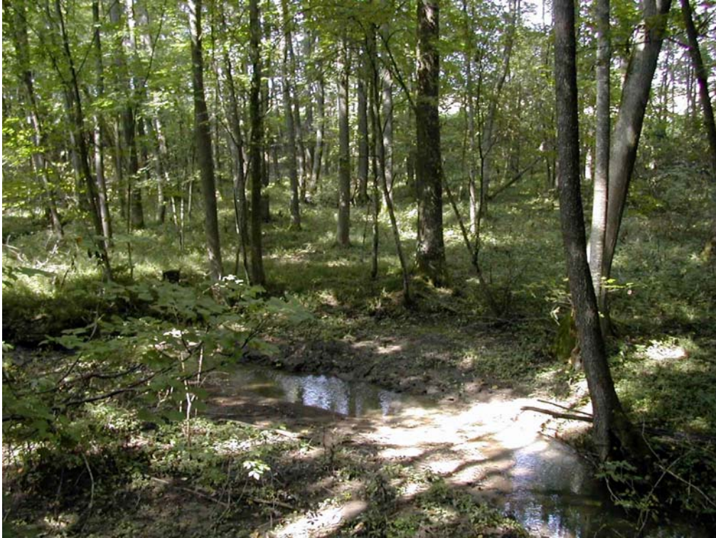
Bild 3: Eschen-Schwarzerlen-Au am Hagleitenbach (Nr. 420). 31.8.2002