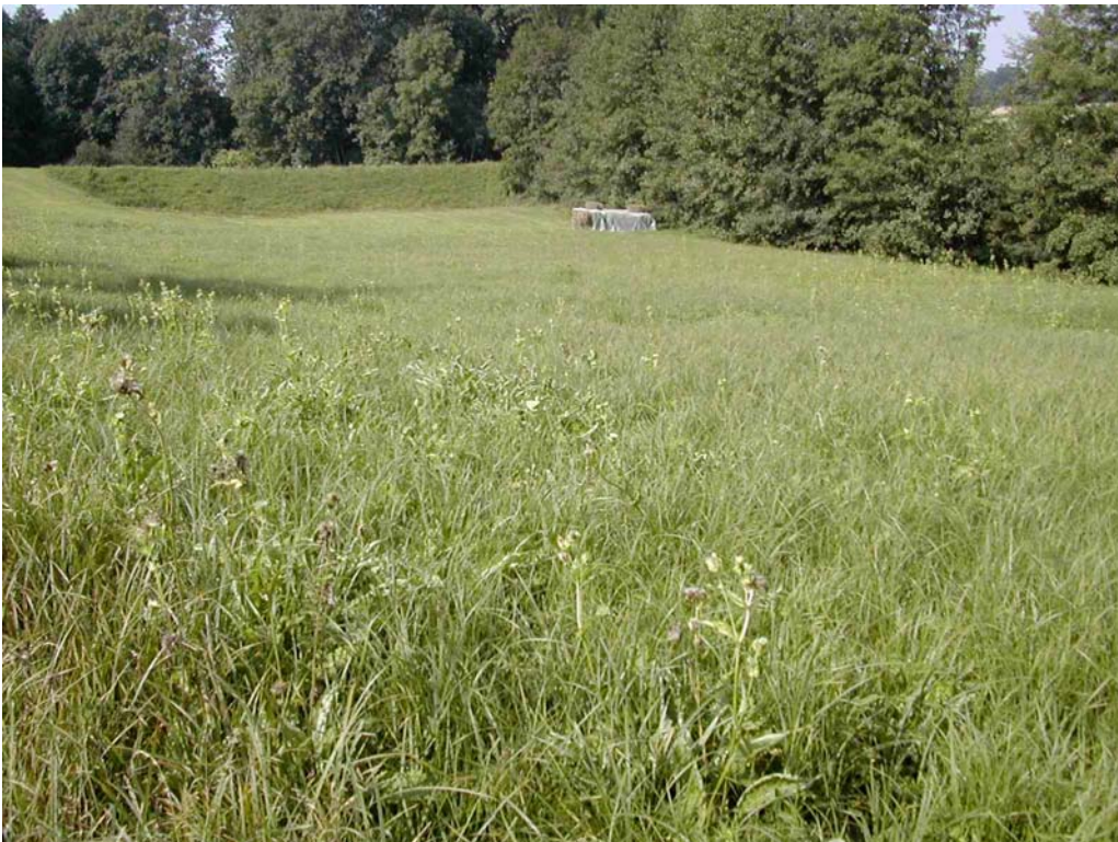
Bild 6: Seggen-dominierte Feuchtwiese (Nr. 413). 31.8.2002