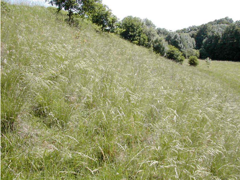
Bild 5: Verbrachter Trespen-Halbtrockenrasen auf Geländestufe (Nr. 567). 2.6.2002