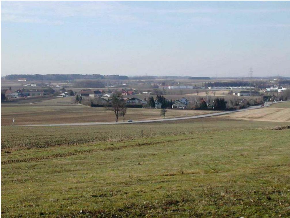
Bild 1: Blick von der Südgrenze des Gemeindegebietes auf die südwestlichen Ausläufer der Ortschaft Wolfert. 10.3.2003