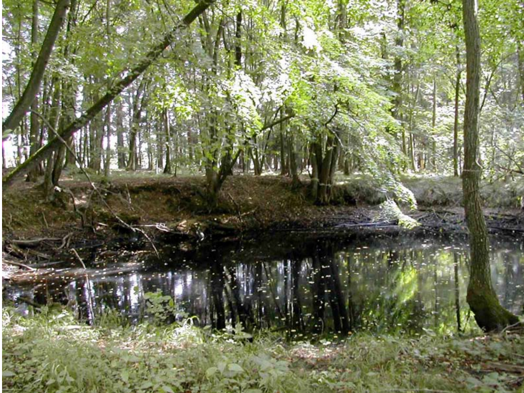
Bild 7: Unbewirtschafteter Waldweiher (Nr. 309). 3.9.2002