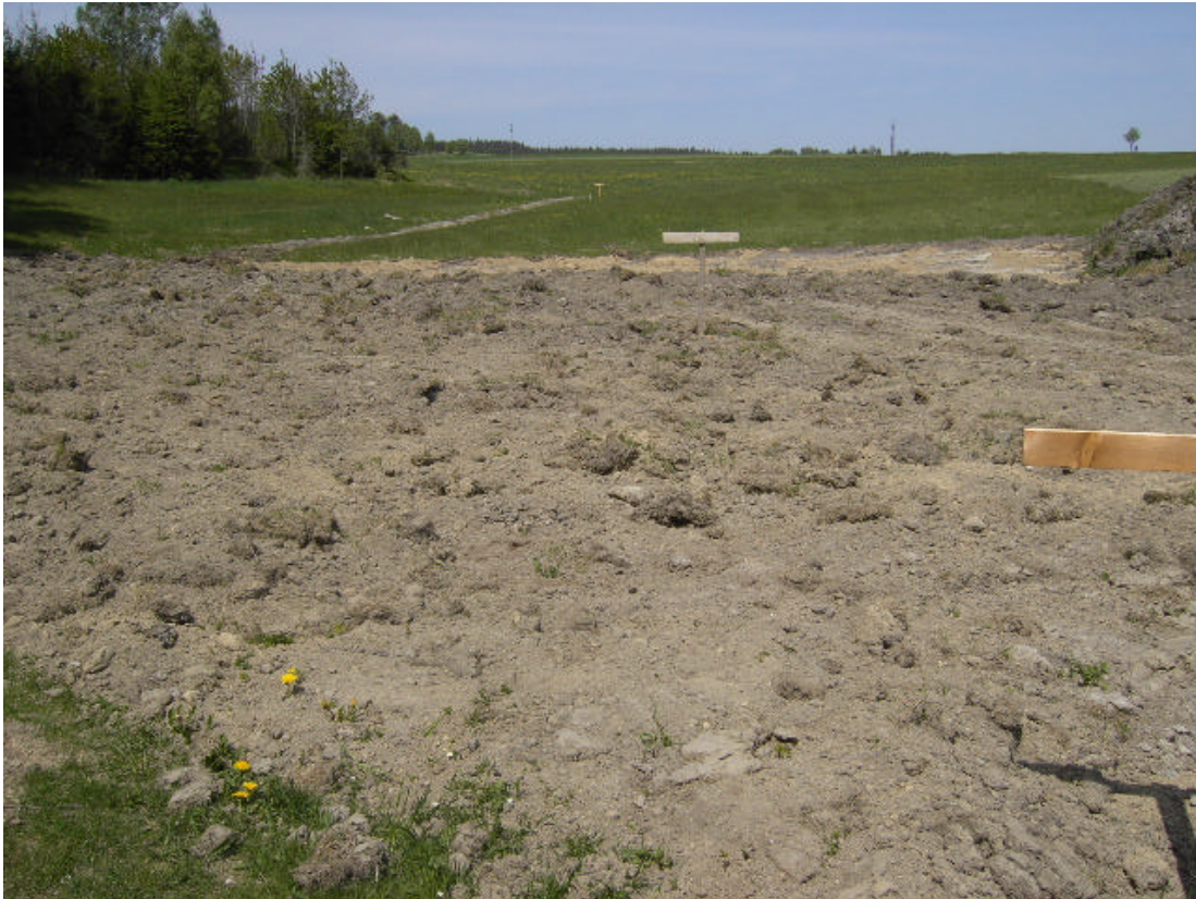
Abb. 15: Frische Melioration einer Extensivwiese im Nordwesten von Langzwettl