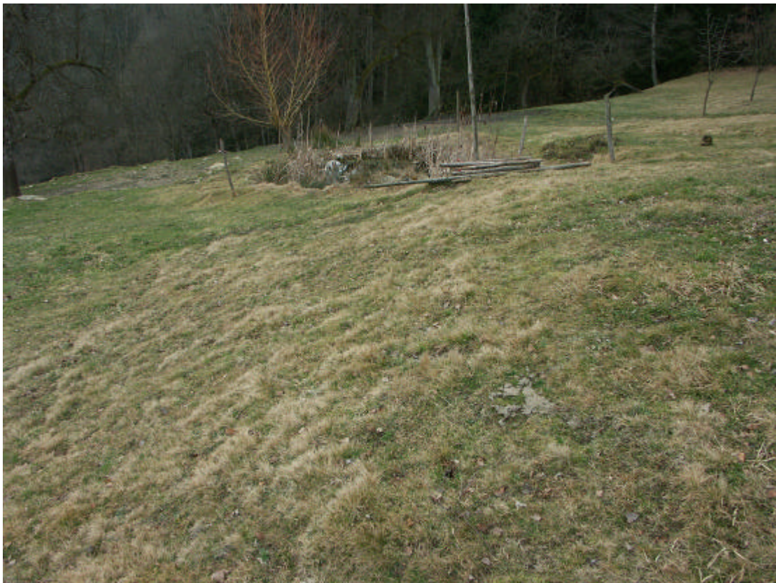
Abb. 2: Bürstlingsweide mit kleinem Teich