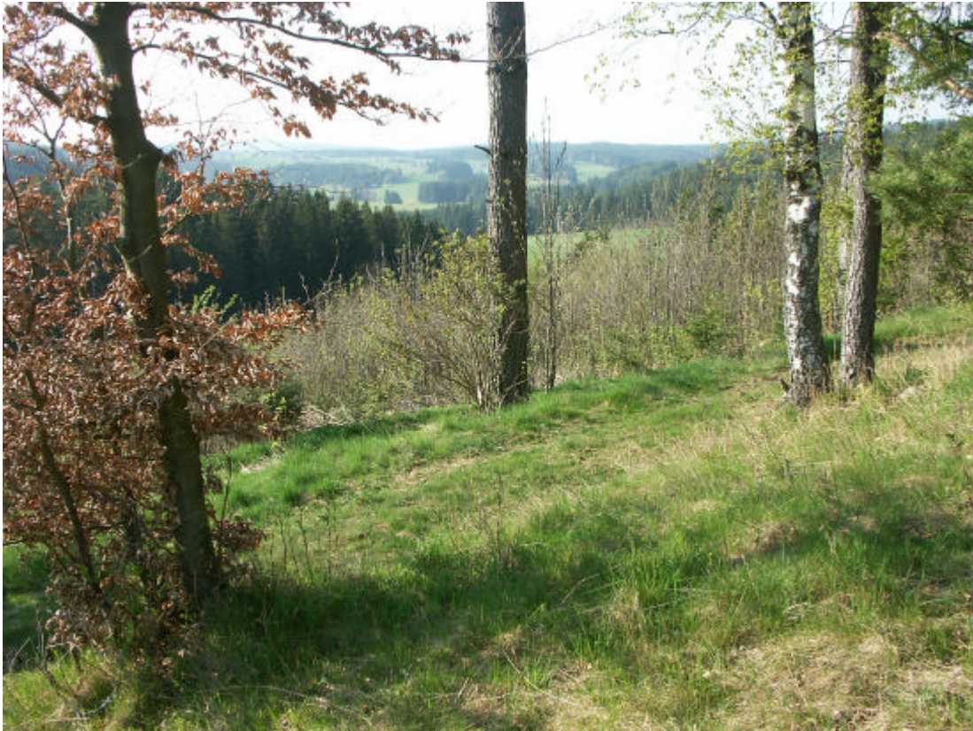
Abb. 9: Lichtung am Waldrand, Lebensraum der Bergeidechse