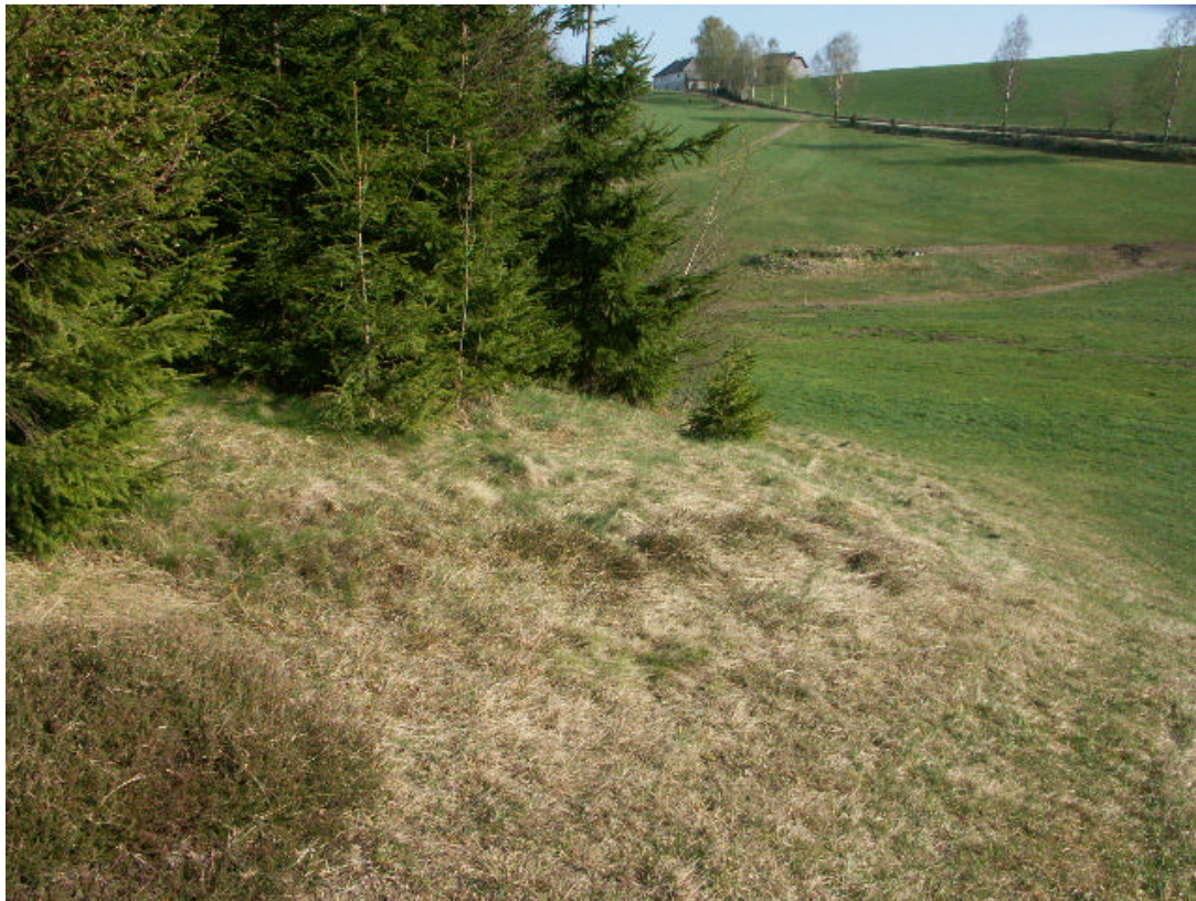
Abb. 8 Heidekraut und Bürstling an magerem Waldsaum