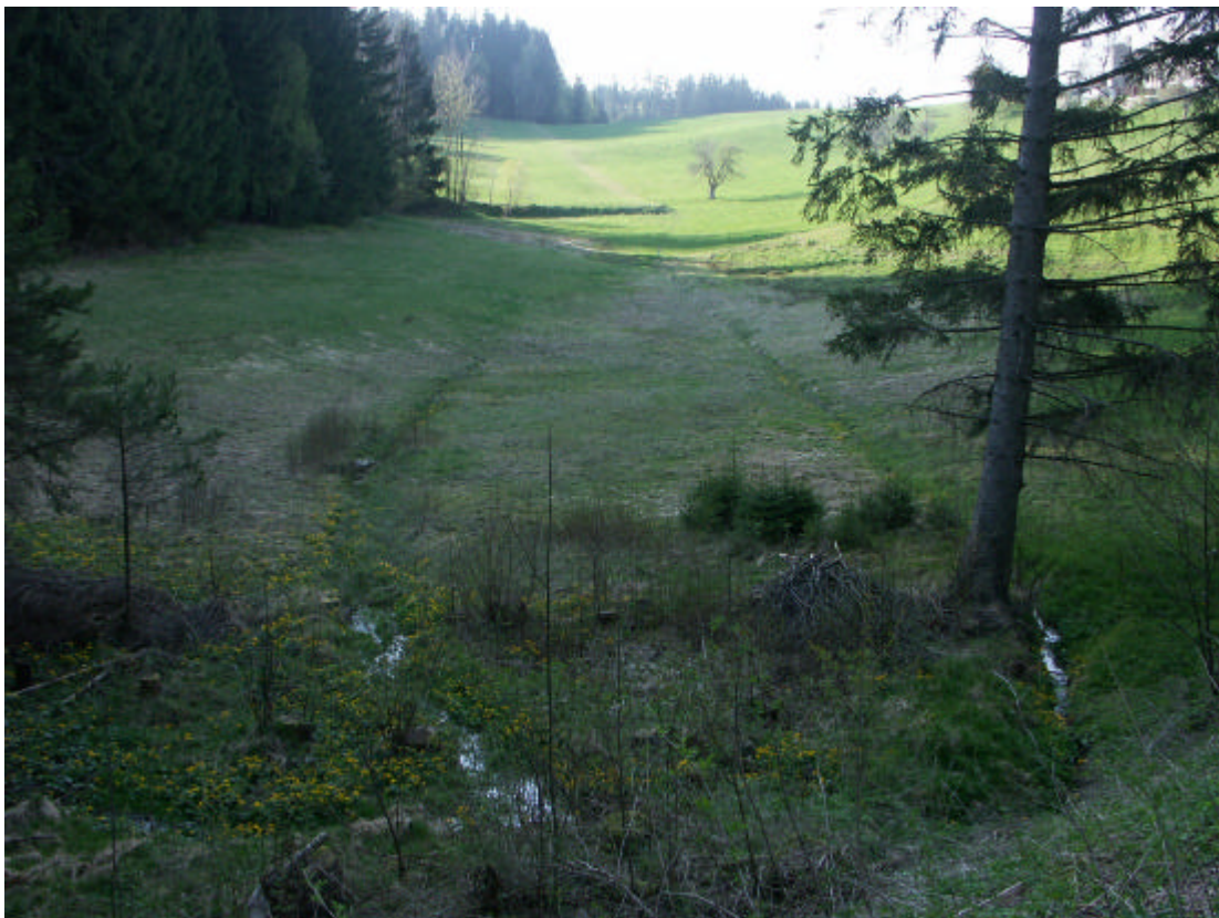
Abb. 12: Sehr wertvolle Feuchtwiese beim Unterberger