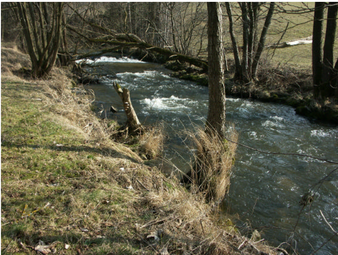
Abb. 4: Naturnahe Ufergehölze der Rodl bei der Mittermühle