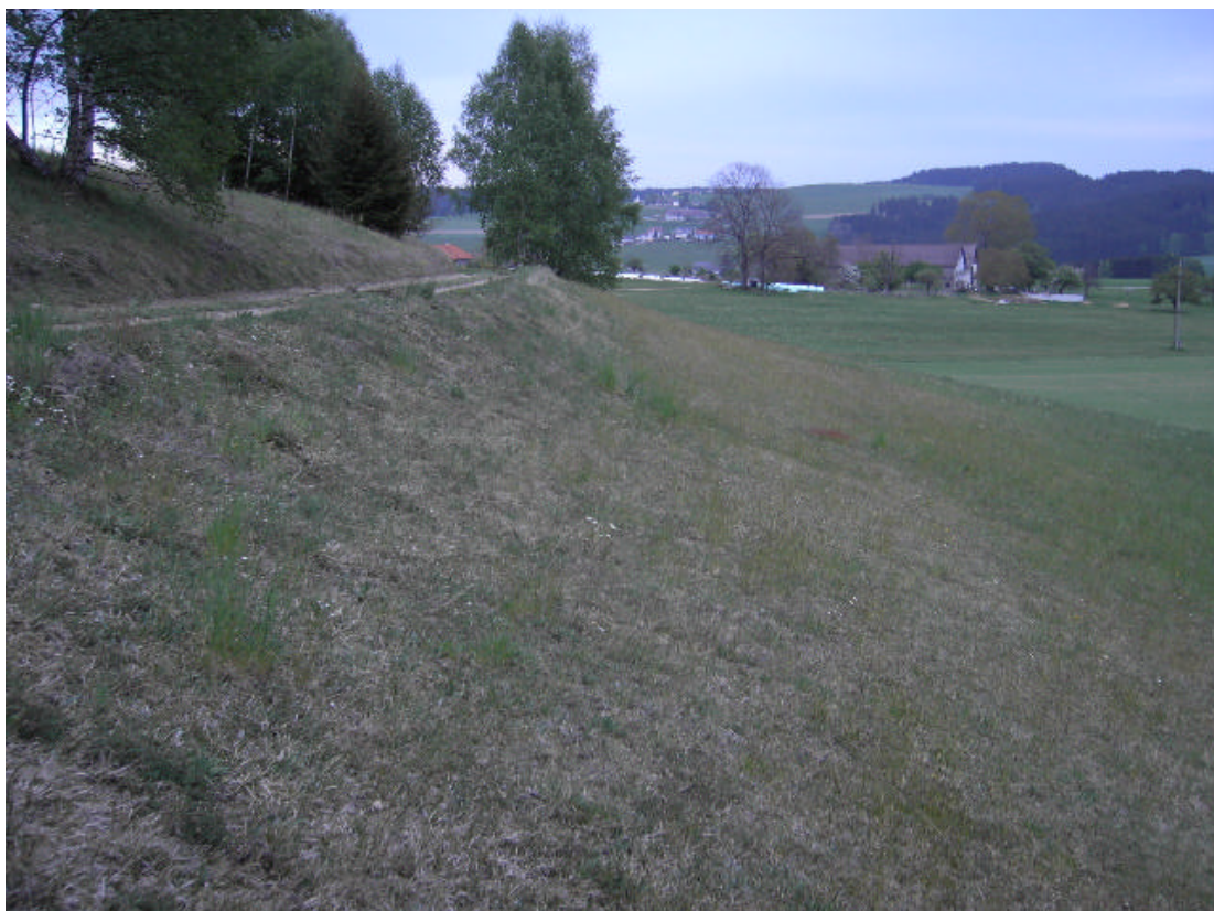
Abb. 18: Ausgeprägte, wertvolle Trockenwiesen existieren im Südwesten von Langzwettl