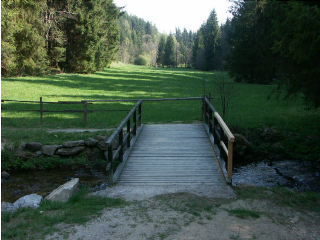
Abb. 7: Noch vorbildlich gepflegte Wiesen im Engtal der Distl, einem bedeutenden Naherholungsgebiet