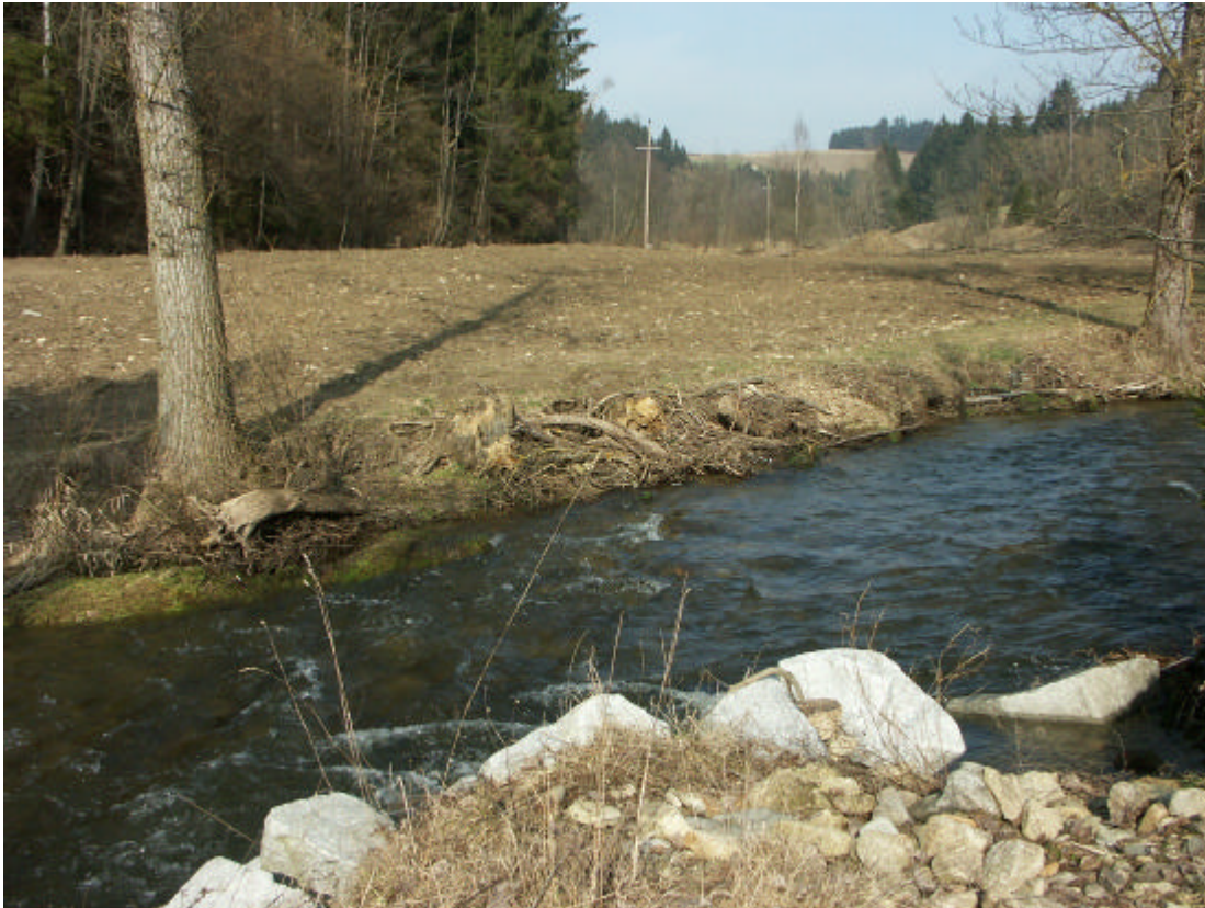
Abb. 3: Zugeschüttete Teichanlage und illegale Uferbeeinträchtigungen bei der Edlmühle