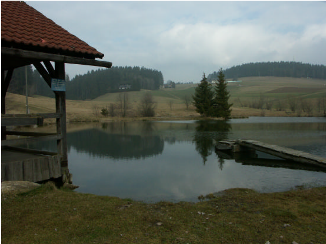
Abb. 1: Teich bei Zwettl