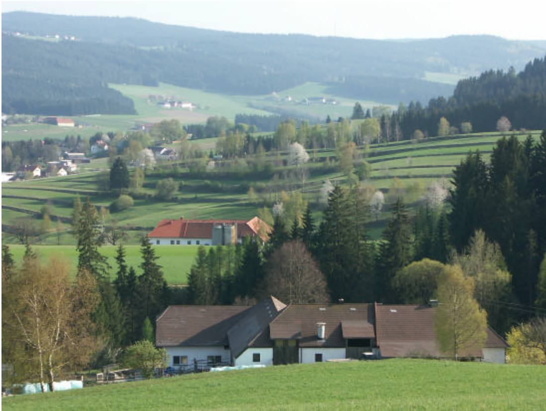
Abb. 11: Blick vom Unterberger über Gruber und die sehr attraktive Stufenrainlandschaft