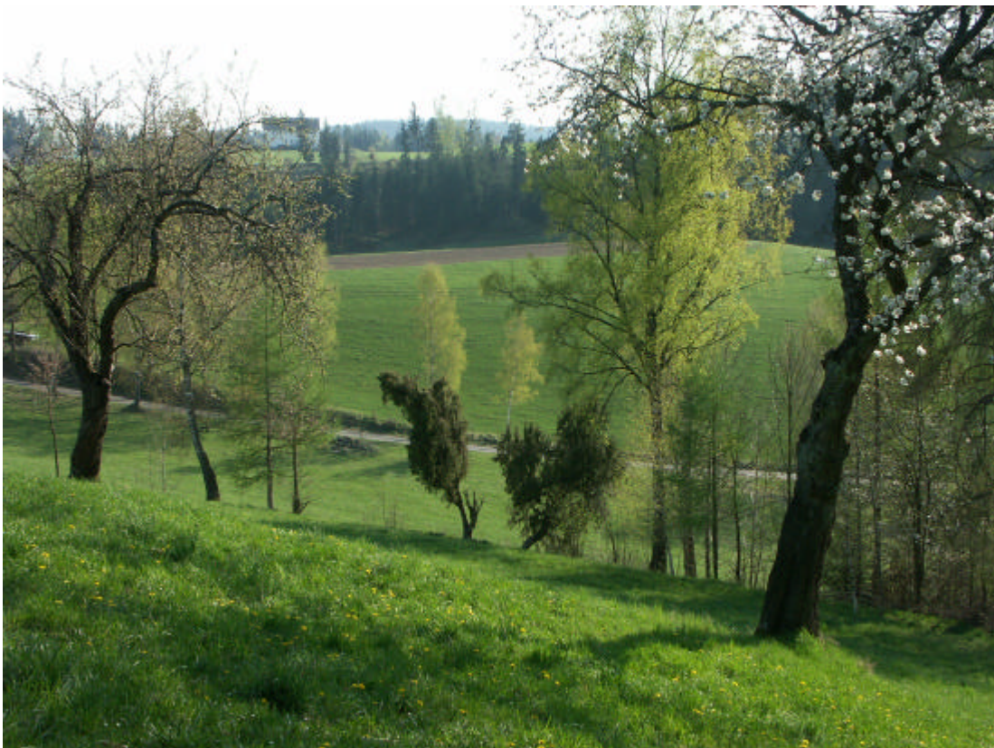
Abb. 10: Frei gestellte und dadurch überlebensfähige Wacholderbüsche in einer Böschungshecke