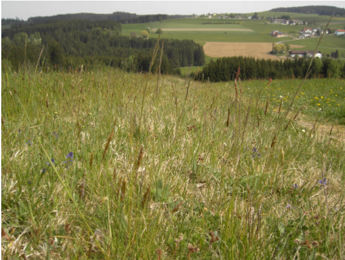
Abb. 17: Bürstlingsrain mit Kreuzblümchen im Osten von Langzwettl