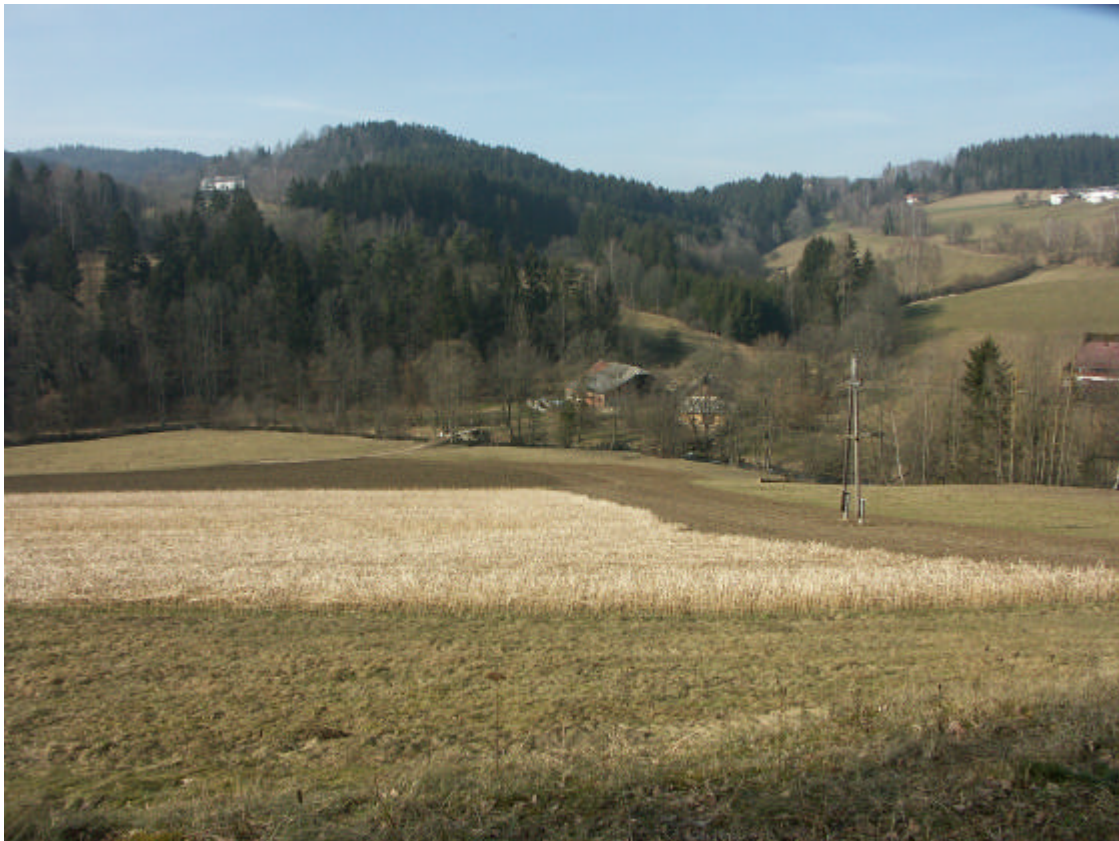
Abb. 5: Laubholzreiche Wälder bei der Mittermühle