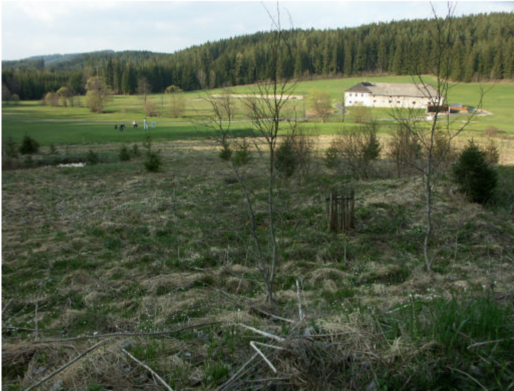
Abb. 13: Blick zum Eder, hinten Golfplatz, vorn verwaltungsgefährdete Brache