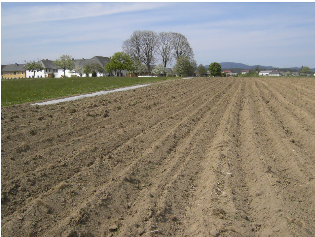
Abb. 16: Langzwettl weist im Ortsbereich landschaftsprägende Gehölze auf