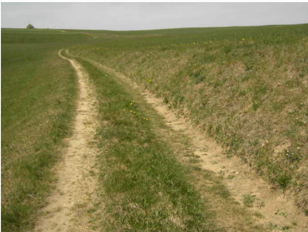
Abb. 14: Weg begleitende Magerwiesenböschungen in der Offenlandschaft Langzwettls