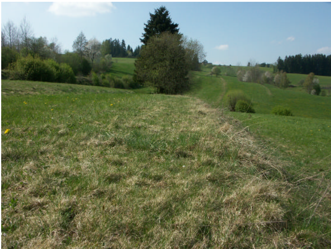
Abb. 6: Wertvolle Stufenrainlandschaft im Nordwesten von Zwettl