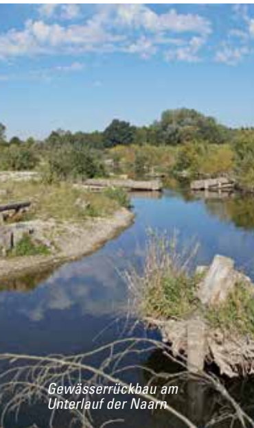
Gewässerrückbau am Unterlauf der Naarn

Naturschutzarbeit bedeutet in erster Linie Managementarbeit. Nur in den seltensten Fällen kann über schutzwürdige Gebiete einfach ein Glassturz gestellt werden und das war's. Vielmehr sind in den meisten Gebieten zahlreiche Maßnahmen erforderlich, um die dortigen Schutzgüter zu erhalten.