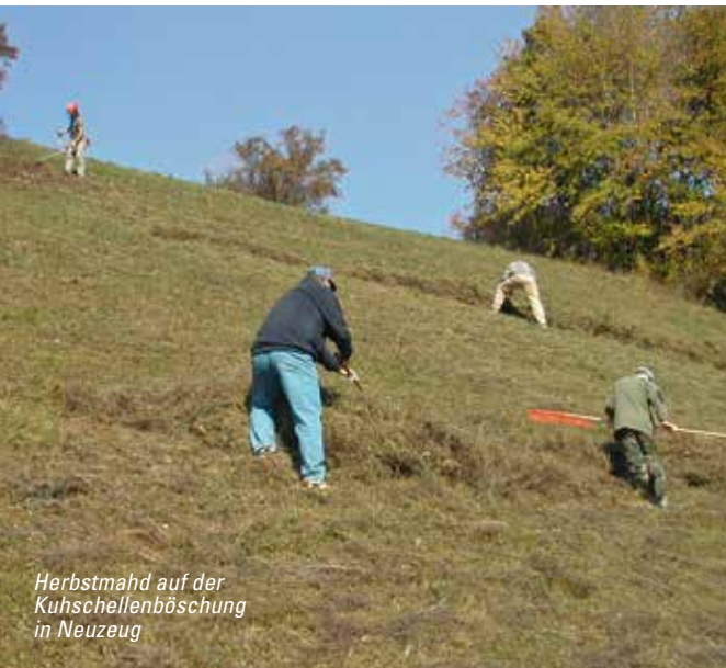
Herbstmähd auf der Kuhschellenböschung in Neuzeug