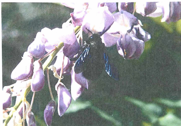
Xylocopa an Glyzinie, Ischia, 05.2005