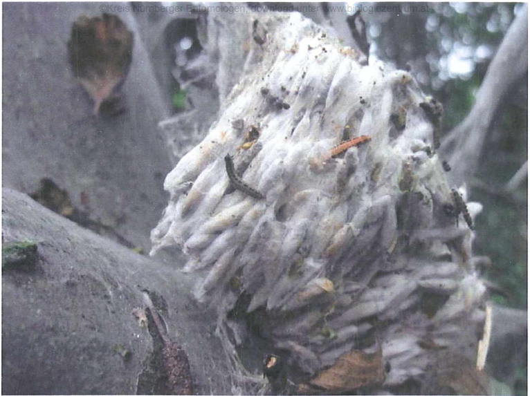
Kokons im Gemeinschafts-Gespinnst