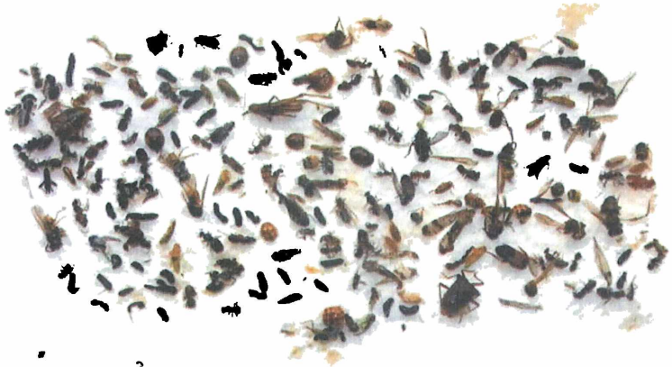
Abb. 2 Erkennbare Insekten(reste) aus dem Forellenmagen

Der Mageninhalt wurde in einer Chinosol-Wasserlösung ausgewaschen und nach dem Auslesen auf Haushaltspapier getrocknet ( s. Abb. 2). Ausgesiebte Chitinkleinteile (Flügel, Beine, Tergite usw.) ergaben nochmals etwa die Menge eines gehäuften Esslöffels. Die Frische der aufgenommenen Flugnahrung wurde durch die erstaunliche Tatsache belegt, dass etwa 1/3 der herauspräparierten geflügelten Ameisen am nächsten Morgen nach dem Trocknen wieder Leben zeigten und umherkrabbelten.