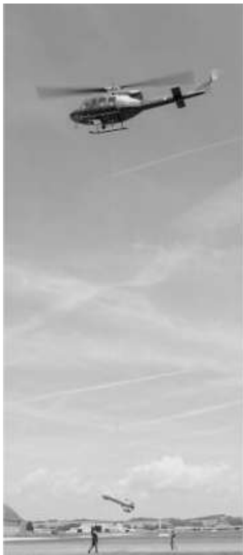
Abb. 3: Hubschrauber und Messsonde der österreichischen Aerogeophysik