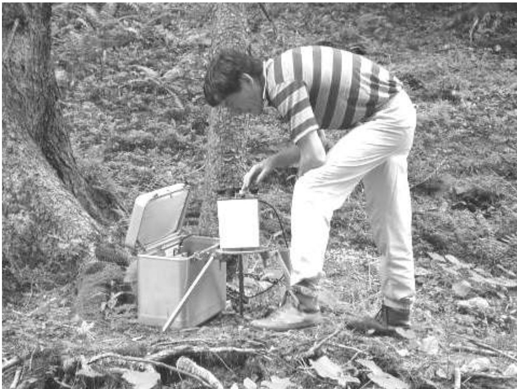
Abb. 1: Geophysiker mit einem Gravimeter