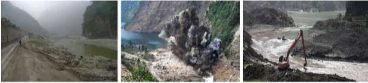
Abb. 8: Links: einer jener Bergsturzseen nahe von Chengdu, der innerhalb weniger Wochen nach dem Erdbeben mit feinem Flusssediment verfüllt wurde; Mitte: der Bergsturzdamm von Shibangao im Norden des Erdbebengebietes musste im Juni 2008 mit 200t Dynamit gesprengt werden; rechts: der Versuch eines kontrollierten Abtragens durch das abfließende Wasser am Tanjiashan Bergsturzsee schlug fehl; der Damm brach und überflutete die bereits evakuierte Stadt Beichuan.