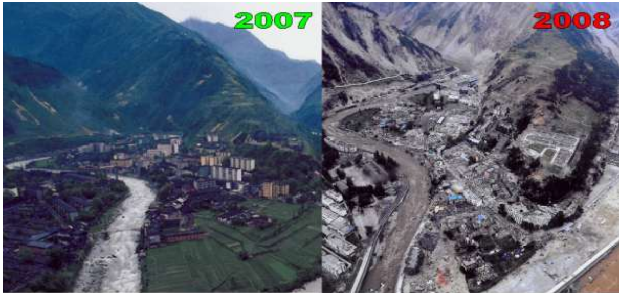
Abb. 3: In Ying Xiu, der Hauptstadt des Bezirks Wenchuan, wurden 90% der Häuser zerstört. Die Bilder vor (links) und nach (rechts) dem Erdbeben vom 12.5.2008 zeigen auch die zahlreichen Veränderungen in der Landschaft in Form von Felsstürzen und Rutschungen.

Die Hauptstadt des Bezirks Wenchuan, Ying Xiu mit dem Ortsteil Yu Zi Xi, liegt nicht nur auf einer der drei oben genannten Störungszonen, sondern lag auch unmittelbar im Epizentrum des Erdbebens. Die Erderschütterungen führten daher dort neben zahlreichen, die Landschaft verändernden Prozessen (Abb. 3) vor allem zum Einsturz der meisten Gebäude (Abb. 4), was sich leider auch in der hohen Zahl an Todesopfern von mehr als 20.000 verdeutlichte. Zu trauriger Berühmtheit gelangte dabei der Gebäudekomplex der zusammengestürzten Mittelschule, der auch in Zukunft als heute als Denkmal erhalten bleiben soll. Der Rest der Stadt soll in den kommenden Jahren wieder neu aufgebaut werden.