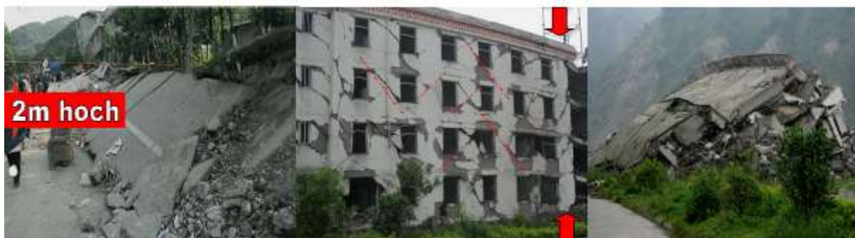
Abb. 4: Links: die vertikale Verstellung der Erdschollen entlang der Störungszone in Ying Xiu betrug ca. 2m (der Bewegungssinn auf dem Bild ist hier von rechts nach links); Mitte: die senkrechten Schwingungen des Erdbebens führten zu gekreuzten Scherrissen in den Gebäuden, so als wären sie in eine Presse geraten; Rechts: viele der Gebäude, wie hier ein Teil der Mittelschule, kollabierten.