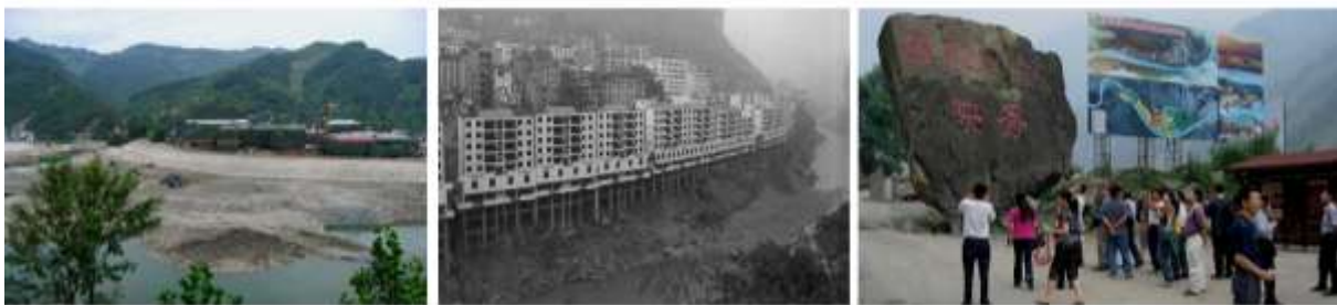
Abb. 9: Links: neu erbauter Stadtteil auf einer mit Erosionsschutz versehenen Flussterrasse; Mitte: Stelzenbauweise auf Felssturzhang und am Flussufer – eine Bauweise, die fatale Folgen haben kann; rechts: Touristen bei der Besichtigung von Wenchuan im Mai 2009.

Die wichtigste Maßnahme ist – neben dem Risikomanagement im Gebirge – die Verminderung des Besiedelungsdrucks im Gebirge und die Verhinderung von Bausünden, die ohne Gefahrenzonenplan begangen wurden. Auch die Aufklärung der Bevölkerung über die Natur- und Gebirgsgefahren im Zuge eines sanften Geotourismus ist dabei von großer Bedeutung. Hier stehen die Chinesen den Europäern um nichts nach (Abb. 9).