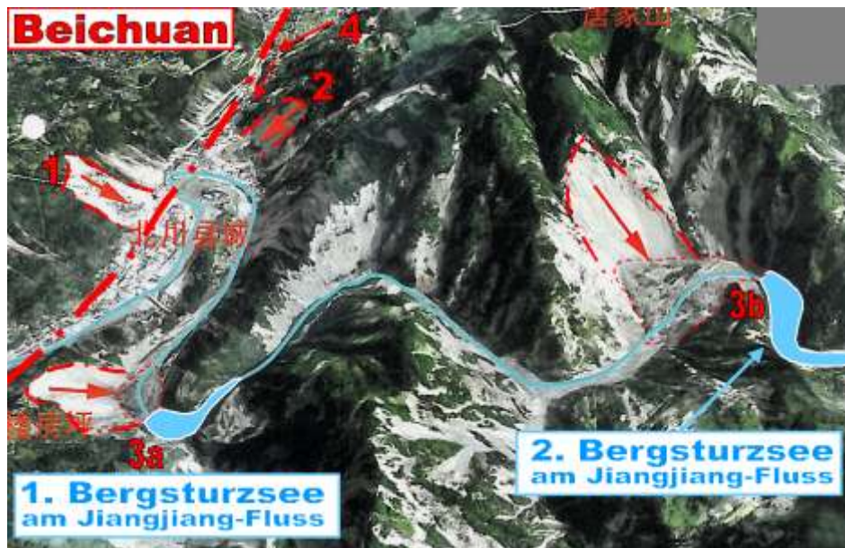
Abb. 5: Ein digitales Höhenmodell der Gegend um Qushan in Beichuan zeigt die Fülle an katastrophalen Ereignissen, die zur völligen Unbewohnbarkeit der ehemaligen Bezirksstadt geführt haben: 1 = Felslawine zerstört Ortsteil um die Mittelschule; 2 = Rutschung zerstört 30 6-stöckige Häuser; 3 = der Baiguoshu-Bergsturzsee (a) und der zuletzt 20km lange Tangjiashan-Bergsturzsee (b) mit einem Volumen von 240 Millionen m 3 brechen aus und überschwemmen die bereits evakuierte Stadt; 4 = eine Mure verwüstet den Südteil der Stadt.

Die Bezirkshauptstadt von Beichuan, Qushan, die – wie Wenchuan – unmittelbar auf einer der Störungen liegt, wurde nicht nur durch das Erdbeben selbst sondern vor allem durch die dadurch ausgelösten Massenbewegungen und ihre Folgeerscheinungen verheerend getroffen (Abb. 5). Alleine ein großer Bergsturz sowie eine große Rutschung zerstörten große Teile der Stadt und forderten 2000 Todesopfer. Drei weitere Rutschungsdämme führten zum Aufstauen mehrerer Seen entlang des Jiangjiang-Flusses, die wenige Tage bzw. Wochen nach dem Erdbebenereignis ausbrachen und die bereits evakuierte Stadt abermals verwüsteten. Damit nicht genug, kam es erst nach Monaten zu einer gewaltigen Murkatastrophe im Südteil der Stadt. Dabei wurden durch das Erdbeben zuvor gelockerte Gesteinsmassen im Zuge von starken Monsunregenfällen mobilisiert. Die Stadt ist heute eine Gedenkstätte und darf weder bewohnt noch betreten werden. Alle überlebenden Einwohner wurden abgesiedelt.