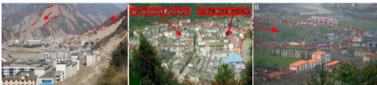
Abb. 6: Links: eine Felslawine begräbt die Mittelschule in der Neustadt 40m unter sich und fordert 500 Tote; Mitte und rechts: eine Rutschung trifft die Altstadt und fordert 1600 Todesopfer.

Die dicke strichpunktierte Linie zeigt den Verlauf der tektonischen Störung direkt in der Stadt.