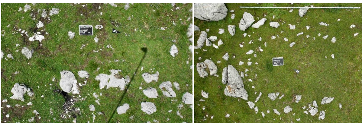
Abb. 16 (links): Abgeflachte Fundamentsteine eines Blockbaues aus der mittleren Bronzezeit.

Fundort: Königreich, östliches Dachsteingebirge, 1635 m