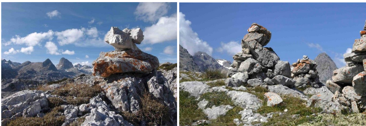
Abb. 4 (links): Steintaube aus zwei scharfkantigen Steinen. Die darunter liegenden Steine sind teils kantengerundet, weisen aber auch Frostrisse und Ausbrüche auf. Fundort: östliches Dachsteingebirge, 2100 m

Wegmarkierungen, sog. Steintauben können aus einen und mehreren Steinen bestehen. Dagegen sind „Steinmänner“ Auftürmungen von Steinen, die eine Höhe von bis zu zwei Metern erreichen können. Die Steintauben an begangenen Wegen werden immer wieder ausgebessert und bleiben selten über längere Zeit unberührt. Für die Errichtung und Ausbesserung von Steintauben werden Steine, die sich gut übereinander schichten lassen, verwendet. Dies sind meist flache und scharfkantige Steine (siehe Abb. 4 und 5).