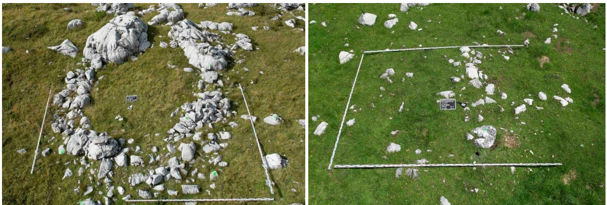
Abb. 12 (links): Verfallene spätmittelalterliche Trockenmauer. Fundort: Langkar, östliches Dachsteingebirge, 1956 m

Der Steinkranz einer verfallenen spätmittelalterlichen Almhütte besitzt bereits auffällig gerundete Steine (siehe Abb. 12; MANDL 2009, 32). Mehrere Steine sind durch Frosteinwirkung zerbrochen. Die beiden großen Steinblöcke im Nordbereich zeigen die typischen Auflösungserscheinungen. Von den 800 Jahre alten Bausteinen sind 8 mm Denudationsabtrag zu veranschlagen. Ein weiteres Merkmal tritt ab der Römerzeit auf (HEBERT 1998, S. 206f). Die nur wenige Zentimeter aus der Grasnarbe ragenden Fundamentsteine erhalten neben der Kantenrundung eine abgeflachtere Oberfläche (siehe Abb. 13). Laut Berechnung sind für 1.700 Jahre 17 mm an Denudationsabtrag zu veranschlagen.