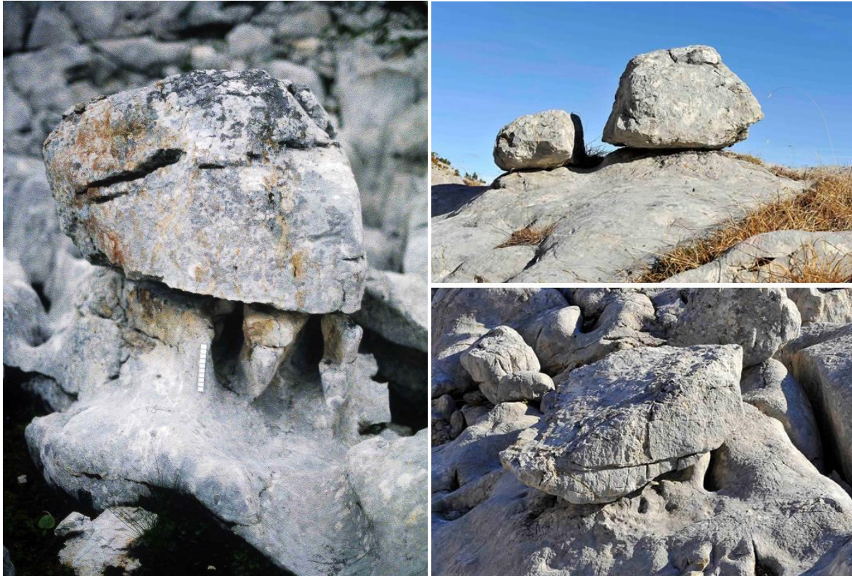
Abb. 1 (links): Karsttisch mit einer ca. 20 cm hohen Denudationsstufe. Fundort: östliches Dachsteingebirge, 2000 m