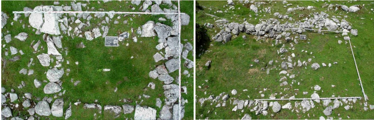
Abb. 10 (links): Frühneuzeitliches Fundament aus Steinen für einen Blockbau. Fundort: Königreich, östliches Dachsteingebirge, 1650 m

Die frühneuzeitlichen Steine der Fundamente auf Abbildung 10 und 11 sind bereits merklich kantengerundet. An den Bausteinen ist ein Denudationsabtrag von mehreren Millimetern feststellbar.