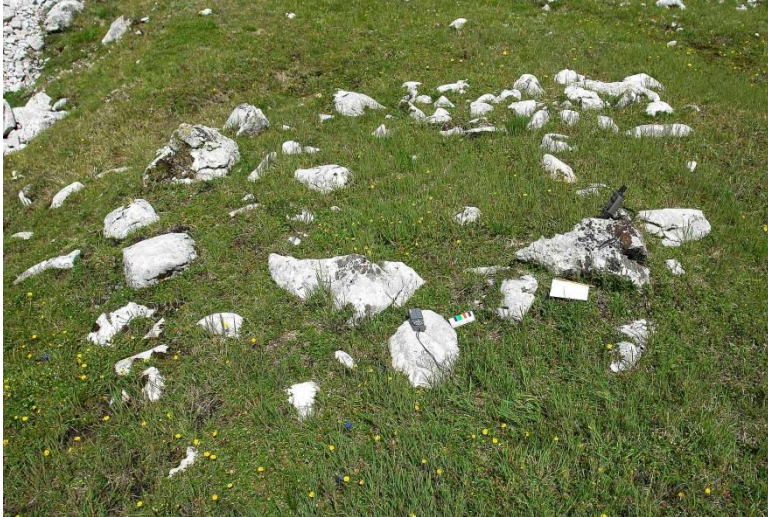
Abb. 18 (links): Fundamentsteine eines Blockbaues aus der mittleren Bronzezeit. Fundort: Speikgrube, östliches Dachsteingebirge, 1827 m