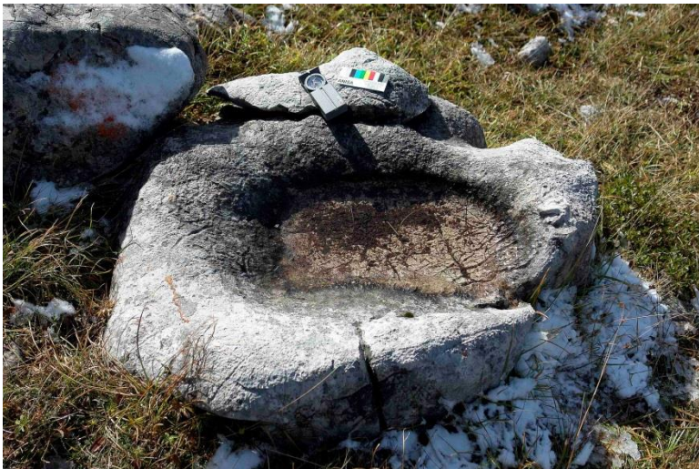
Abb. 19 (rechts): Wanne aus Dachsteinkalk. Bronzezeit? Fundort: Dreitaubensteig, östliches Dachsteingebirge, 2020 m