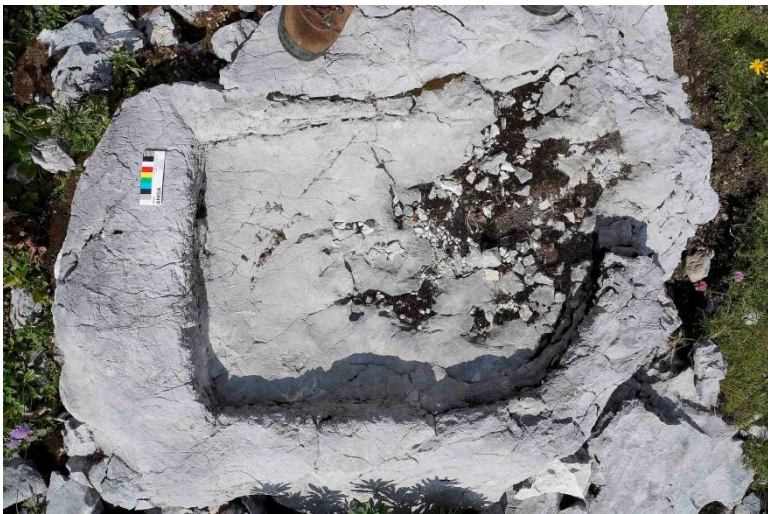
Abb. 20: Wanne aus Dachsteinkalk. Neuzeit. Fundort: Tennengebirge, 1890 m