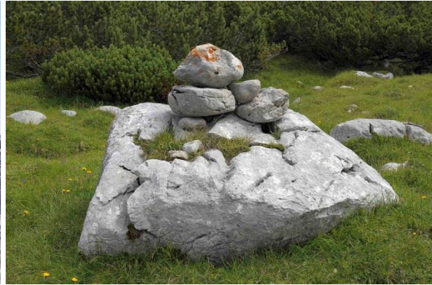
Abb. 6 (links): Steintaube aus zwei kantengerundeten, Steinen. Der darunter liegenden Fels weist Frostaussplitterungen und Karrenbildung auf. Fundort: östliches Dachsteingebirge, 2100 m