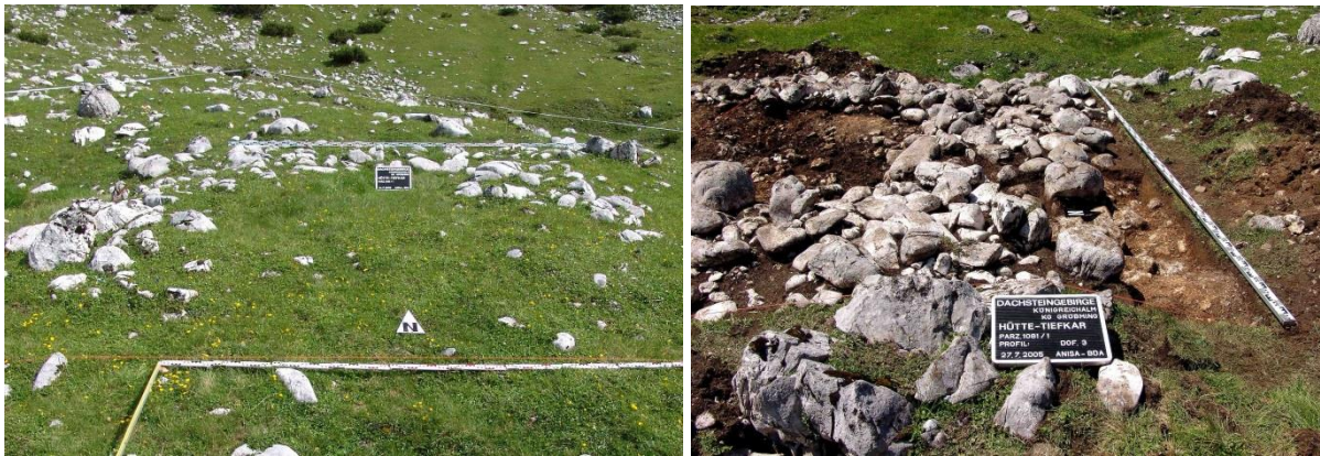
Abb. 14 (links): Fundamentsteine eines Blockbaues aus der mittleren Bronzezeit.

Als letztes Beispiel sollen hier zwei Wannen aus Dachsteinkalk vorgestellt werden. Eine liegt am Weg zum Dreitaubenkogel (siehe Abb. 19). Die Wanne weist stark gerundete Ränder auf. Teile sind durch Frosteinwirkung abgesprengt worden. Wir können eine Auflösung von mehreren Zentimetern für eine Altersbestimmung heranziehen. Eine Zuordnung in die Bronzezeit ist möglich. Nur wenige Meter davon entfernt konnte eine bronzezeitliche Hütte nachgewiesen werden (MANDL 2006, 22-27). Dagegen weist die neben einer verfallenen neuzeitlichen Almhütte liegende Steinwanne vom Tennengebirge nur Kantenrundungen von mehreren Millimetern auf. Die Frosteinwirkung in Form von Ritzen und Aussprengungen ist jedoch hoch (siehe Abb. 20).