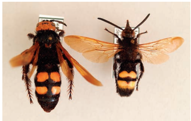
Abb. 5: Scolia s. sexmaculata (O.F. MÜLLER): ♀ Villach Umg., Groß-Vassach, 540 m, 14. VII. 2002, leg. C. Holzschuh, ♂ ebendort, 30. VI. 2003, leg. C. Holzschuh, beide in Coll. W.Schedl. (unten r.)