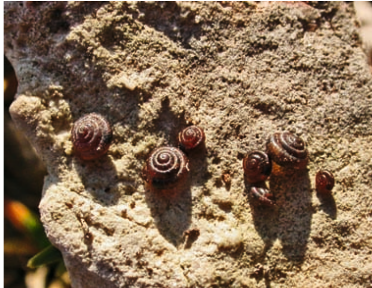
Abb.7: Pyramidula pusilla – Die Felsen-Pyramidenschnecke war in allen felsigen Standorten häufig.