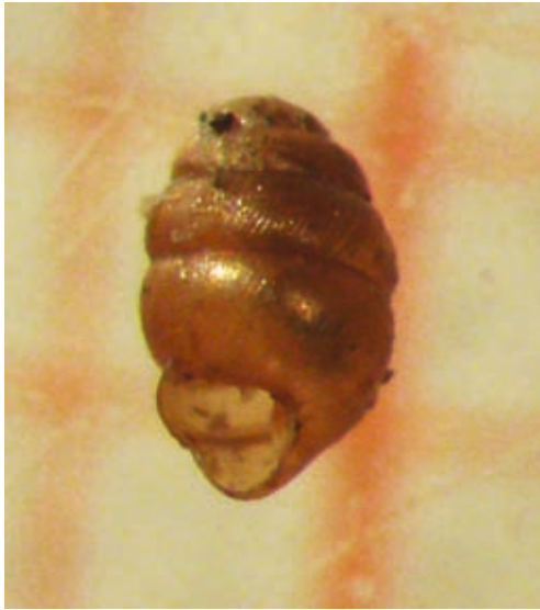
Abb. 2: Vertigo angustior – Die Schmale Windelschnecke (Anhang 2 der FFH Richtlinie) konnte an 6 Standorten des Schlerngebiets nachgewiesen werden.

Uferbereiche und Verlandungszonen. Die nasse Moorwiese östlich des durchgängigen Fußwegs um den See hat dagegen etliche Besonderheiten zu bieten (Abb. 13). Das Artenspektrum ist, abgesehen von den Süßwassermollusken, vergleichbar, der beträchtliche Unterschied in der Individuenzahl spiegelt die höhere Sammelintensität am Hauptstandort Völser Weiher wieder.