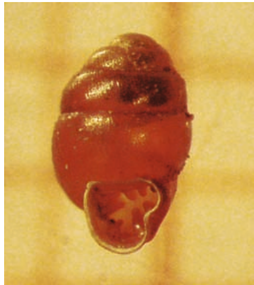
Abb. 5: Vertigo antivertigo – Die Sumpfwindelschnecke (RL4) wurde nur in wenigen Exemplaren um den Völser Weiher und in Tiers nachgewiesen.