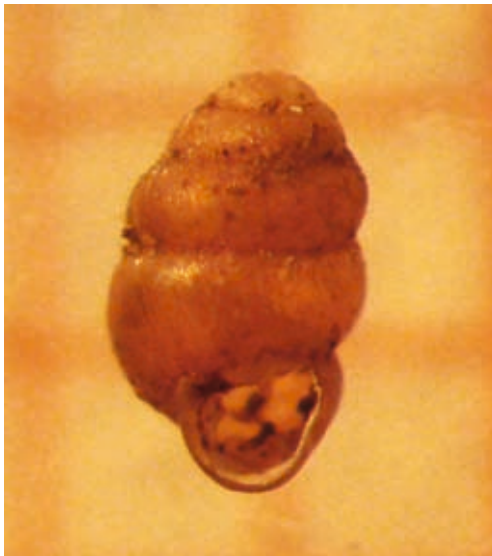
Abb. 4: Vertigo geyeri – Die Vierzählige Windelschnecke (RL1, Anhang 2 der FFH Richtlinie) konnte am Völser und am Huber Weiher gefunden werden.