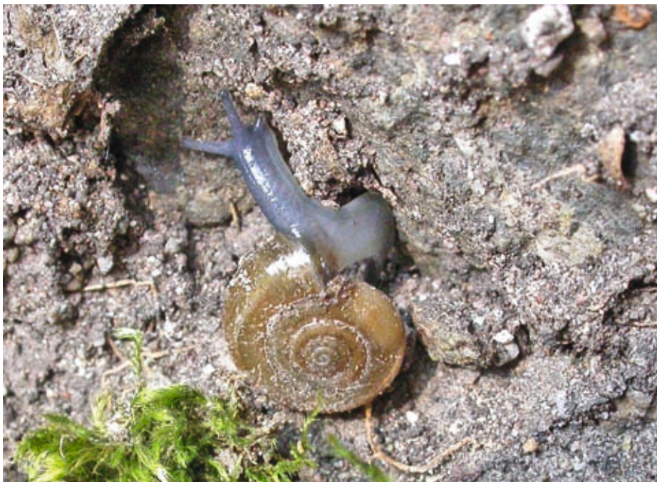
Abb.8: Oxychilus cellarius – Die Kellerglanzschnecke an der Mauer von Schloss Prösels.