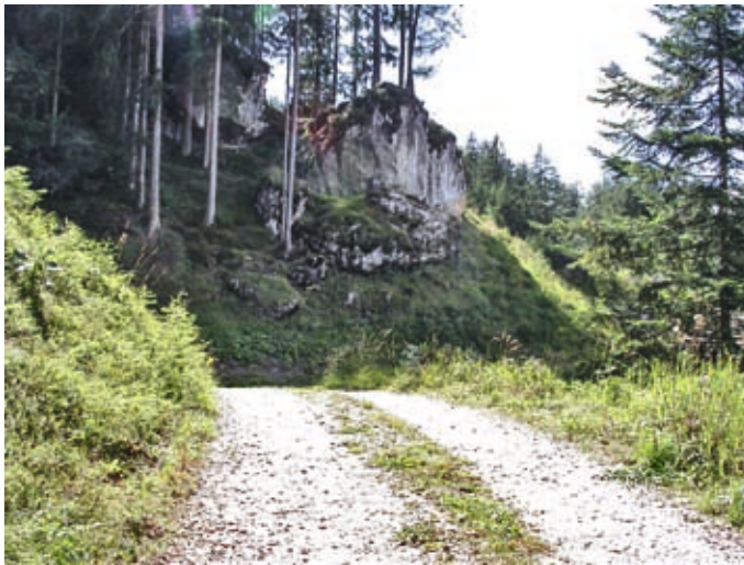
Abb. 9: Habitat von Oxychilus depressus im Hauensteiner Wald. Die Flache Glanzschnecke ist eine neue Art für Südtirol.