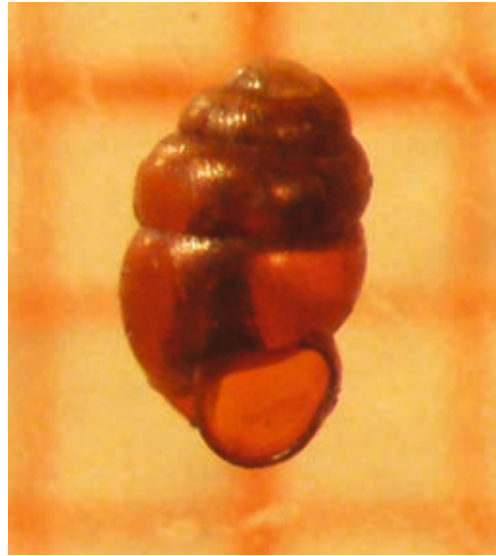
Abb. 3: Vertigo genesii – Die Blanke Windelschnecke (RL1; Anhang 2 der FFH Richtlinie) lebt in Moorstandorten auf dem Schlernplateau und der Seiser Alm.