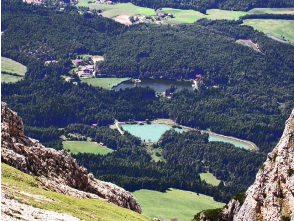
Abb. 13: Blick von Osten auf den Huberweiher (im Bild unten) mit der Moorwiese im Osten und den Völser Weiher mit Verlandungszone im Süden (links) – aus Naturschutzsicht stark bedrängte Fundorte von Vertigo geyeri und Vertigo angustior . Oben rechts im Bild zwei weitere Fischweiher.