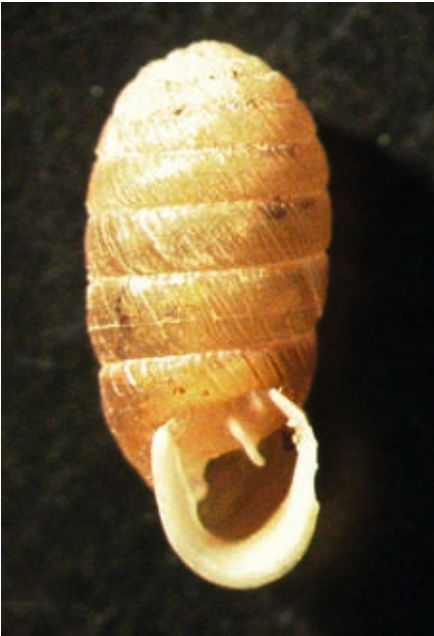
Abb.6: Sphyradium doliolum – Die Fässchenschnecke war in Prösels, am Brandhang und in der Lärchenweide vertreten.