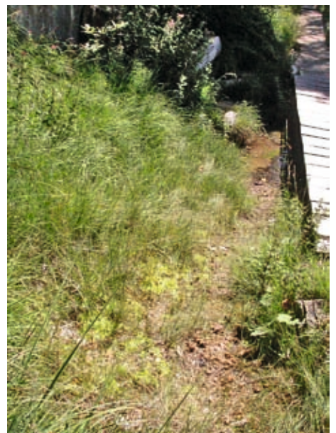
Abb. 12: Das winzige Quellmoor im Brandhang – einer der Fundorte von Vertigo angustior .