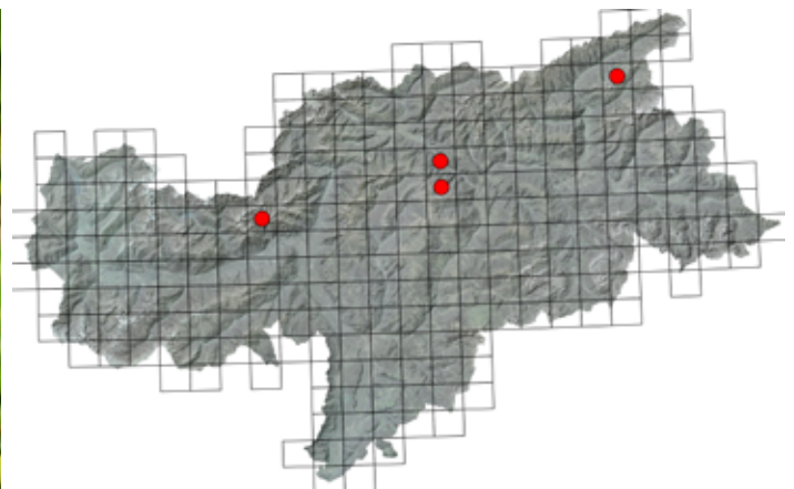
Abb. 2: Botrychium lanceolatum, Durra-Alm, 07.08.2016 und Nachweise der Art in Südtirol (roter Punkt = Nachweis im Rasterfeld nach 1980).