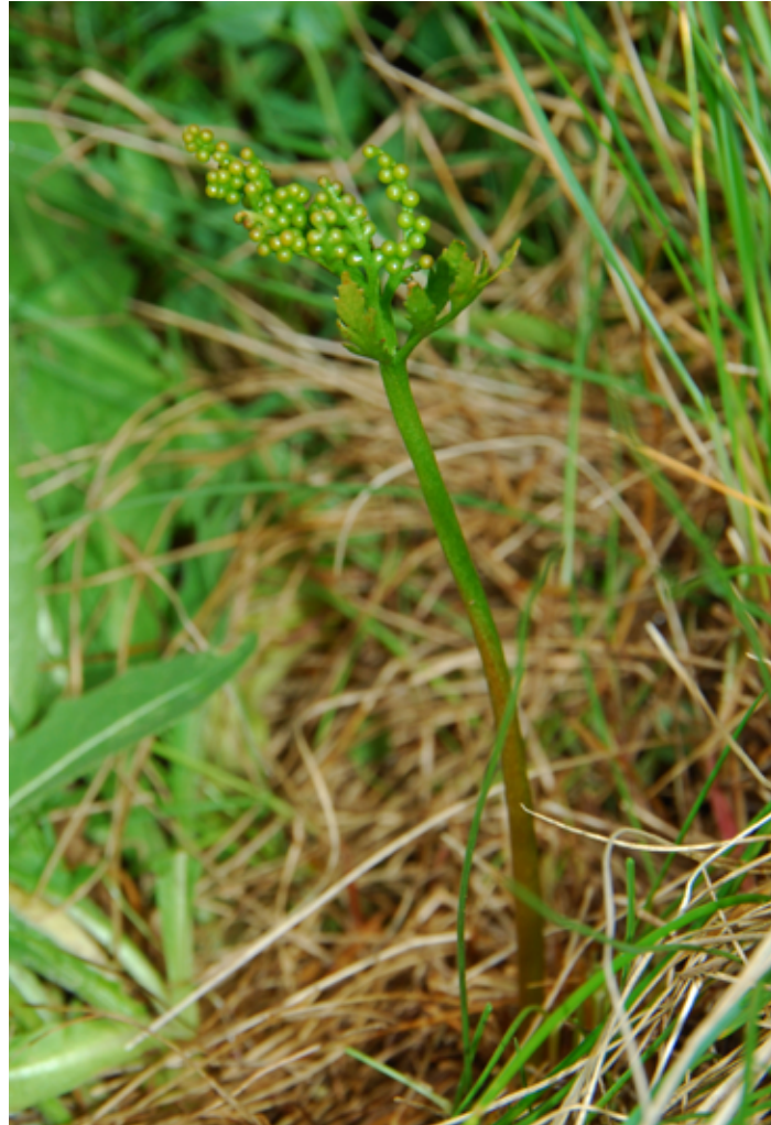
Abb. 1: Botrychium lanceolatum, Zielalm, 14.07.2016