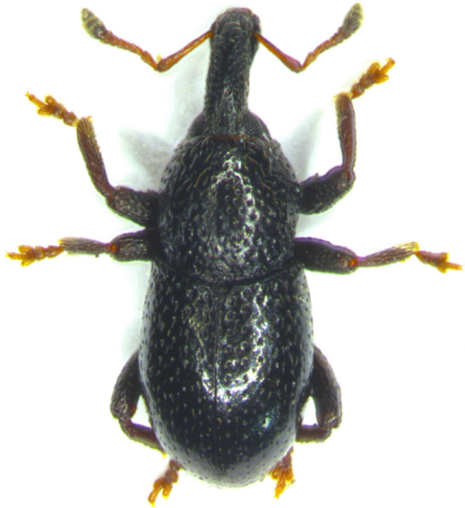
Fig. 5: Habitus L. kirschii della Val Pusteria (esemplare raccolto nel 2015)