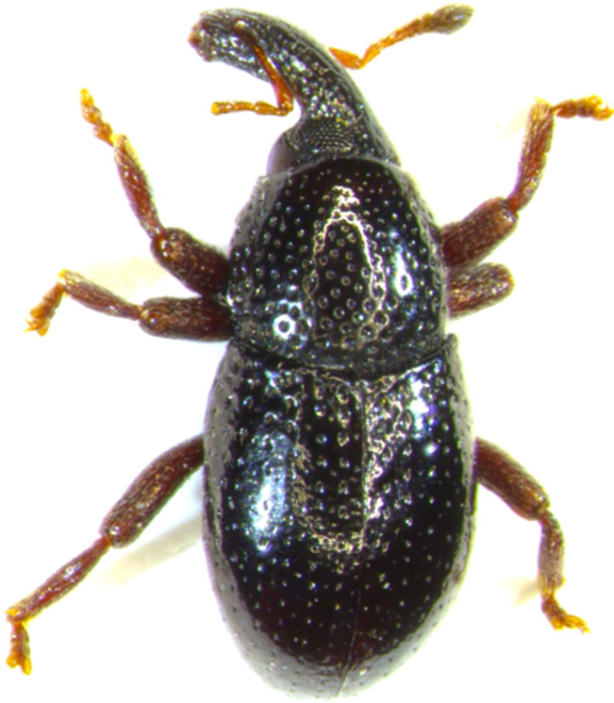
Fig. 1: Leiosoma kirschii (Lectotypus)

Elitre ovali, più lunghe che larghe, con un rapporto lunghezza/larghezza pari a 1,50, con la massima ampiezza alla metà e leggermente ristrette all'apice. Superficie del dorso piana e con lievissima microscultura. Strie elitrati costituite da punti nettamente ovali, gradualmente ridotti di dimensioni divenendo quasi impercettibili e diradati verso l'apice elitrato; superficie liscia e piana fra un punto e il successivo; intervalli elitrati piani con punti ben distanziati tra loro di un terzo più piccoli di quelli delle strie. Rivestimento elitrato formato su dorso e lati da finissime e corte setole bianchicce rivolte all'indietro. Zampe rivestite da setole giallo-oro, presenti soprattutto nella parte terminale delle tibiae; tutti i femori sono armati di un piccolissimo dente appuntito, spiniforme (Fig. 2); nei femori anteriori il piccolo dente risulta più evidente.